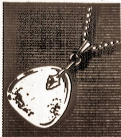
Precious Amber Nugget With Golden Rope Chain. KAINA $6.00

giausia žmonių: 28,5 gyventojai iš tūkstančio. Visose šalyse, kur pavyko surinkti statistikos duomenis, 45-64 metų žmonės daugiausia miršta nuo vėžio ligos.