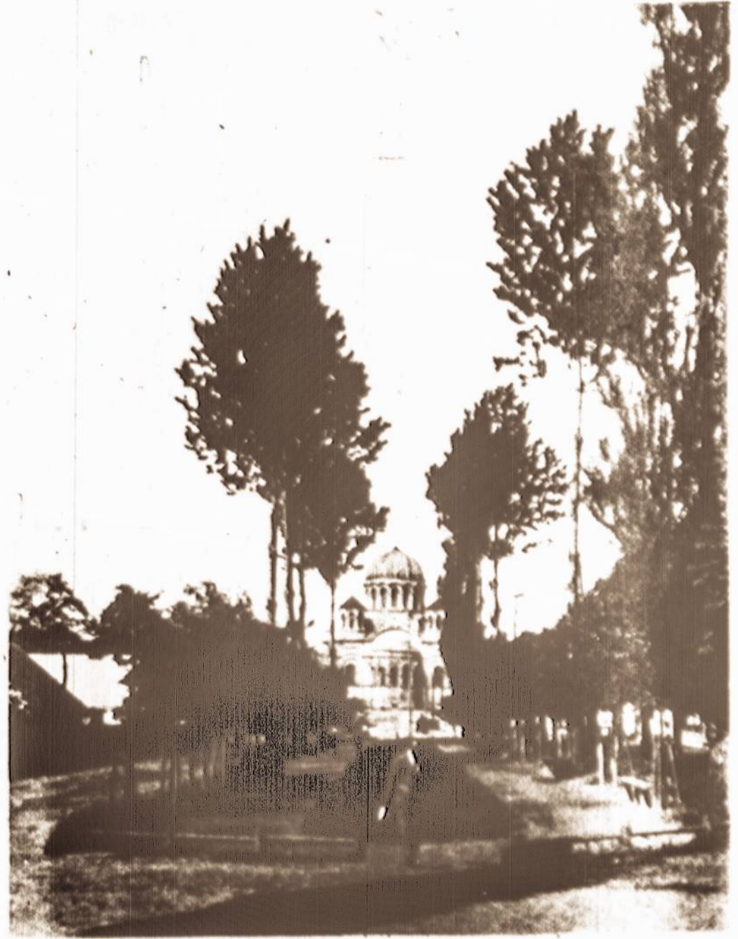
Taip atrodė Kauno Laišvės Alėja pirmaisiais Lietuvos nepriklausomybės metais.

Laikrodininkas - Juvelyras Didelis pasirinkimas BRANGENYBIŲ 485 Grand Street Brooklyn 11, N. Y. Tel. EVergreen 4-2318