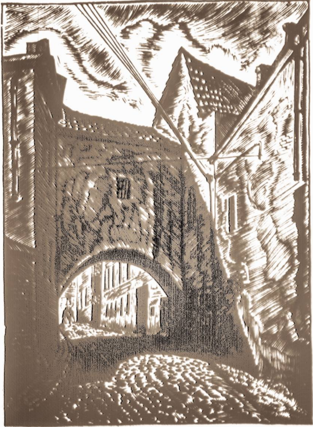
VILNIUS. VITO G. VĖ