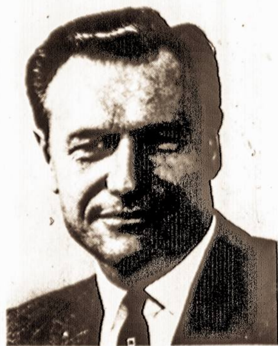
NELSON A. ROCKEFELLER

Rockefeller turi didelį patyrimą visuomeniniame gyvenime.