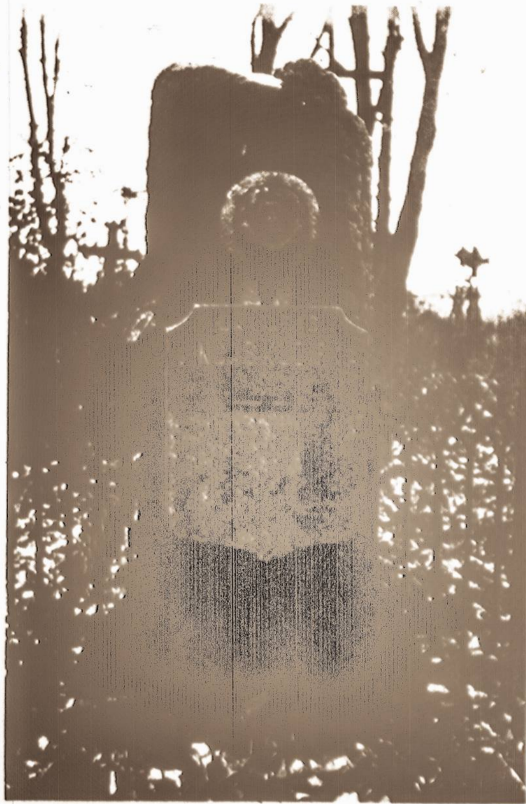
Dr. Vinco Kudirkos antkapis Naumiestyje.