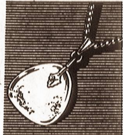
Precious Amber Nugget With Golden Rope Chain. KAINA $6.00