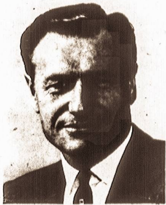
NELSON A. ROCKEFELLER

Jis nori, kad darbininko teisės į pensijas būtų apsaugotos ir tada, kai jis keičia darbą.