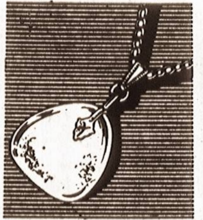
Precious Amber Nugget With Golden Rope Chain. KAINA $6.00