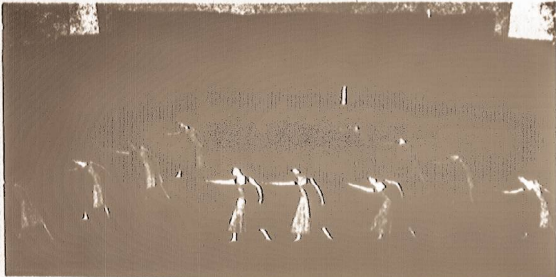
Moderniojo šokių mokyklos šokėjos viename iš savo rečitalių National Music Camp, Interlochen, Michigan