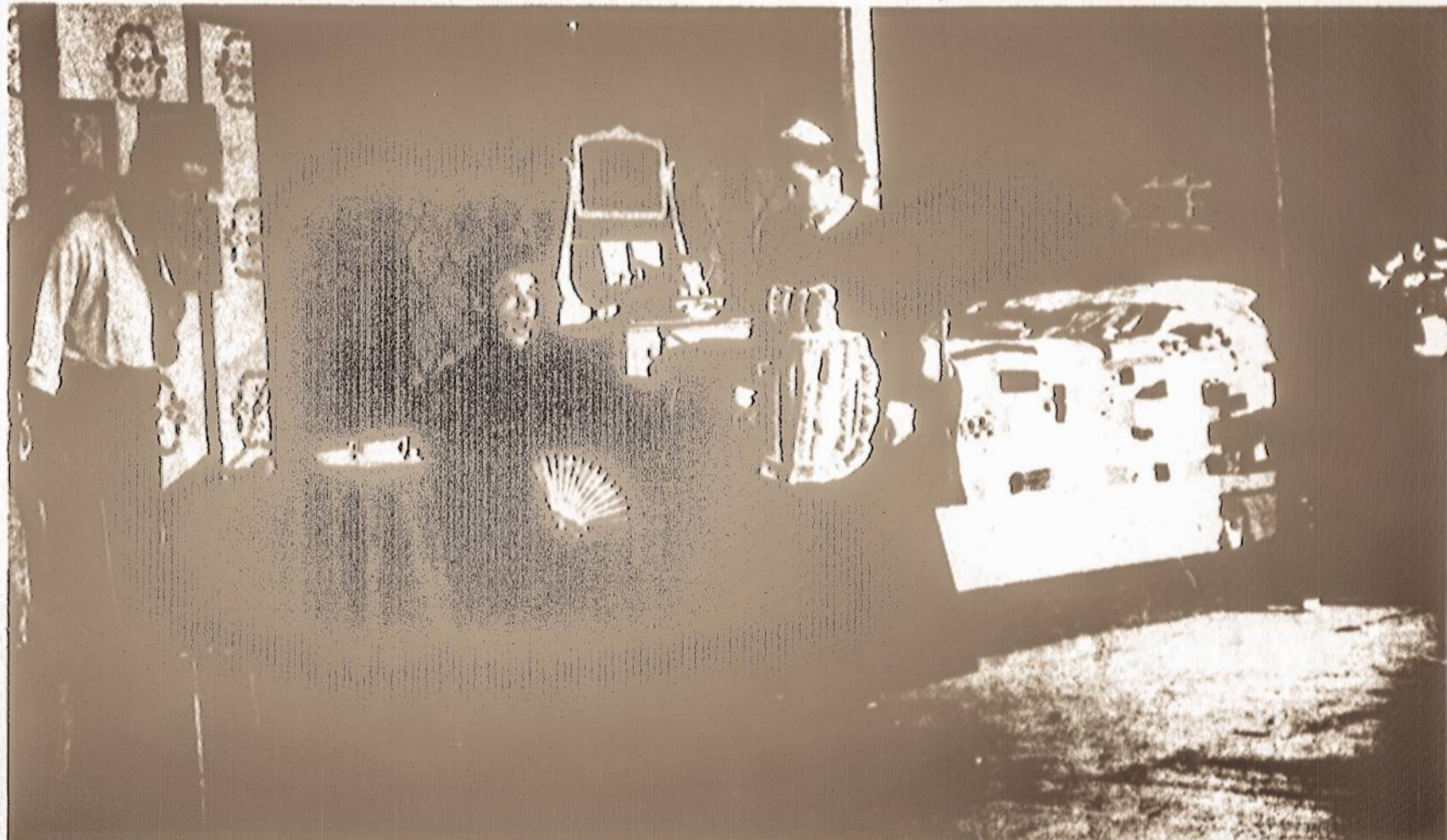
Populiari Menotti opera "The Old Maid and the Thief", dažnai statoma Interlochen, Mich.