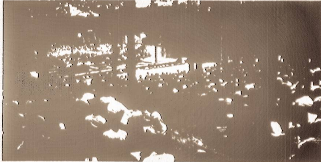
Vienas iš National Music Camp teatrų po atviru dangum, kur vyksta operų spektakliai ir orkestro koncertai.

dainavimo profesorius ir įvairių Amerikos operų kompanijų dalyvis, bei eilė kitų žinomų Amerikos muzikiniame gyvenime asmenybių. Specialiai studijuojantiems muziką, dalyvavimas šioje stovykloje duoda visur pripažįstamą kreditą.