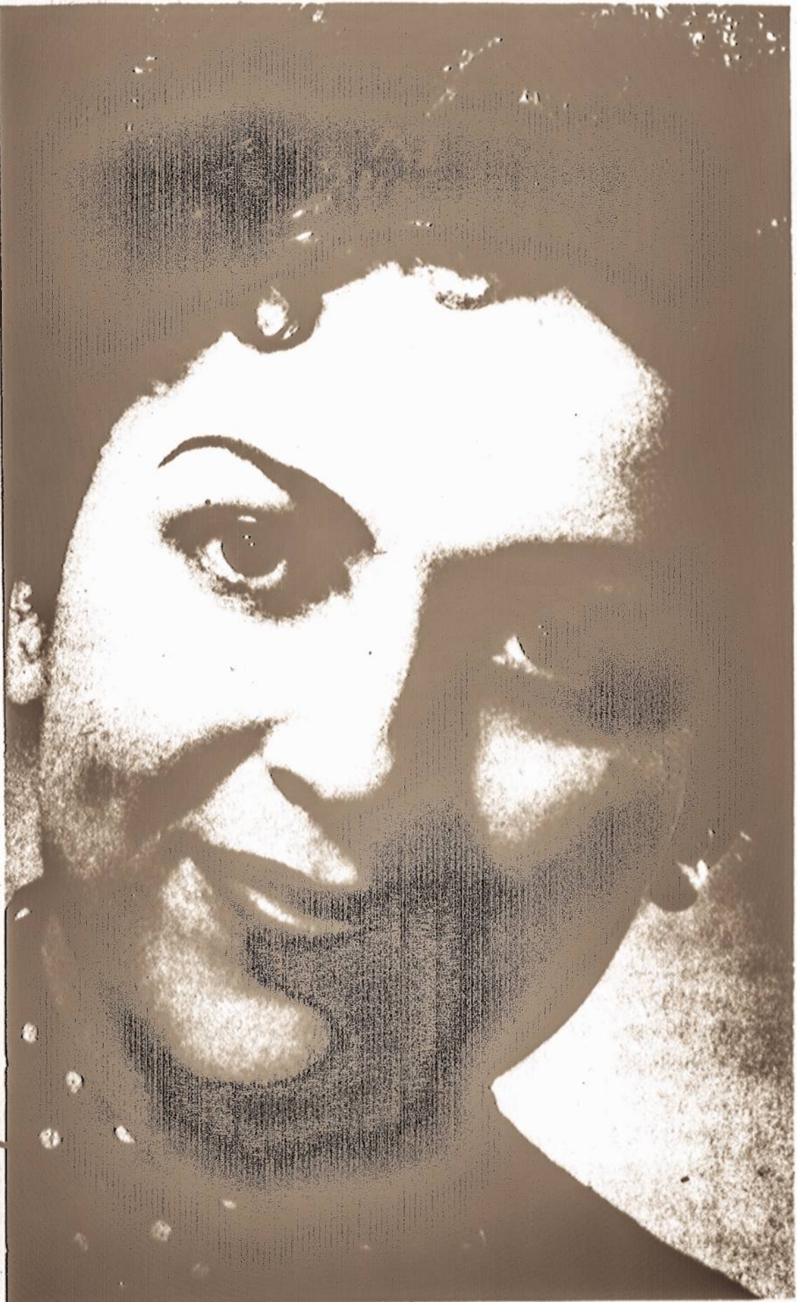
REŽISORĖ BIRUTĖ PŪKELEVIČIŪTĖ