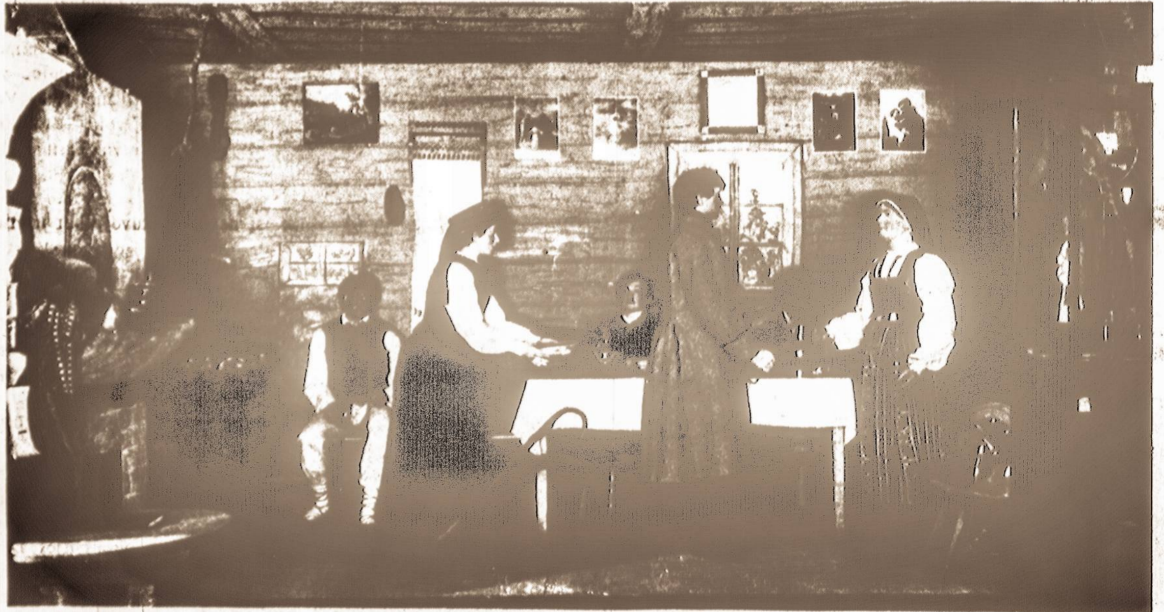
Lietuviška grėčia Paryžiaus parodoje 1900 metais.

Taigi šis albumas vaizdžiai parodo, kaip galvojo mūsų Lietuvos veikėjas net 18 metų prieš Lietuvai atgausiant nepriklausomybę. Jis pats degė meile savajam kraštui ir kituose savo broliuose jį kurstė.