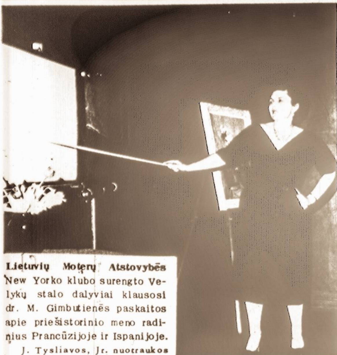
Lietuvių Moterų Atstovybės New Yorko klubo surengto Velykų stalo dalyviai klausosi dr. M. Gimbutienės paskaitos apie priešistorinio meno radinius Prancūzijoje ir Ispanijoje.

N. Y. LIETUVIŲ FILATELISTŲ DRAUGIJOS NARIAI