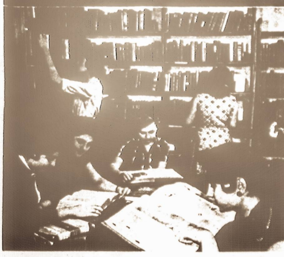
ŠIŲ DIENŲ TURKIJOS MOTERYS

dujų. Egipte tokių išvedžiojimų niekad nesame girdėję. - Ko- rane hitaip pasakyta, ir jokių kitokių interpretacijų būti ne- gali.