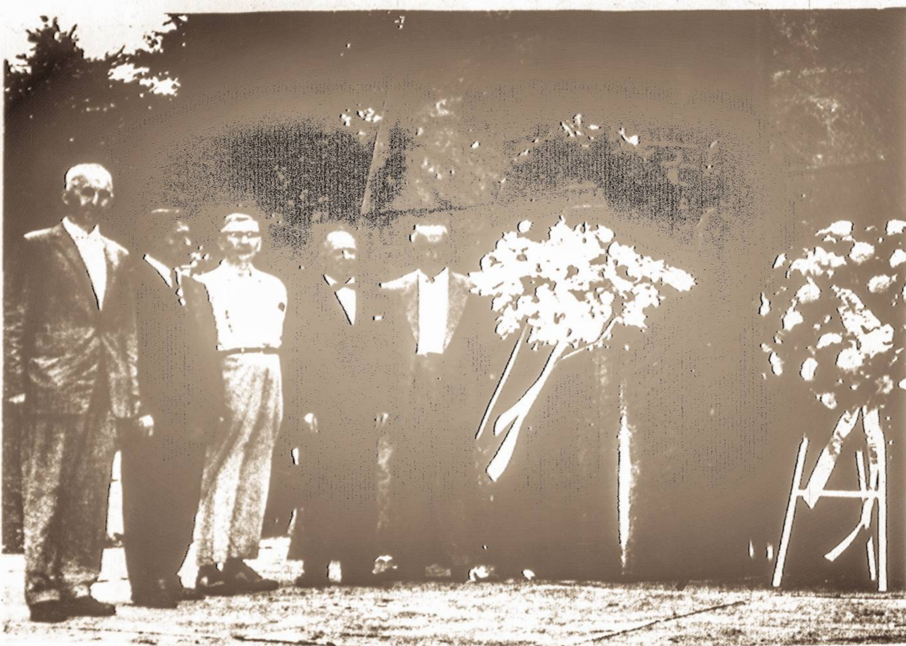
Buvę kpt. S. Dariaus draugai, Lietuvos armijos karininkai, dabar gyvenantieji Chicagoje, prie lakūnų paminklo liepos 19 d.