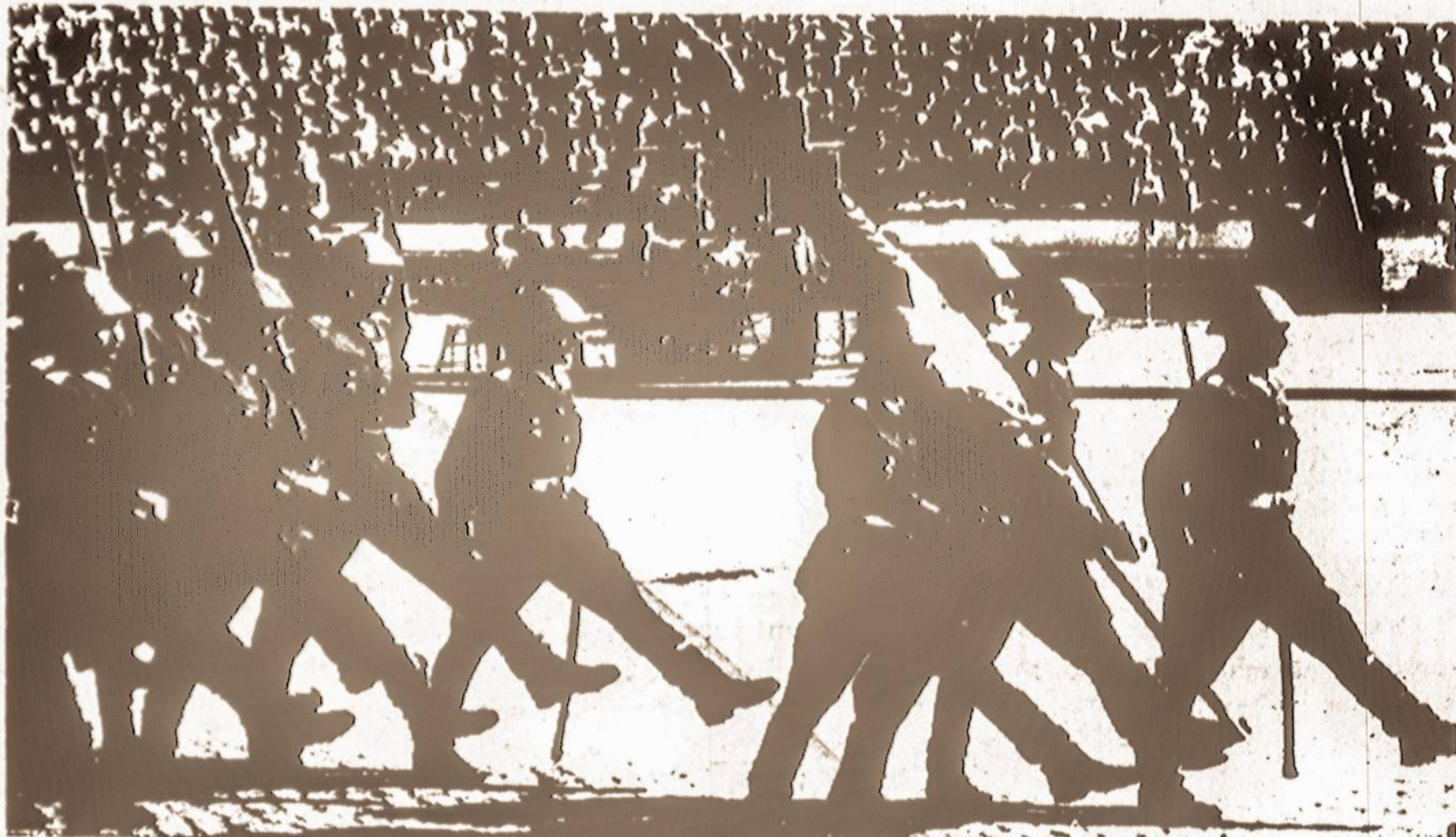
Dabartinė raudonoji vokiečių armija: žingsnis liko Hitlerio, falmas (ir smegenys) rusiškai suploktinti.