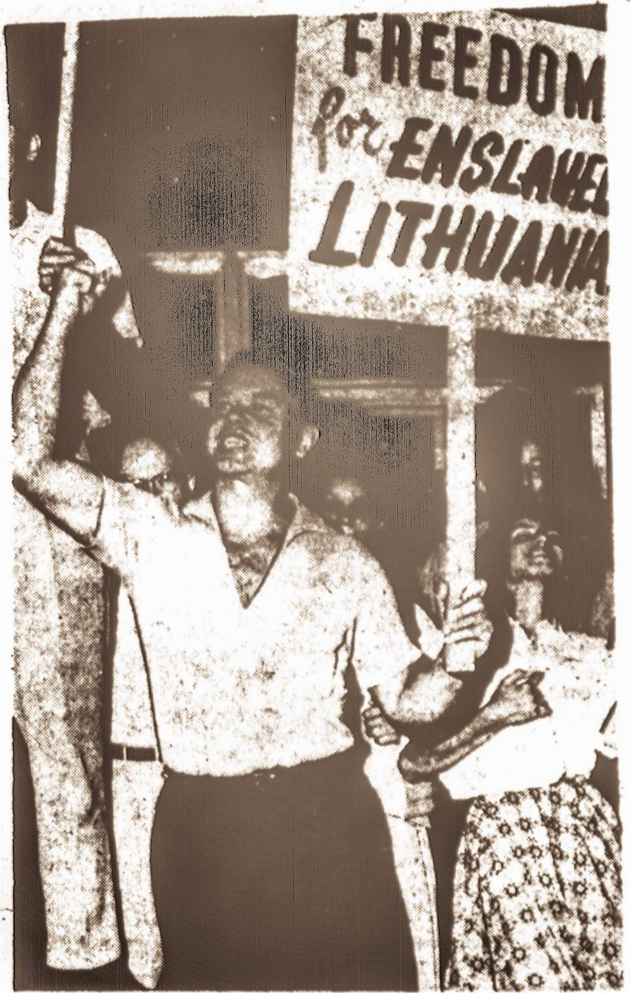
Taip Chicagos lietuviai pasitiko ir išlydėjo Sovietų Sąjungos vicepremjerą F. Kazlovą.