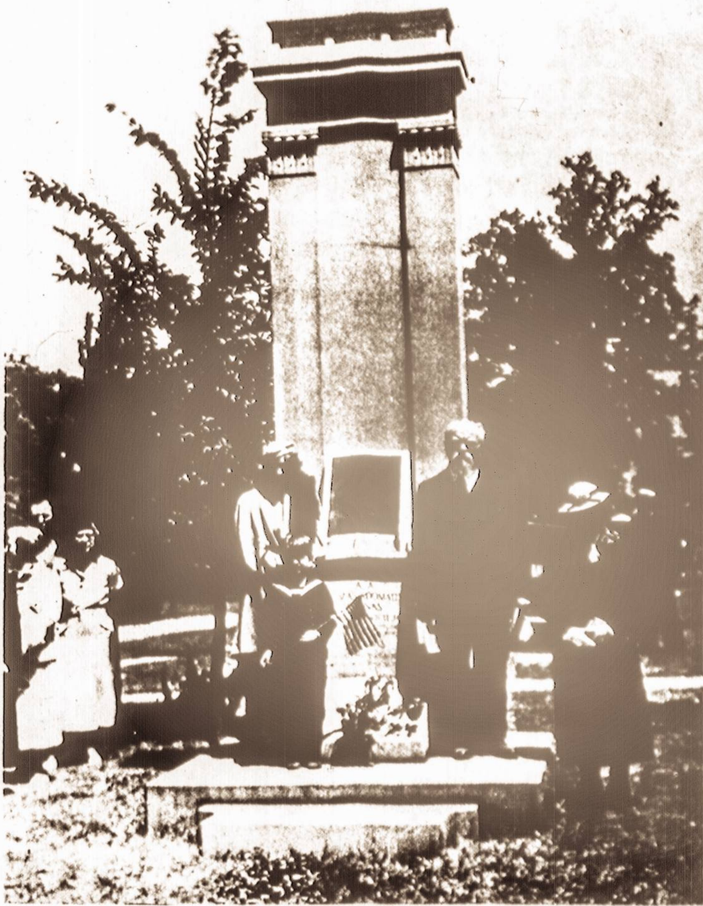
Aušrininkas dr. Jonas Šliupas su šeima prie paminklo Lietuvos redaktoriui Juozui Adomaičiui (Šernui). Ir paties Šliupo pelenai yra palaidoti tose pat kapinėse.

.... Daug visokių užmanymų kečiama Chicagoj tarp lietuvių. Užmano draugijos ir pavieniai asmenys, tik daugiausia tie užmanymai lieka už-