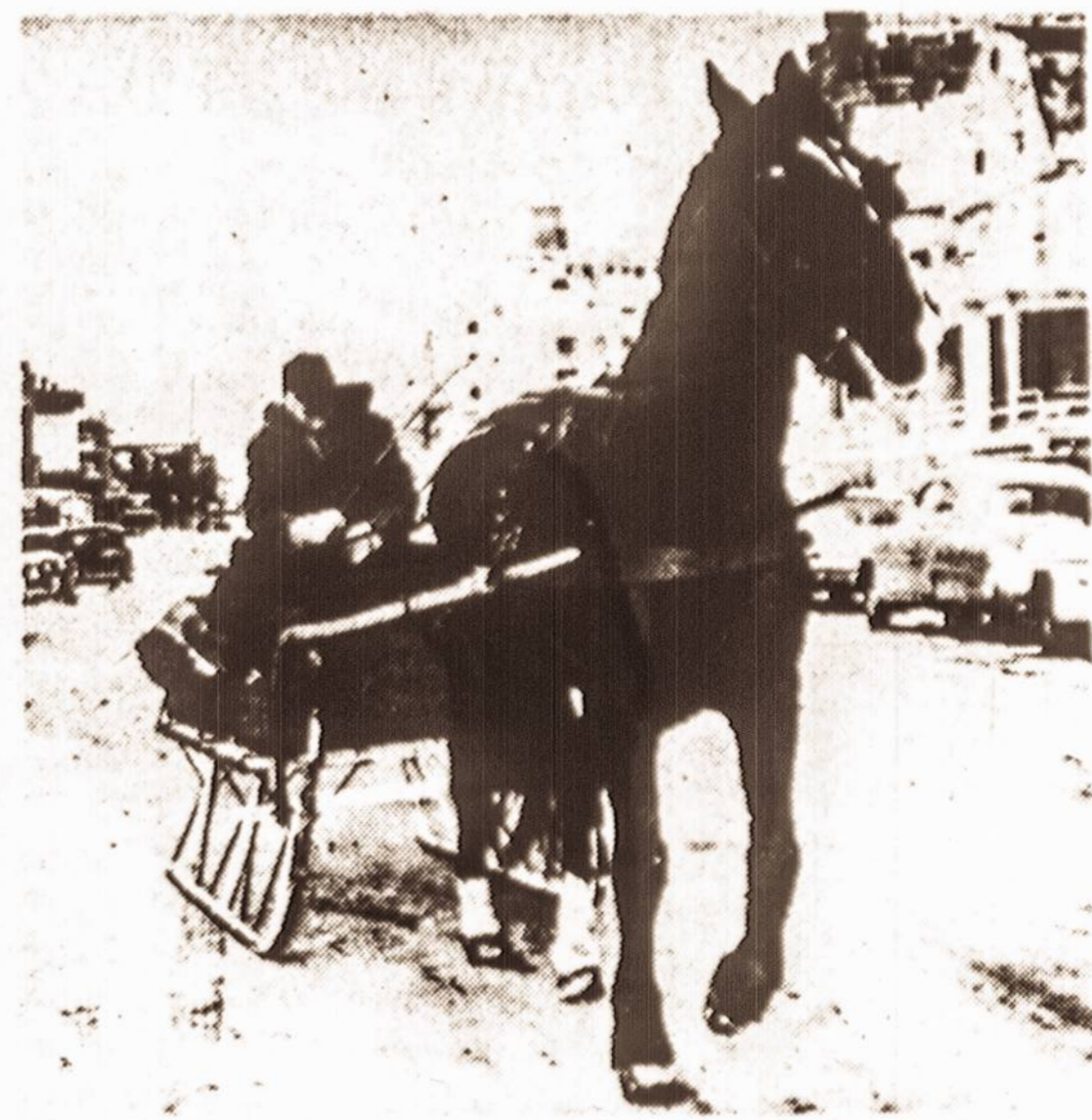
Amerikos rytinių pakraščių gyventojai neatsimena tokios šaltos žiemos, kaip šių metų žiema su savo nuolatiniu šalčiu ir pusnėmis. Nenuostabu, kad sniegui per ilgai užsibuvus, net senoviškos žiemos susistiekimo priemonės sugrįžo į madą...