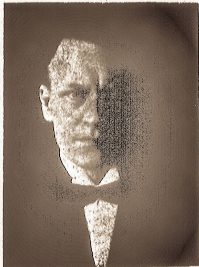
Vladas Požėla, Lietuvos vidaus reikalų ministeris 1926 metais, neseniai miręs Australijoje.

tarp kitko neabejotinai prieštarauja konstitucijai.