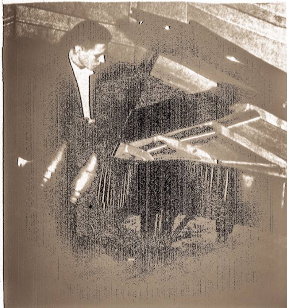
Planistas Antanas Smetona, kuris su orkestru skambins Brahmsio piano koncerto pirmąją dalį. Diriguos Vladas Jakubėnas.