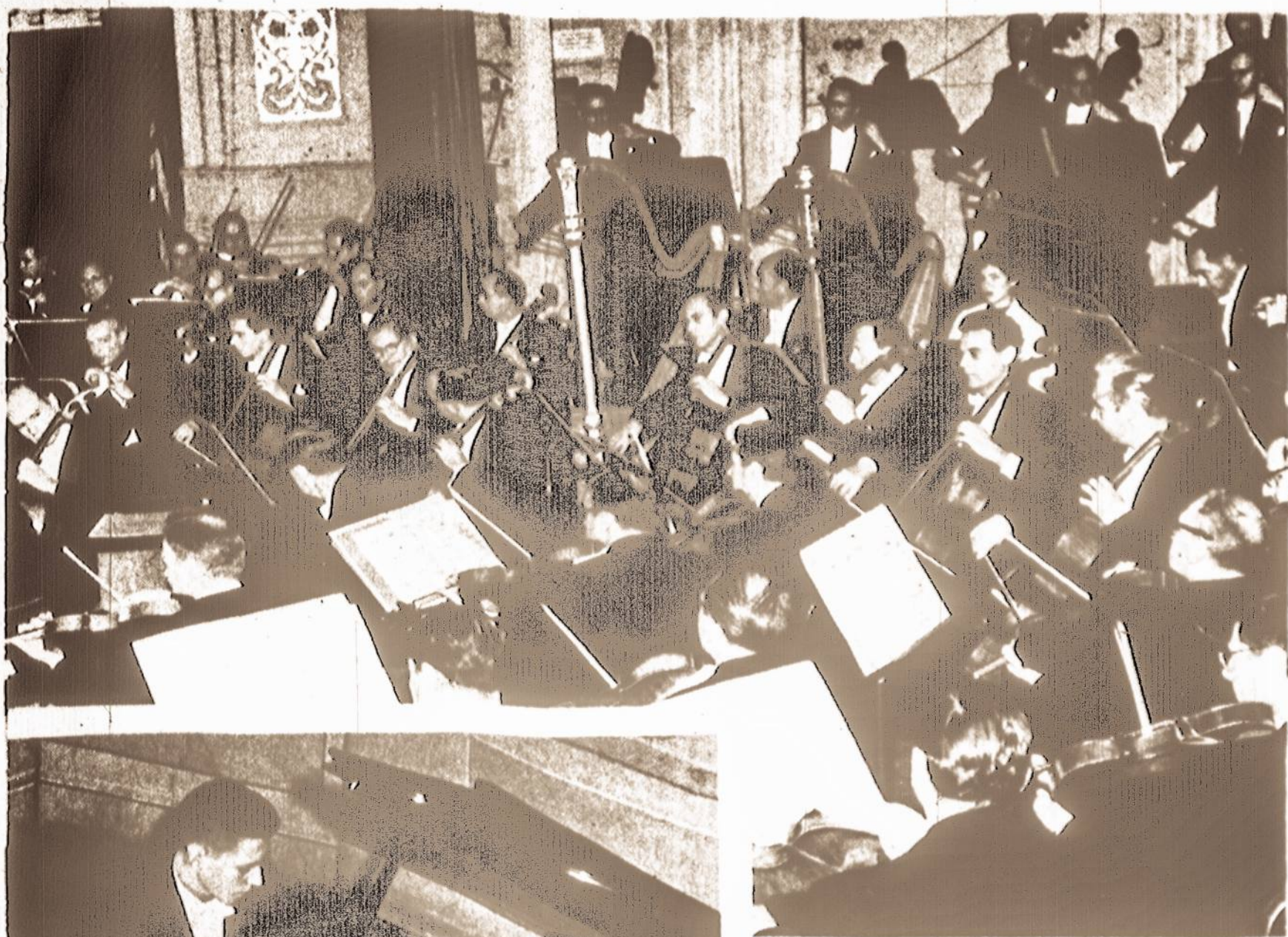
Simfoninis orkestras, kurį daugumoje sudaro pagarsėjusio "Symphony of the Air" nariai.