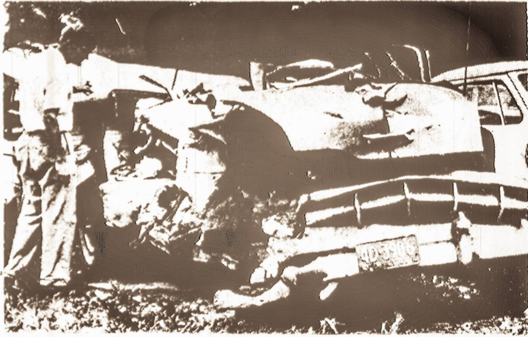
Jurgio Jaks-Tyrio automobilis po nelaimės, įvykusios rugsėjo 11 d. Pensylvanijos vieškelyje, ties Reading, Pa.