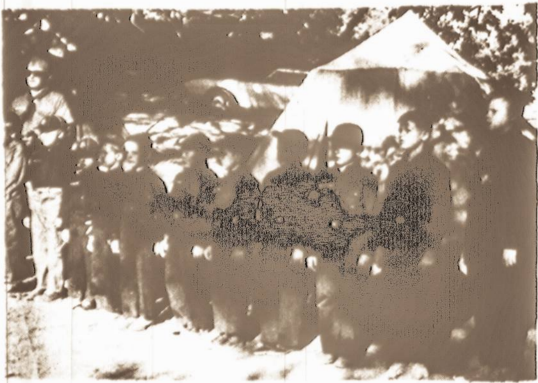
Rugsėjo 3 d. baigėsi Los Angeles, Žalgirio Vietininkijos, Ramiojo Vandenyno Rajono skautų dviejų savaitių stovykla, Lake Shore Arrowhead kalnuose. Nuotraukoje: vilkiukai pasiruošę duoti iškilmingą išodį.