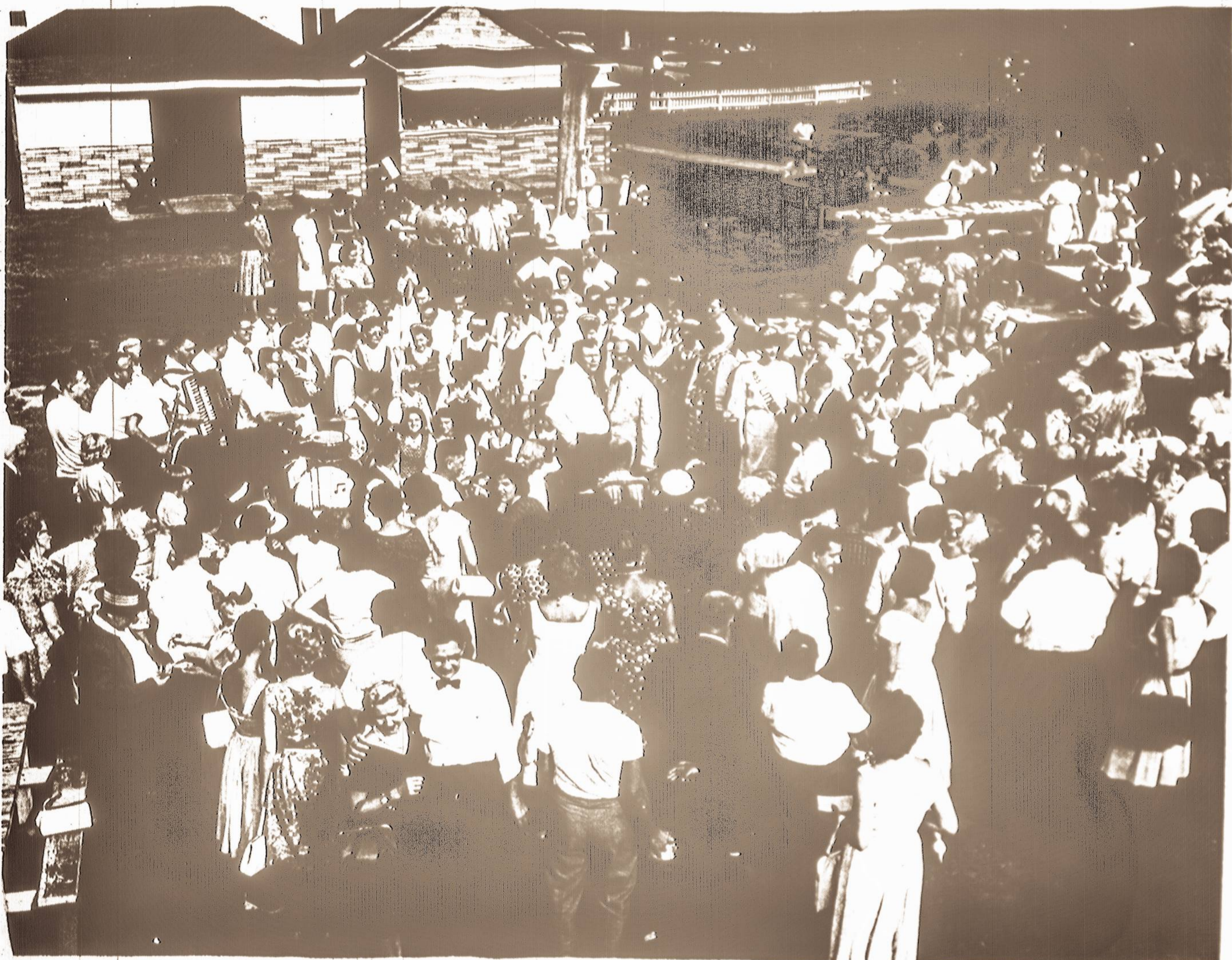
VIRŠUJE: Dalis publikos praeitą sekmadienį Rahway, N. J. įvykusiame Lietuvos Atsiminimų radijo piknike.