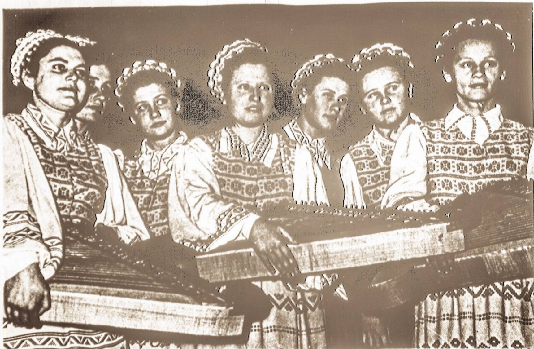
Alytaus rajoninių kultūros namų kanklių ansamblis rengiasi išeiti į sceną.