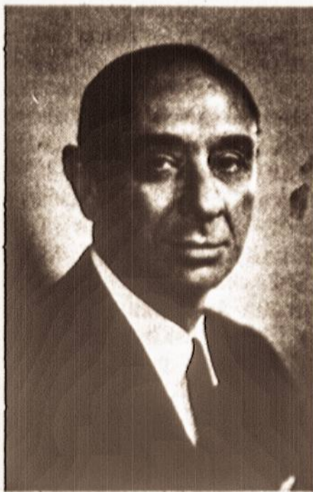
LOUIS J. LEFKOWITZ | merus

Mūsų miesto įstaigose atidengti didžiausi skandalai: Gatvėse pavojinga ne tik moterims bet ir vyrams; nesaugu parkuose ir pajūry; mokyklose randama netvarkos. — TIK GERAS ŠEIMININKAS GALI SU-TVARKYTI NEW YORKĄ — L. J. LEFKOWITZ tinkamiausias New Yorko Mero pareigoms. Kilęs iš neturtingų imigrantų šeimos išėjo teisių mokslus. Turi patyrimo įstatymdavystėje bei teisme eilę metų eidamas vyr. New Yorko valstybės prokuroro pareigas. Yra tinkamiausias sutvarkyti pašlijusius New Yorko reikalus. Jis pasamdys 6,000 naujų policmonių ir pašalins suktybes. Rinkim L. J. Lefkowitz | merus!