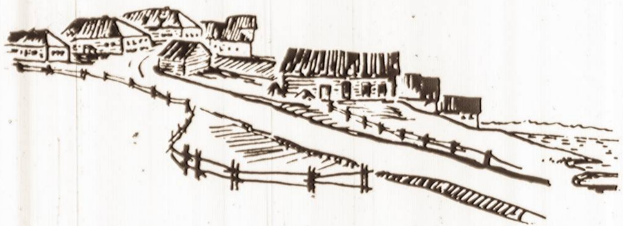
V. KAMINSKO piešiniai