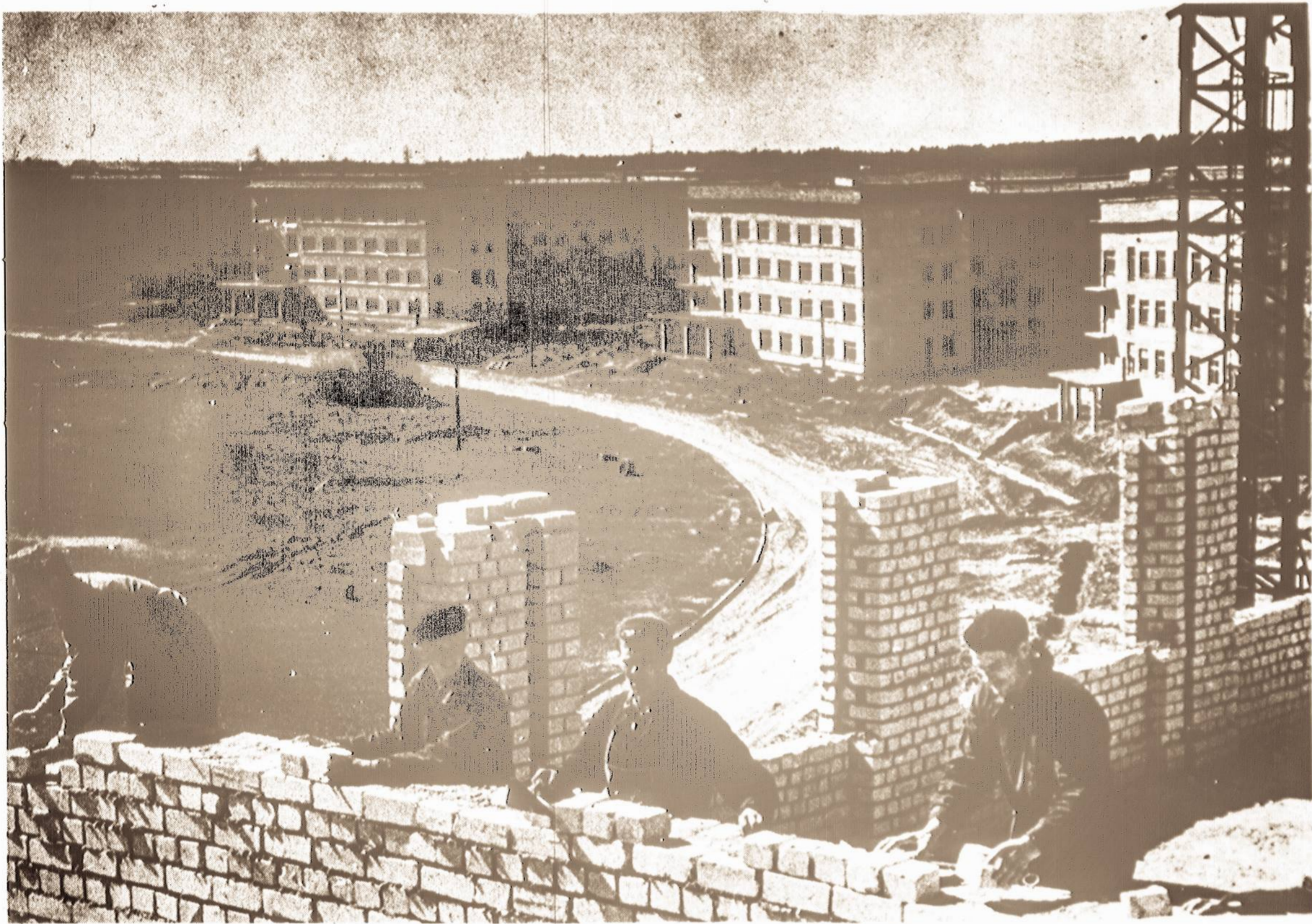
Kauno miesto pakraštyje - Noreikškiečiuose statomas Lietuvos Žemės ūkio akademijos studentų miestelis.