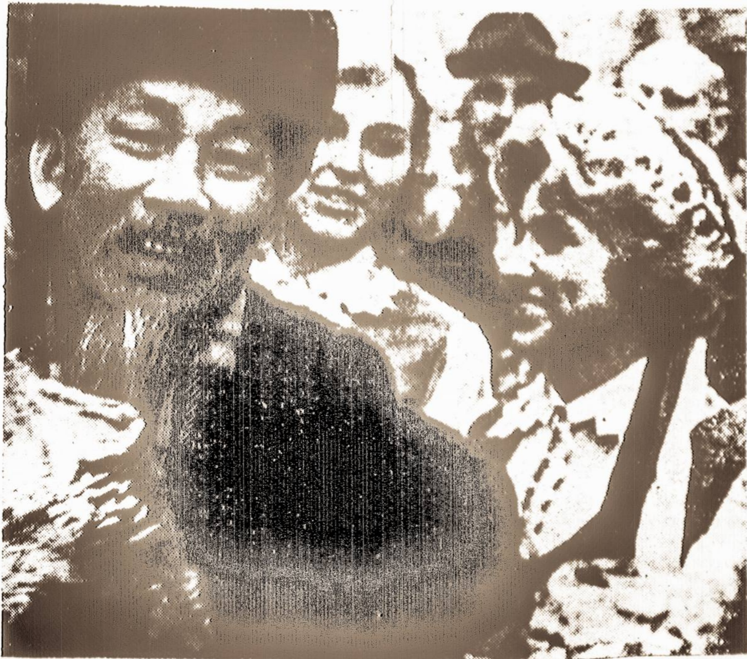
Tautiškai pasirėdžiusios merginos Vilniuje pasitinka svečią iš komunistinio Vietnamo, Prezidentą Ho Ši Min.