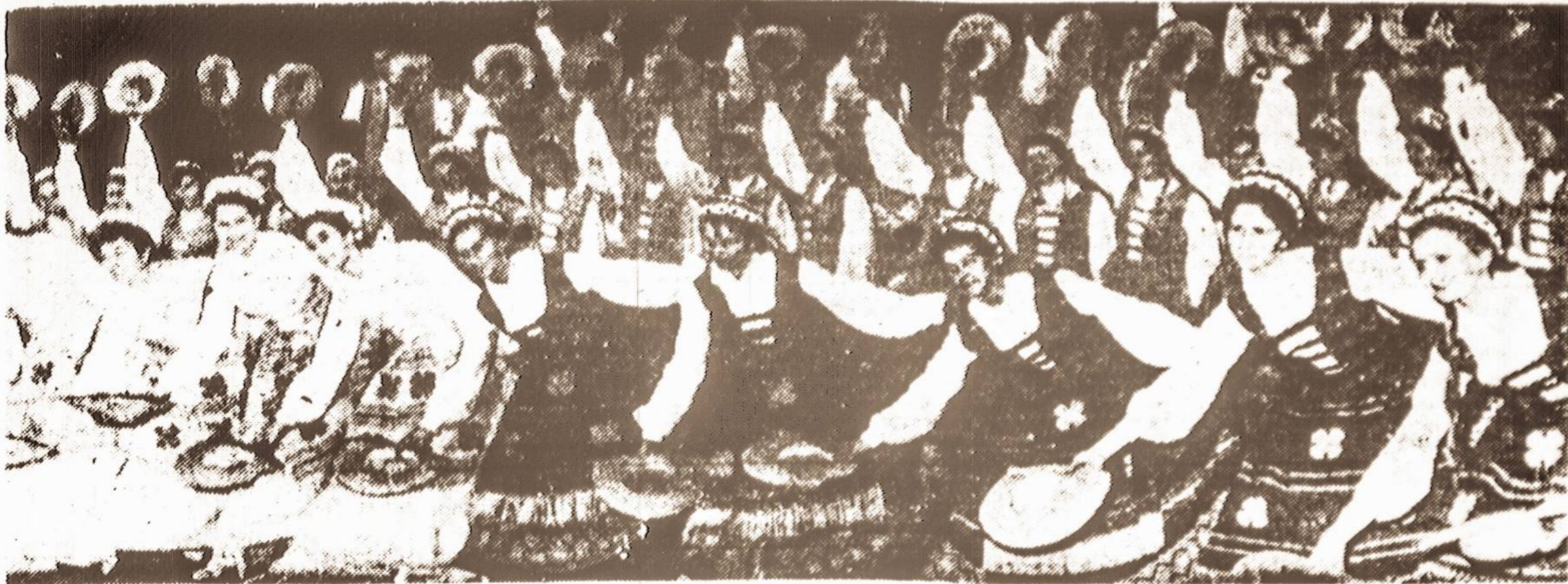
Vilniaus Universiteto dainų ir šokių ansamblis Maskvoje šoka "draugystės šoki".