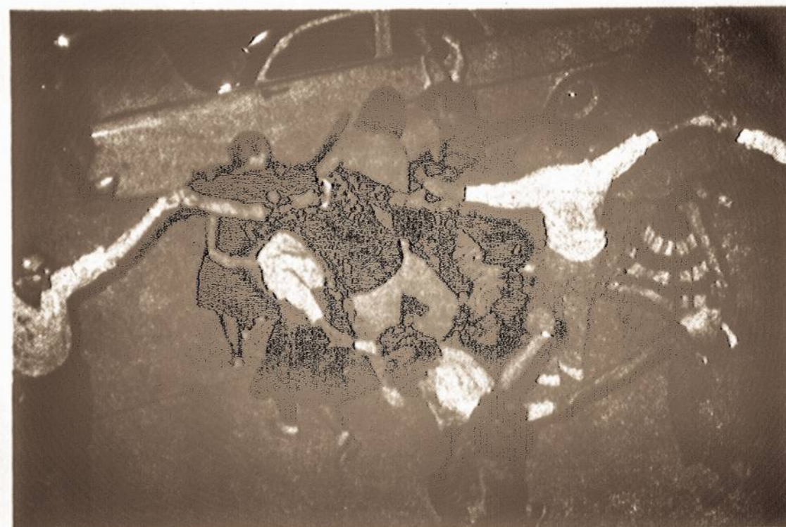
Los Angeles lietuvių Tautinių Šokių grupė „Žilvitis“ nuolat repetuojantis ir ruošiantis naujiems pasirodymams.