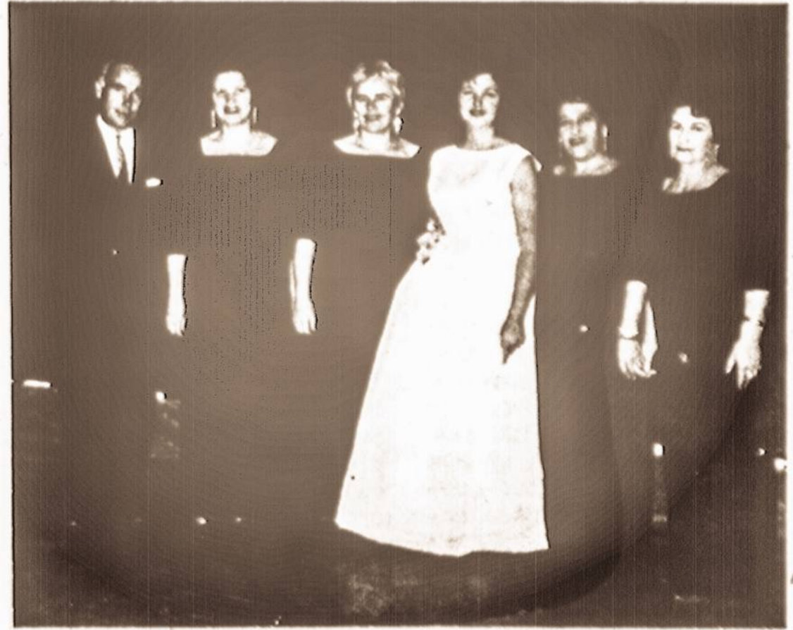
Los Angeles moterų kvartetas dainavęs birutiečių baliuje.