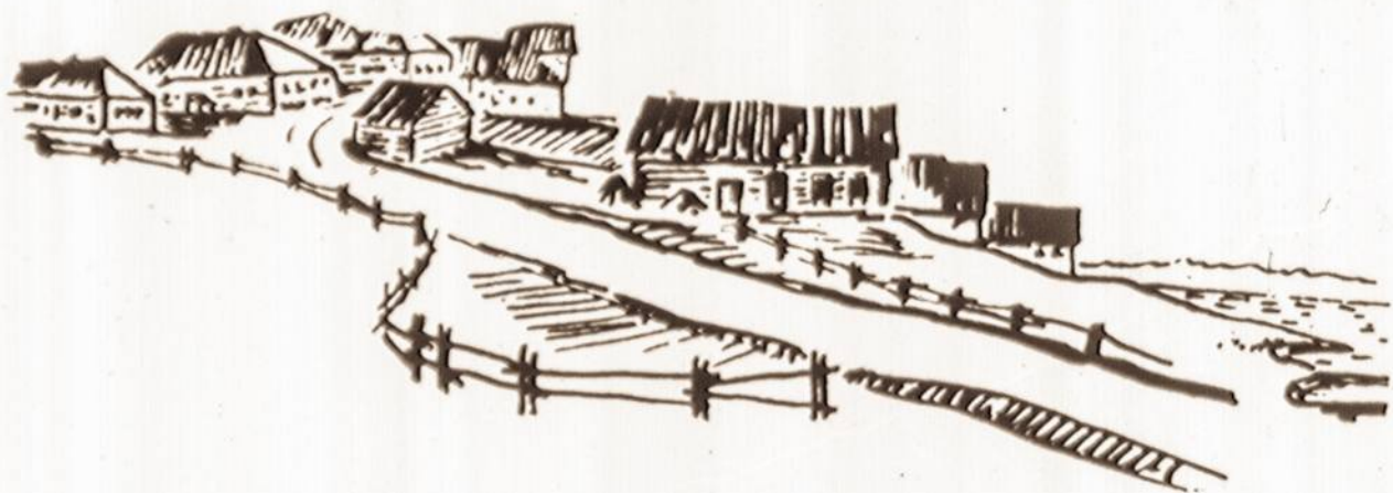
V. KAMINSKO piešiniai