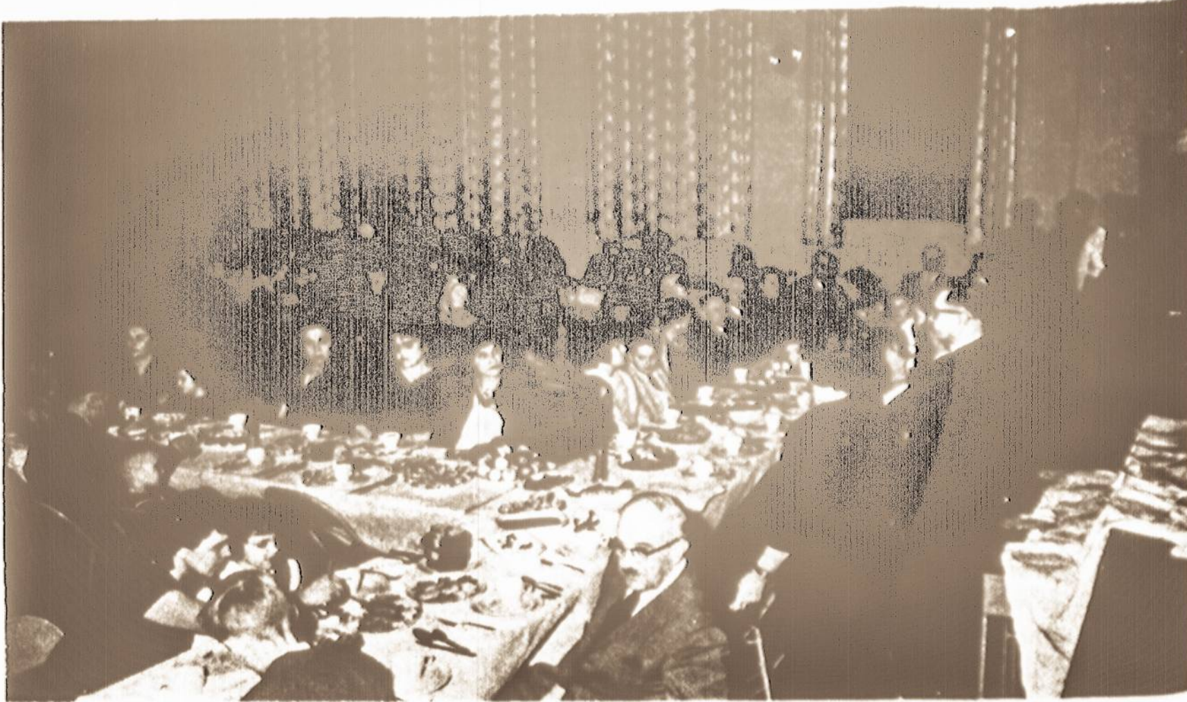
Didžioji Lietuvių šeima prie bendro ALVUDO surengtų Kūčių stalo, Jaunimo Centre, Chicagoje.