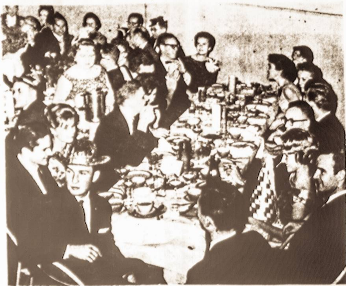
Los Angeles lietuvių studentų kampelis geroje nuotaikoje sutinka Naujuosius 1962 Metus. Lietuvių Bendruomenės surengtame baluje.