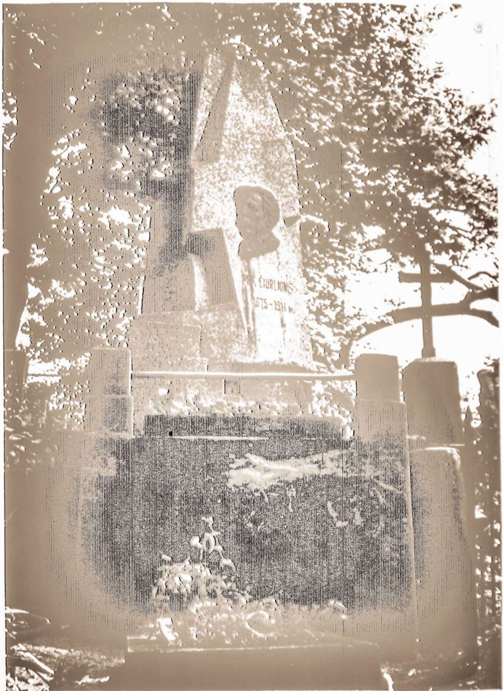
M. K. Čiurlionio kapas ir paminklas Vilniaus Rasų kapinėse. (Dail. Zikaro daryta skulptūra.)

Pereiti metai buvo sukaštuviniai ir ta prasme, kad buvo penkiasdešimt metų nuo M. K. Čiurlionio mirties. Ne vienas lietuvis, prie jo kapo Vilniaus Rasuose susikaupe, prisiminė jo turtingą palikimą. O tasai palikimas yra gausus ir įvairus: apie 130 įvairaus žanro muzikos kūrinių, dailės srityje jo palikimas — apie 300 tapybos ir grafikos darbų. Be to, Čiurlionis yra parašęs rašinių muzikos ir dailės klausimais.