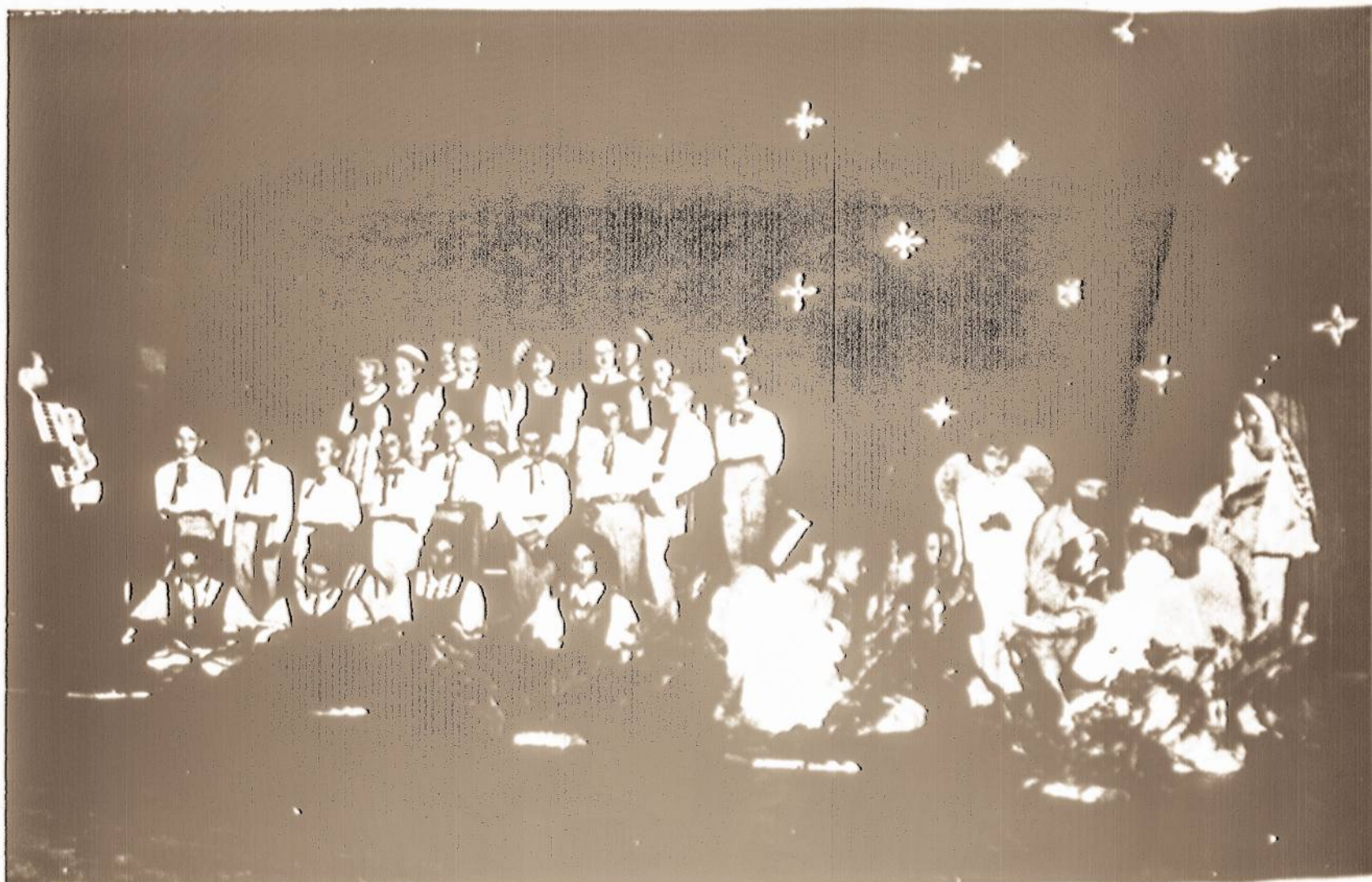
Tėviškėlės ansamblis Chicagoje, atlieka kalėdinių nuotaių montažą "Tylloji naktis" ALVUDO surengtose Kūčiose.