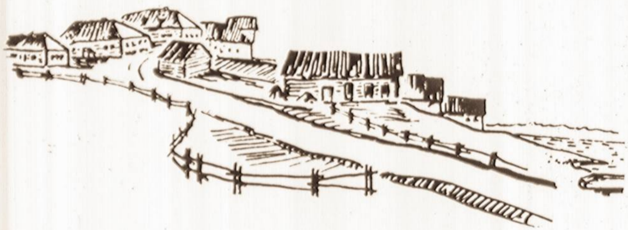
V. KAMINSKO piešiniai