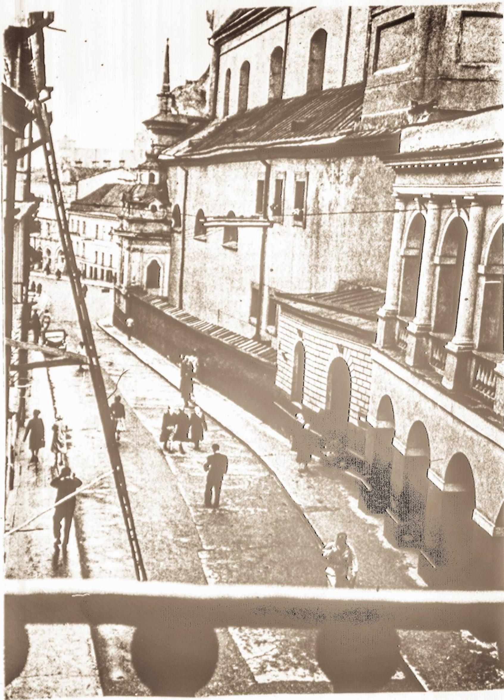
Vaizdas iš Aušros Vartų koplyčios į šv. Teresės bažnyčios pusę (dešinėje). Kairėje vyko namų remontas. Tolygoje priekyje šv. Kazimiero Bažnyčios silueta.