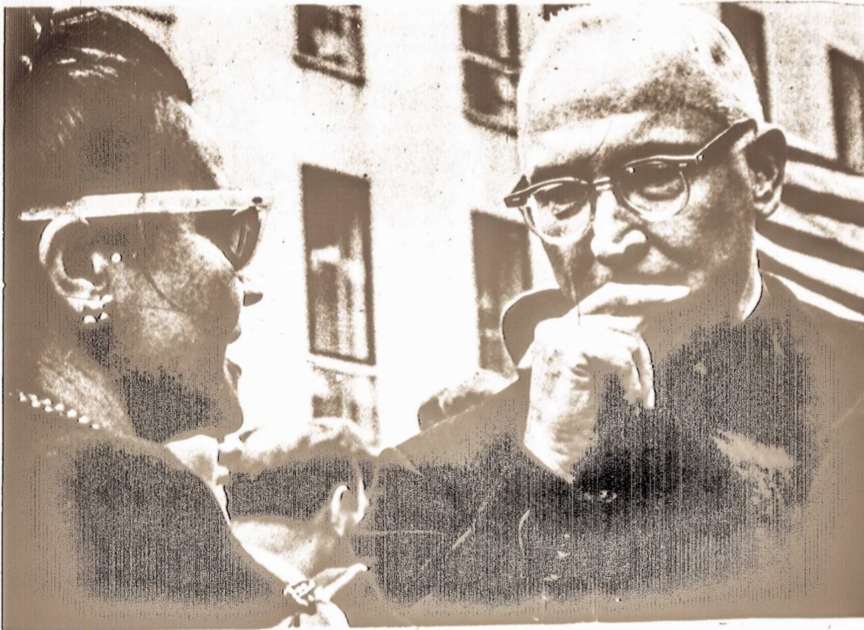
VIENYBE, 1962 m. sausio 12 d.