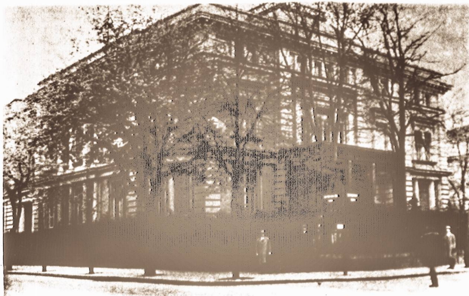
Lietuvos Pasiuntinybės namai Berlyne prieš karą.

greičiausiai Molotovas nebegrįš ir dar bus pašalintas iš partijos už savo "antipartinę" veiklą.