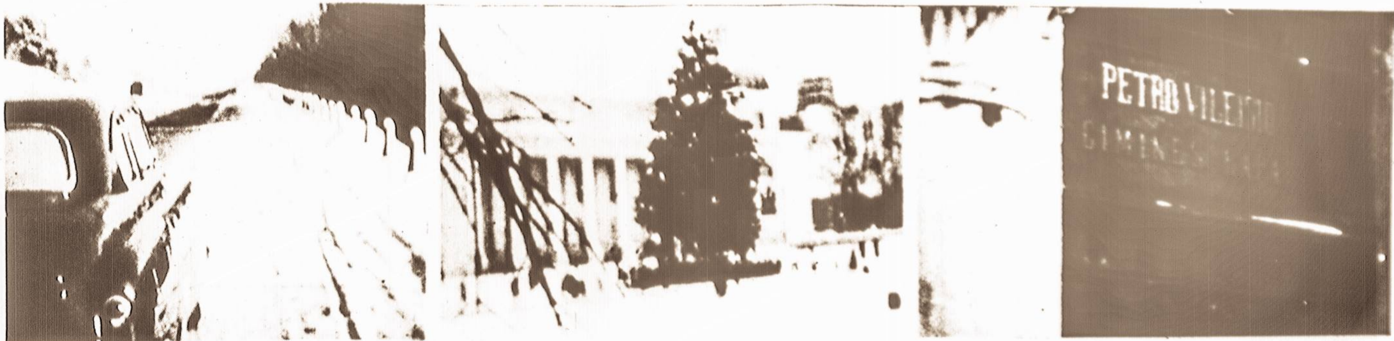
Vaizdai iš filmo "Žiema Lietuvoje": Pakeliui į Vilnių...