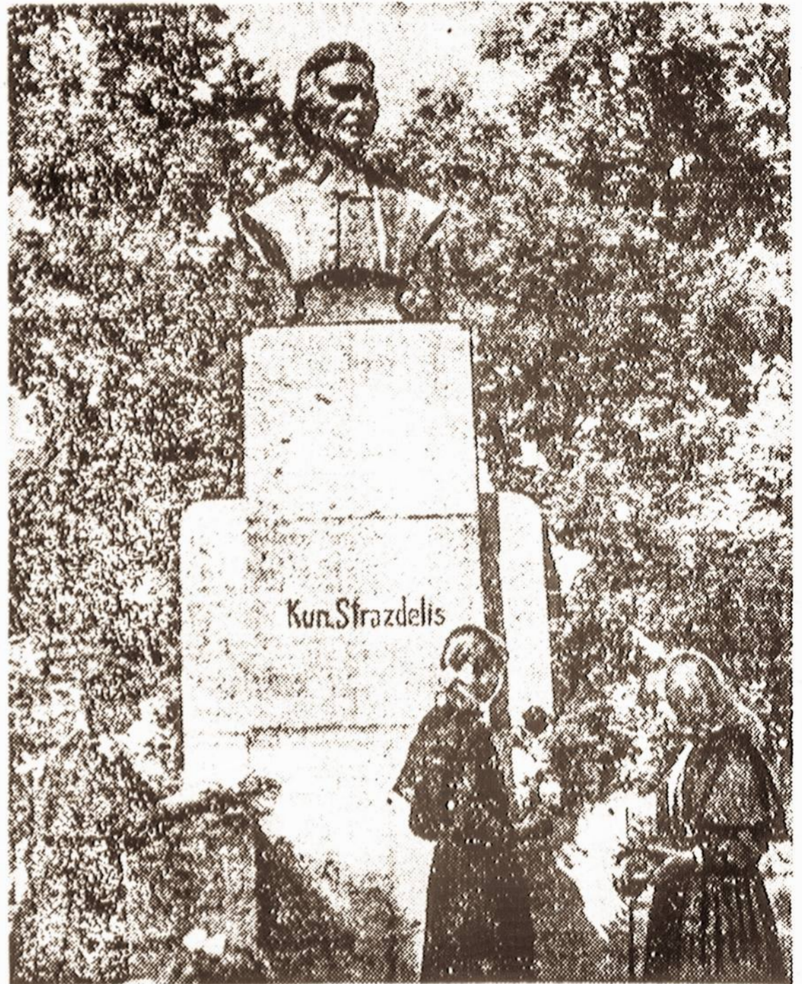
Mokslėivės prie A. Strazdo paminklo Kamajuose.

Važiuojant iš Rokiškio, ten, kur platus vieškelis išneria iš miško, už posūkio atsiveria gražus vaizdas į Kamajus. O pačiame Kama-