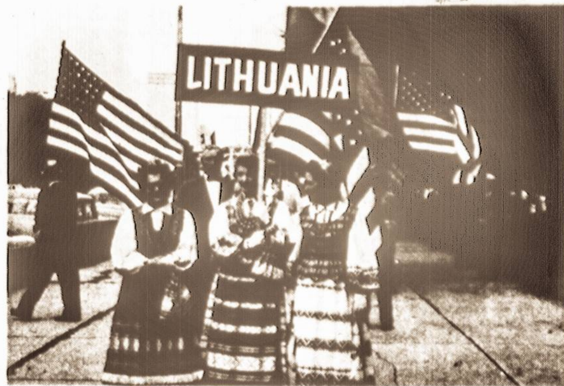
Lietuvių grupės, dalyvavusios Pavergtųjų Tautų Savaitės minėjimo Chicagoje eisenoje, priekinė dalis.