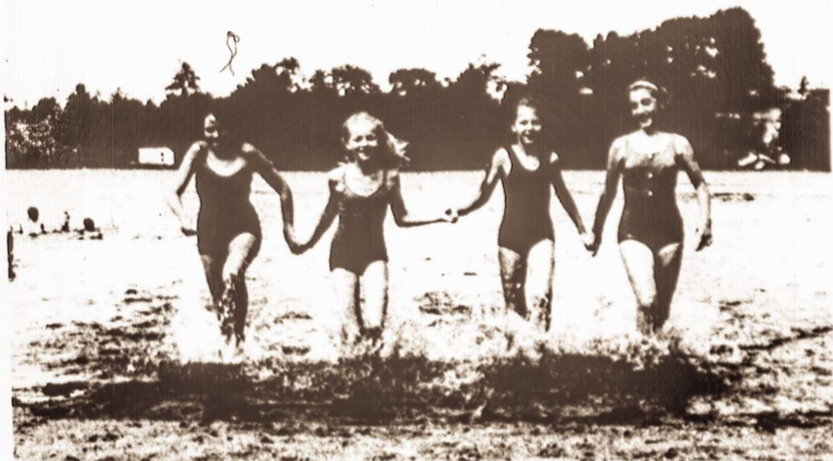
Potamo stovyklautojos prie Vilijos vandenėlių.