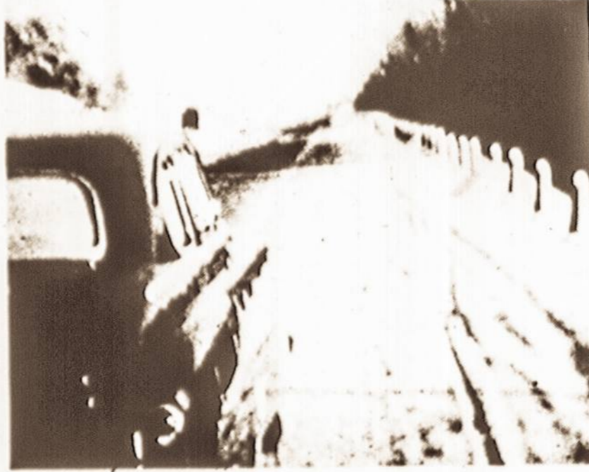
Automobiliu po Vilnių...

Vėliau pavaikštindėjome ir prie Vilniaus Universiteto. Didžiuluma studentų čia dabar lietuvių, o kai mes Vilniuje gyvenome, tai lietuvių studentų, baigusių Vyt. Didž. Gimnaziją, visai nepriimdavo.