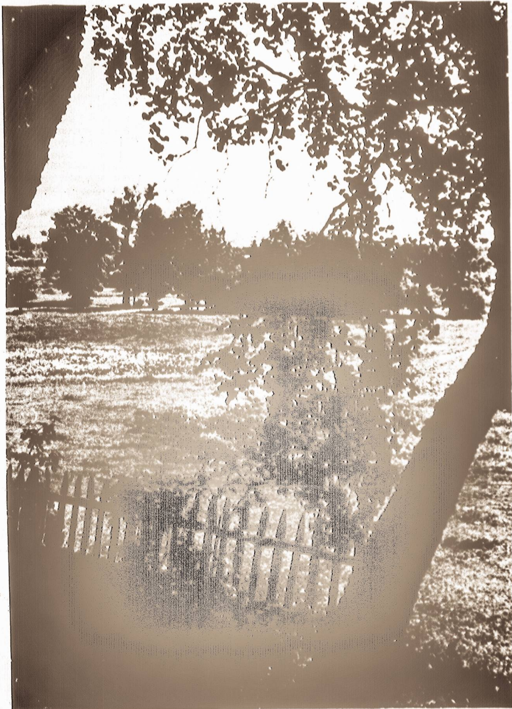
Vasara eina Lietuvos žeme - vaizdelis iš Dzukijos.