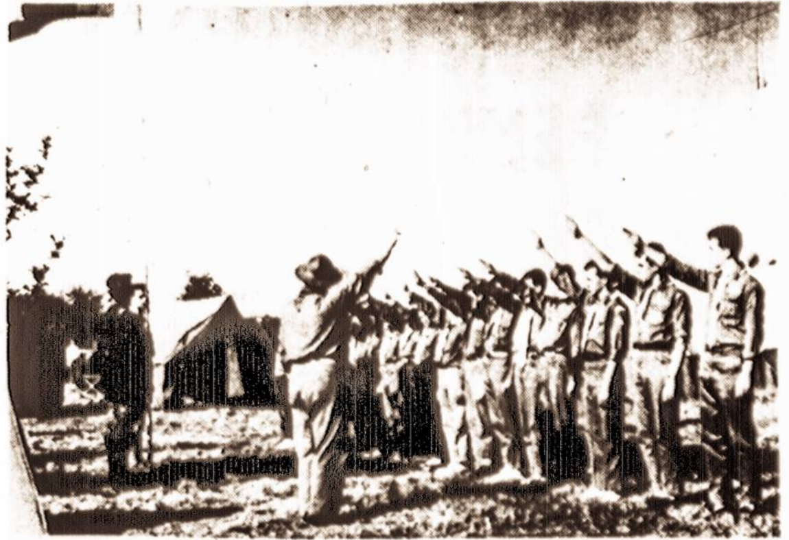
"Vytautėnai" kelia savo trispalvę amerikiečių stovykloje, kuri buvo prie Solon miestelio, Ohio valstybėje.

Idomiu sutapimu Naujienose Elta skelbia Vilniaus Lazutkų ir Guškevičių bai-