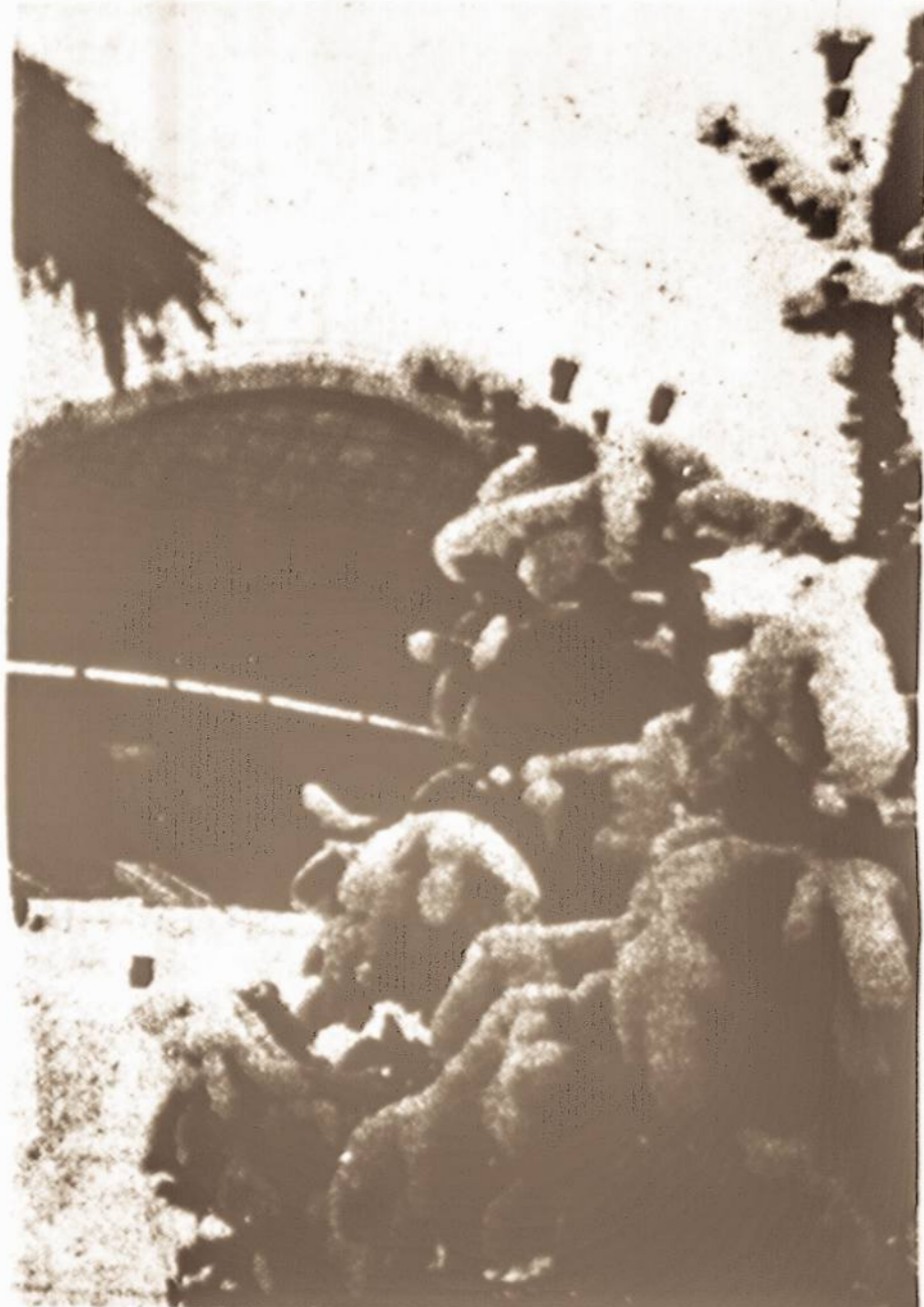
... neapsakomo grožio vaizdas.

Aplankiau Vingio parką ir tą garsiąją estradą, kur vyksta dainų šventės ir kt. vasaros koncertai.