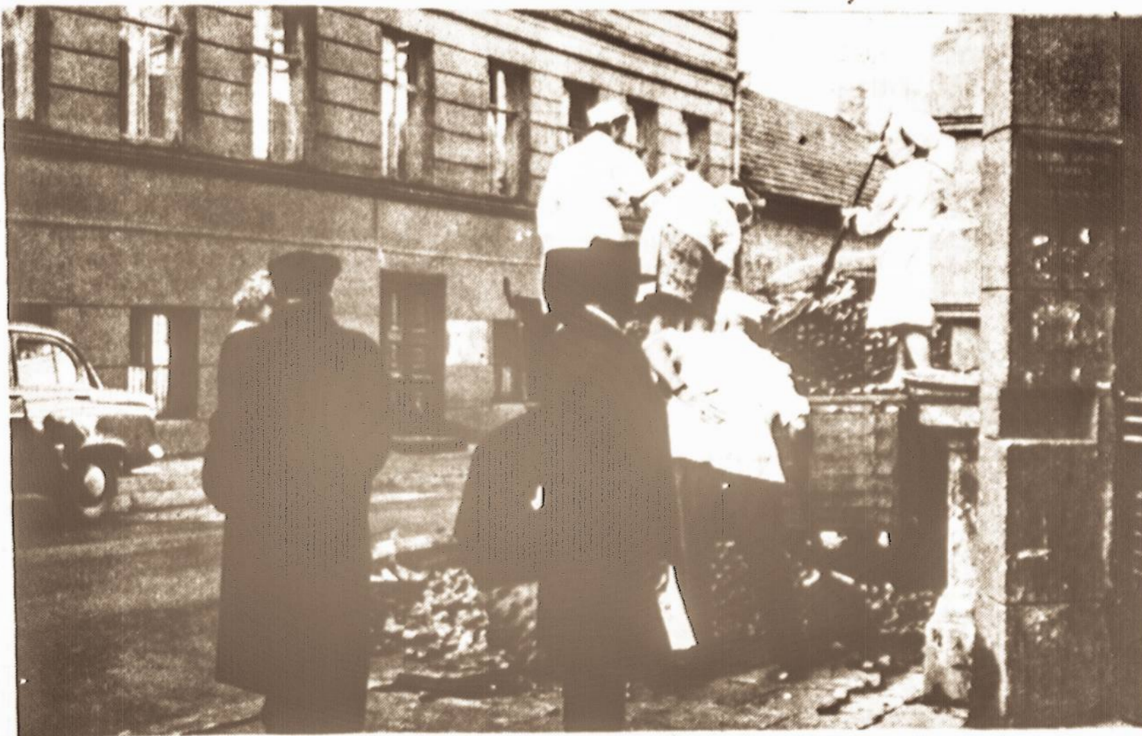
Rudenį eina Vilniuje - visi užsiėmę: vieni dirba, kiti žiūri, kaip užkandinės - automato tarnautojai priima bulves. Vilniuje bulvių kilogramas kaštuoja 16 kapeikų, o Donbase - 5 rb.

Vokietijos Adenaueris išėjo prieš pardavimą kviečių rusams. Girdi, sustiprinsime priešą. Tačiau, statistika rodo, kad vokiečiai stovi pirmoje vietoje pagal eksporto dydį komunistų bokui — 760 mil. dol. vertės 1962 metais. Antroje vietoje Anglija su 383 mil. Amerika paskutinė, tepardavusi komunistams už $125 mil. dol.