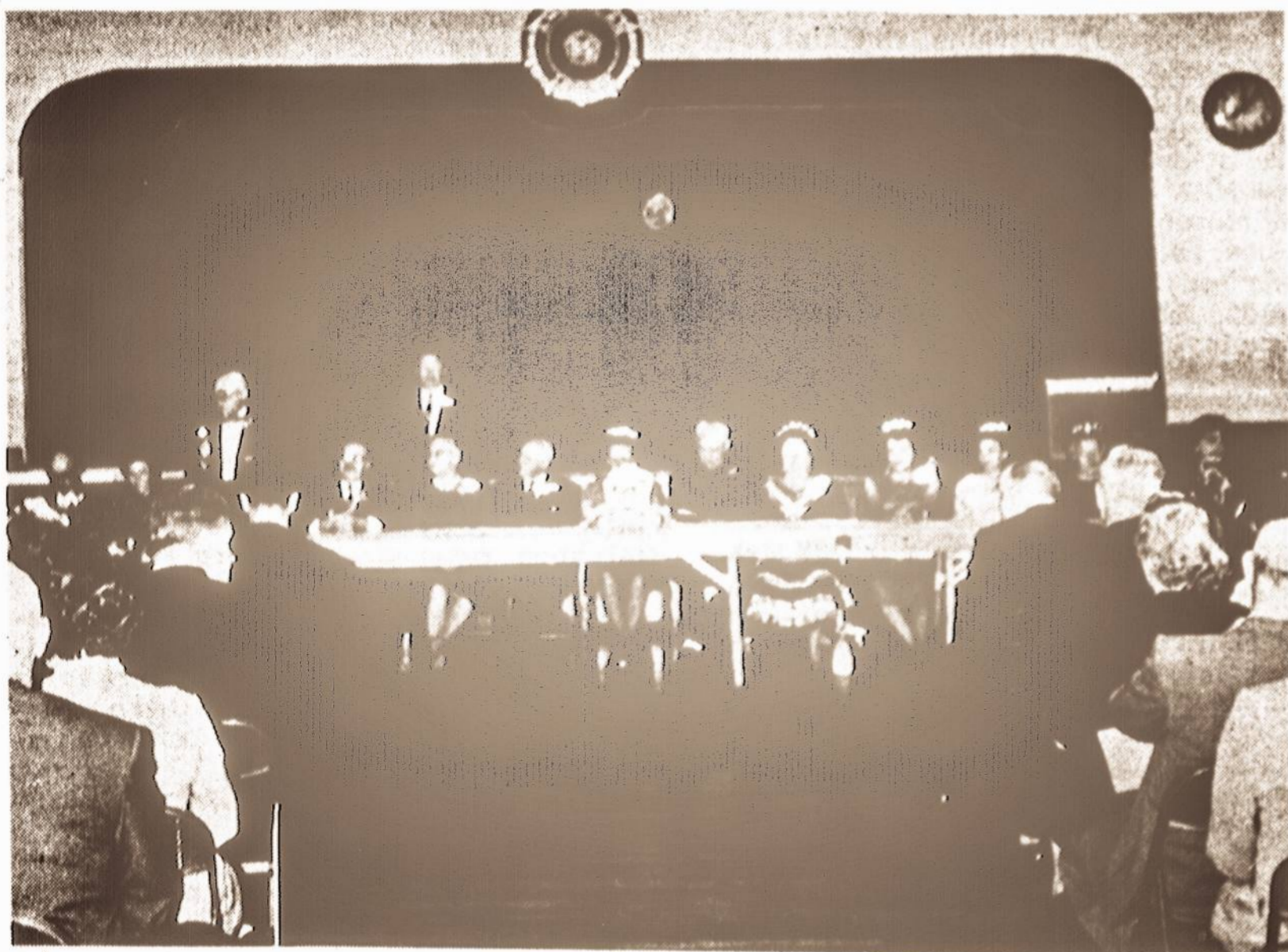
Lietuvių Suvalkiečių Draugijos 25 m. jubiliejus spalio 27 d. Chicagoje, garbės prezidiumas. Jubiliejuje dalyvavo 400 svečių.