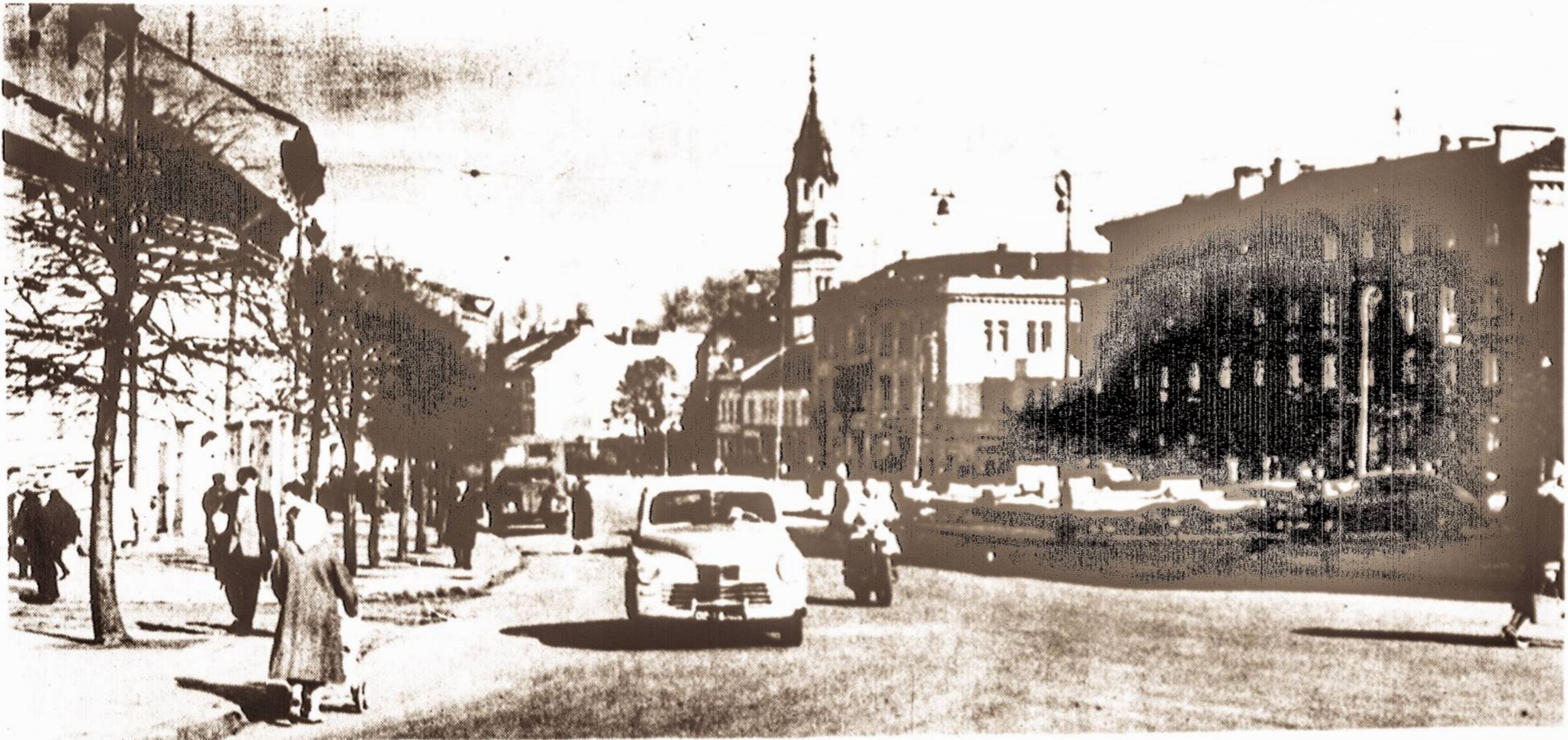
Vilniuje šį rudenį.