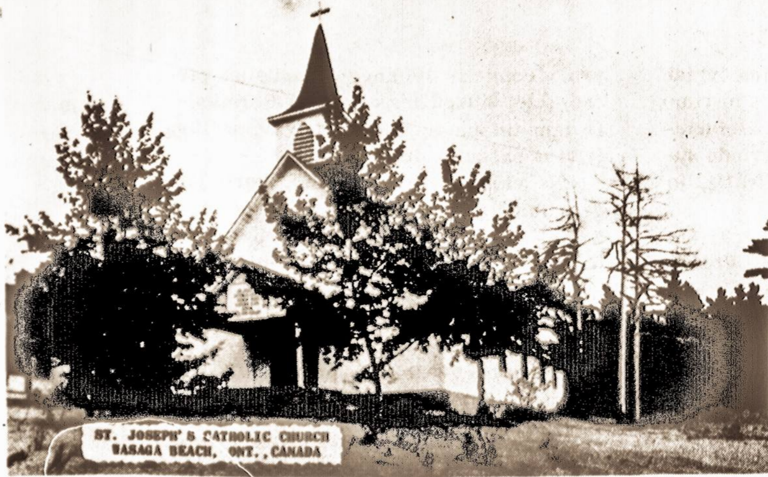
NIEKUR BE DIEVOI - Toronto lietuvių mėgiamas vasarvietės Vasagos paplūdimio koplytėlė. Vasagos paplūdimys yra prie Jurgio įlankos Hurono ežere, 90 mylių į šiaurę nuo Toronto.

Yra prie Jurgio įlankos Hurono ežere toks kurortas Vasagos Paplūdimys. Tarp tautiniai jis galėtų būti garsus tuo, kad čia teka turbūt trumpiausia upė pasaulį, vos 100 jardų ilgio Notavasaga. Bet lietuviams jis svarbus tuo, kad čia vasaros metu, ypač savaitgaliais sutiksi visus tuos, kurių Toronte tuo metu nėra. Ankščiau tie smėlio ir vandens mėgėjai susimesdavo aplink šiek tiek arčiau Toronto esantį Šimkos ežerą, bet pastaruoju metu spiečiasi Vasagoje. Mat, Šimkos ežeras didžiulis ir tautiečiai jo krantėse pasimesdavo kaip