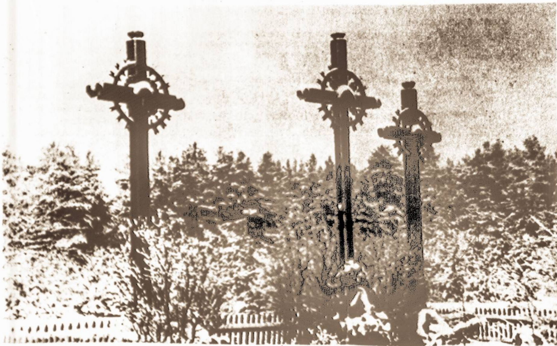
Įždavinienes žemėje pastatyti trys kryžiai. Šioje vietoje vokiečiai sudegino 118 Pirčupio kaimo vyrų, moterų ir vaikų.