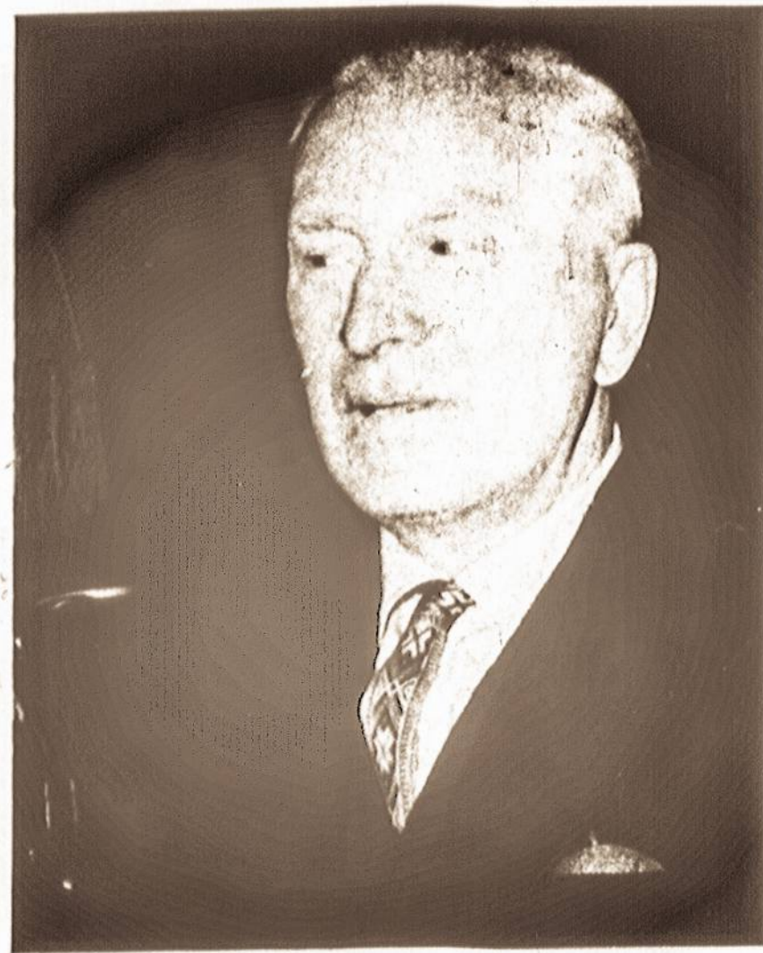
Buv. Lietuvos Užsienų ministras Juozas Urbšys "Lietuvos" viešbutyje.