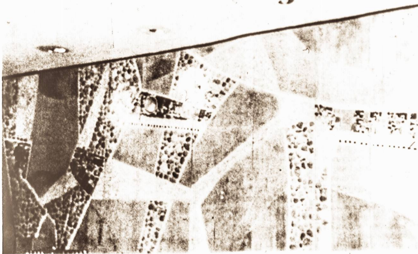
Pilkšvas spalvos muralis, dail. A. Kašubienės sukurtas Hilton viesbutyje.