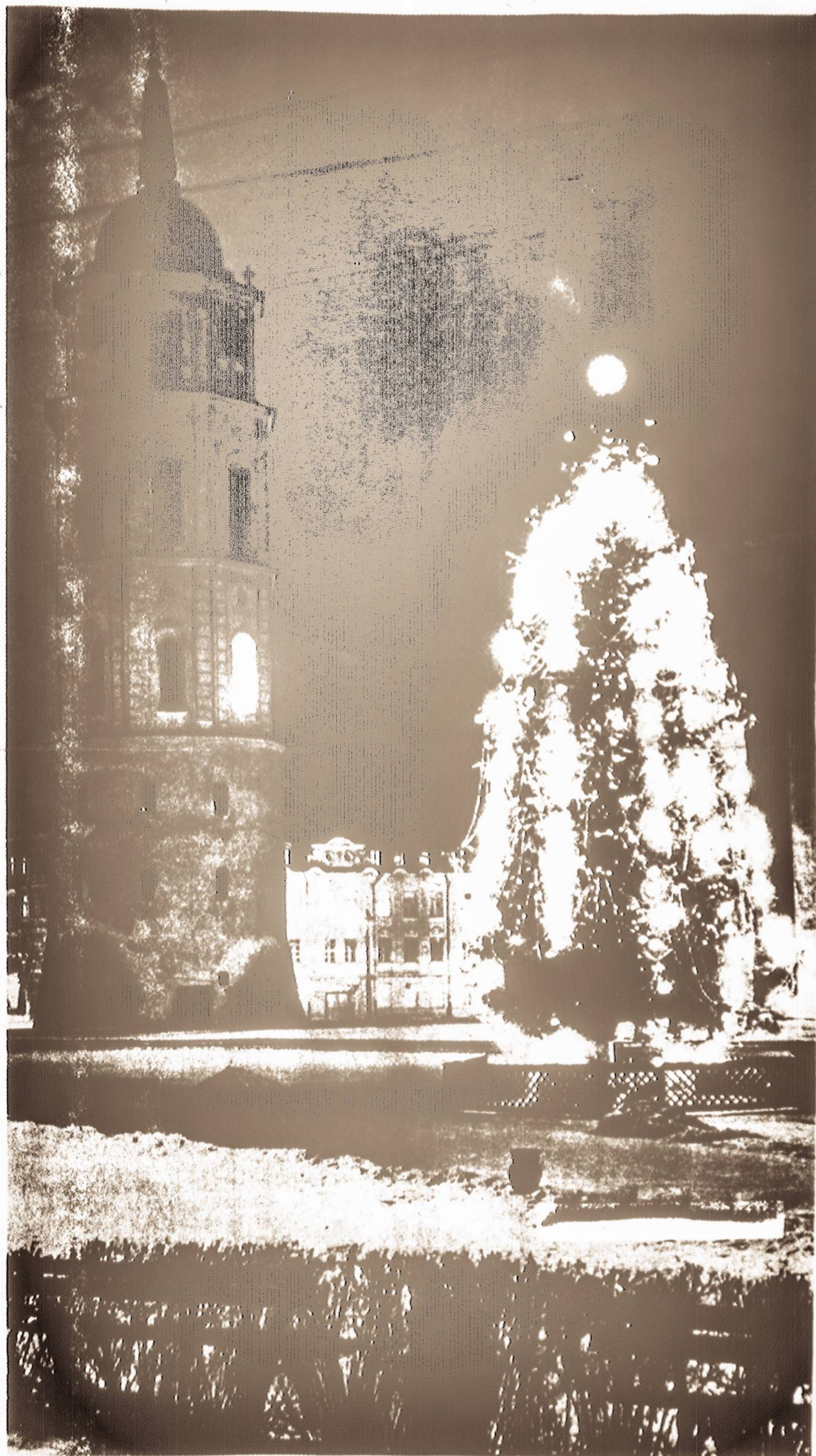
EGLAITĖ PRIE SENOSIOS VARPINĖS VILNIUJE

DŽIAUGSMINGŲ KALEDŲ IR LAIMINGŲ NAUJŲJŲ 1964 METŲ