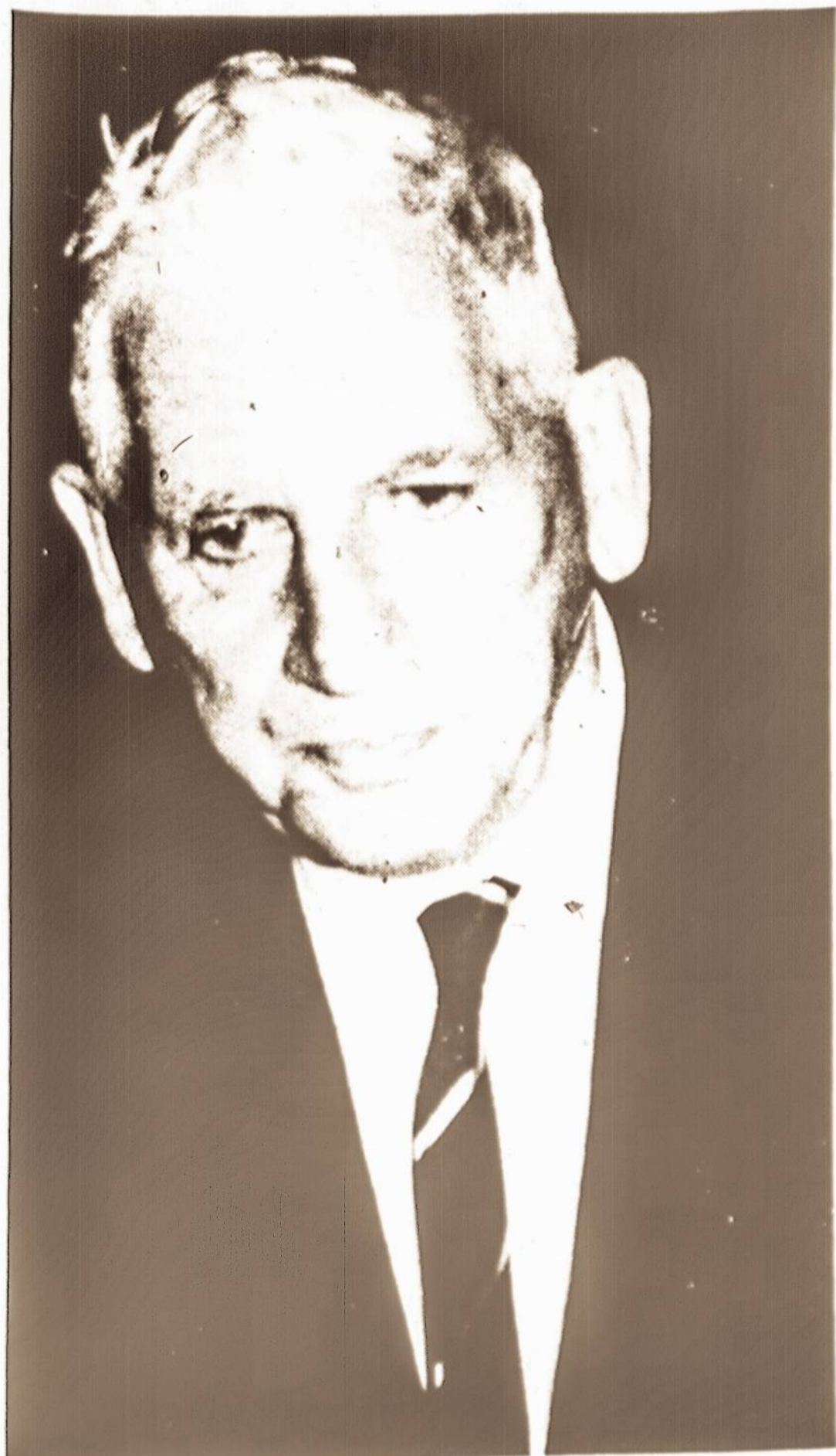
JO ŠIRDIS SU LIETUVIAIS. Nuolatinis didesnių lietuviškų parengimų lankytojas senatorius P. Douglas, demokratas iš Illinois, išpranašavo rusų imperijos žlugimą per Vasario 16 minėjimą Chicagoje. Minėjimas vyko Marijos aukštesniosios mokyklos salėje.