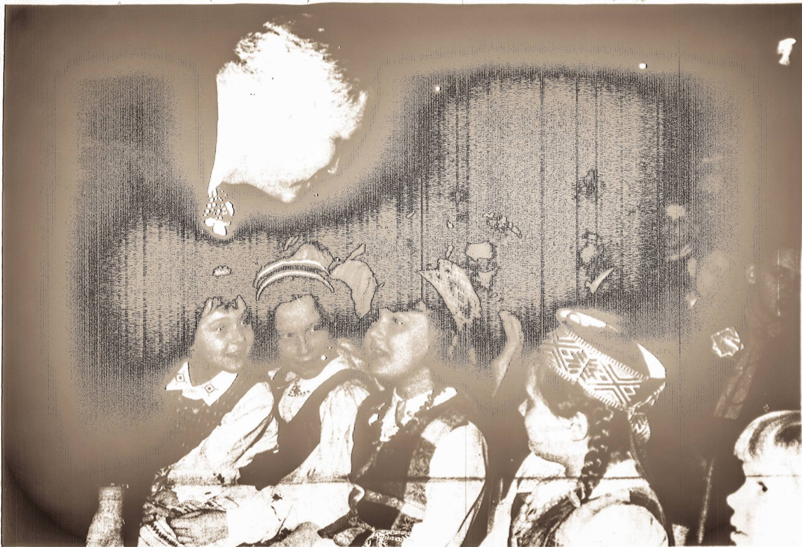
Mennen Williams, Amerikos Valstybės Departamento sekretoriaus padėjėjas, Lietuvos nepriklausomybės minėjime su jaunaisiais lietuviais Webster Hall, New Yorke Vasario 16 d.