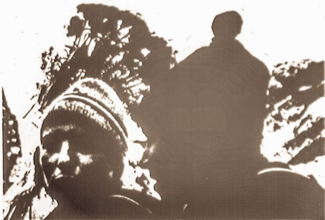
Christine ir Marielle Goitschel (Prancūzija), sugriebusios 4 medalius (iš jų 2 aukso) olimpinuose žaidimuose.