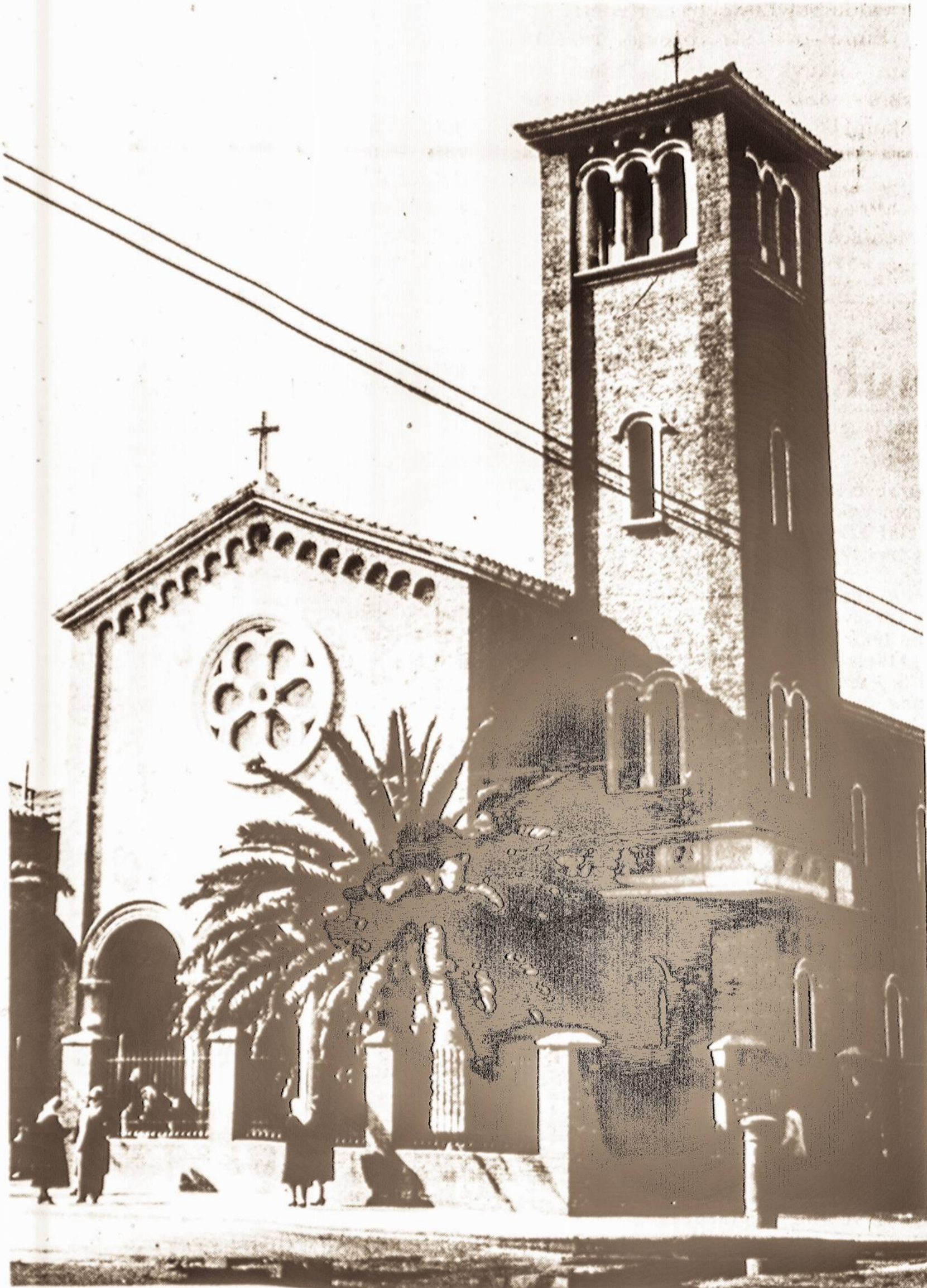
Buenos Aires Aušros Vartų parapijos bažnyčia Avellanedos priemiestyje.