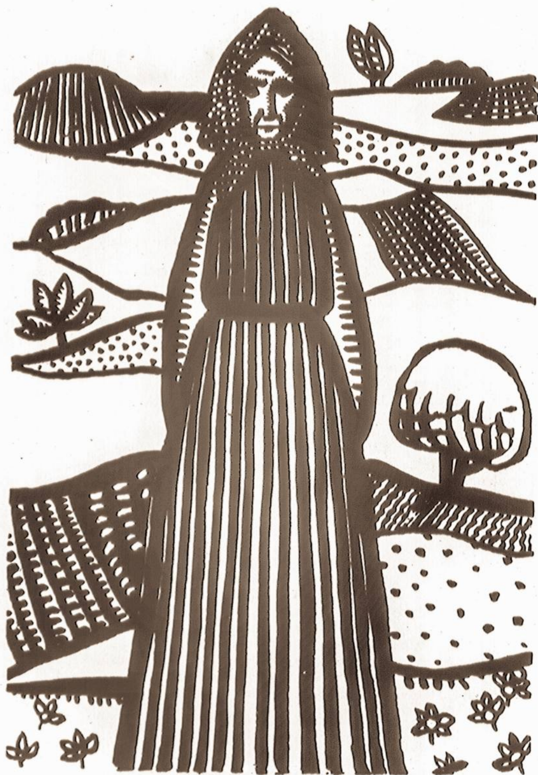
Dail. G. Rameikaitės piešinys Tarybų Moteris žurnale.

Redaktorė aiškino, kad žurnalas spausdinamas gillaspaude centrinėje spaustuviėje Vilniuje. Ji pakvietė į kambarį savo redakcinį kolektyvą. Suėjo šešios jaunos, simpatiškos moterys, visos žurnalistės ir rašytojos. Trūko dar vienos to kolektyvo narių, kuri tą dieną tarnybon neatėjo nes buvo susirgusi. Mėnesiniui žurnalui, kurio puslapių skaičius nedaugiau 20-24, tai didelis redakcijos perso-