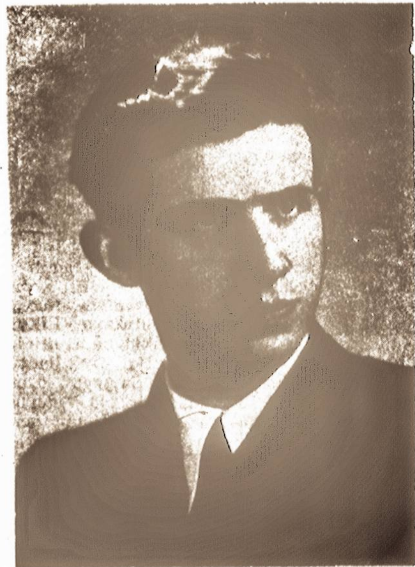
Kompozitorius Vytautas Klova