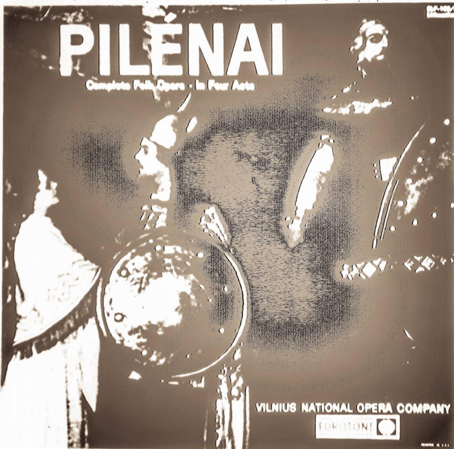
Taip atrodo operos "Pilėnų" plokštelių albumas, gaunamas Vienybėje. Kaina - 12 dol.; persiuntimui pridama 50 c.

Kyla klausimas, kaip atsitiko, kad okupantai leido