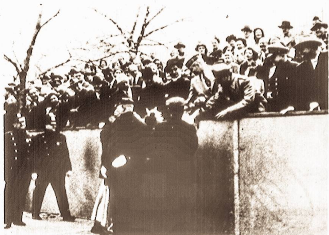
Kaip New Yorko lietuvaitė iteikė gėles gen. MacArthurui... vaizdas iš 1951 m. lojalumo parado. Dešinėje - gen. MacArthur pasilenkęs priima gėles. Susidomėję sužiūro ir visi garbės svečiai kartu su Generolo žmona (stovi už jo), kuriai Generolas paskui tas gėles perdavė.