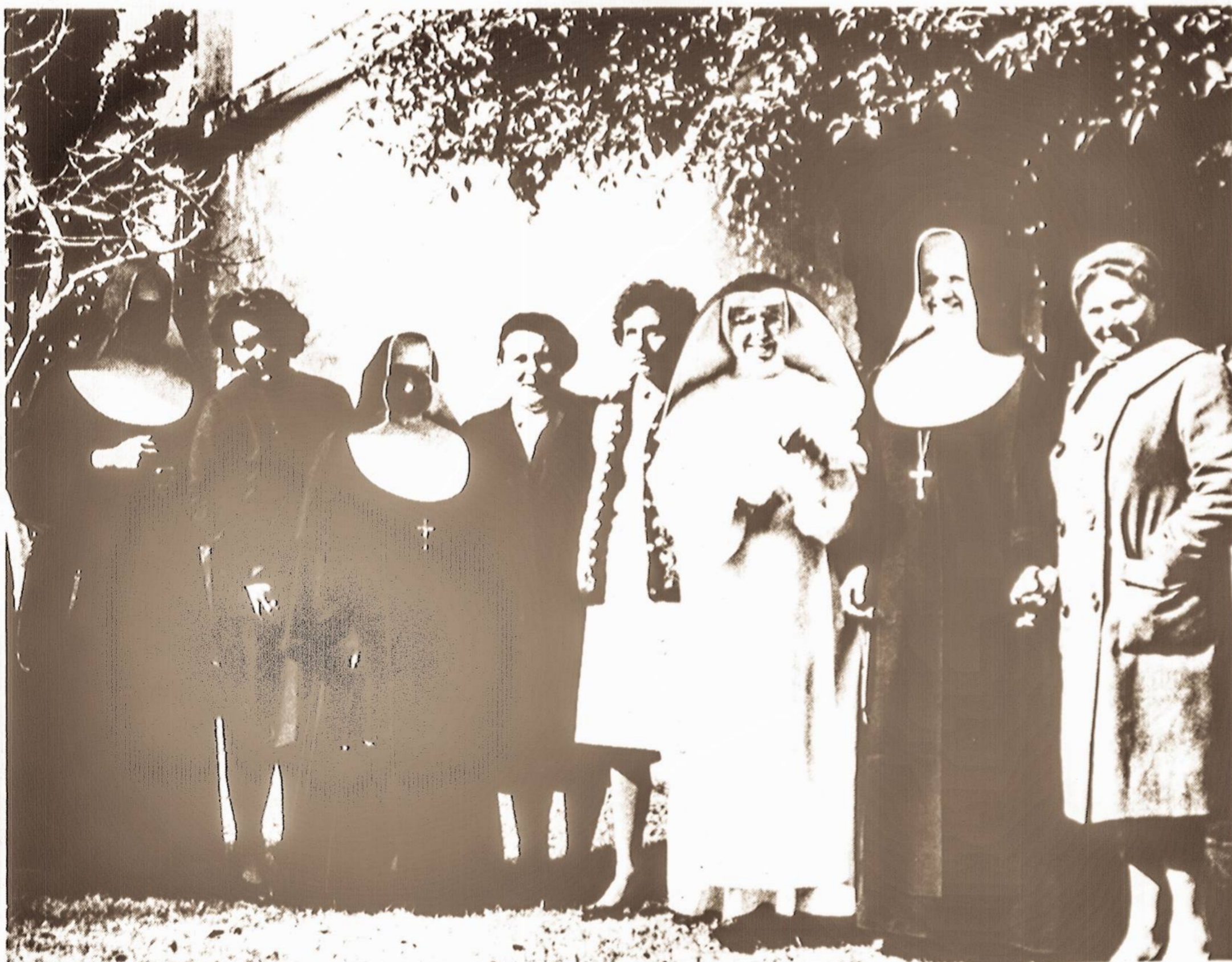
Buvo maloni proga susitikti ir su seserimis Kazimierietėmis, kurios vadovauja pradžios mokyklai ir darbuojasi su jaunimu.