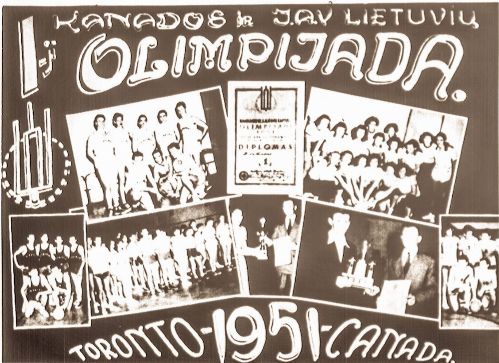
IŠ SPORTINIO ALBUMO - Vaizdai iš lietuvių sporto varžybų 1951 metais Toronto mieste.

Šį kartą dedame E. Gumbelvičiaus paruoštą pirmąjį Š. Amerikos liet. sporto žaidynių (tada vadinta -- Kanados ir JAV lietuvių olimpiada), įvykusių 1951 m. Toronte vaizdų atvirutę. Ji mums yra prisimintina tuo, jog šiemet balandžio 4-5 d. d. Toronte buvo prarastos jau XIV-tos Š. Amerikos liet. sporto žaidynės (tiksliau pasakius -- žaidynių krepšinio varžybos). Šių metų žaidynėse, be abejo, buvo jau nauji veidai, tačiau smagu, jog prieš 14 metų Toronte pradėta lietuvių sportininkų bendravimo tradicija liko neapleista iki šios dienos.