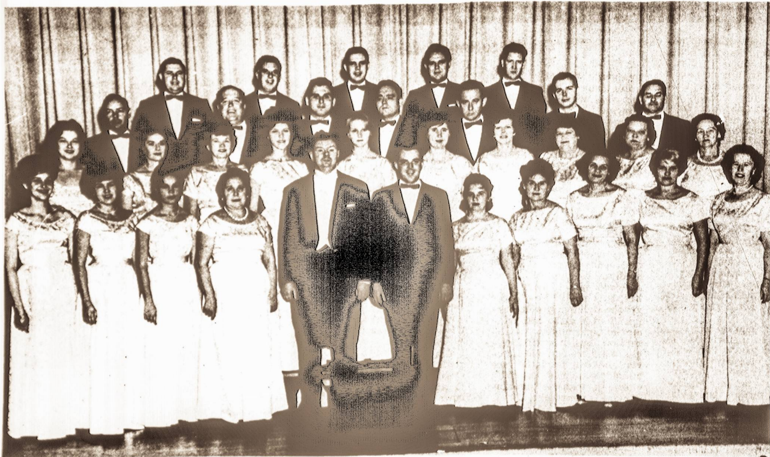
RŪTOS ANSAMBLIS, kuris gegužės 2 d. rengia įdomų pavasario balių, Sopulingos Dievo Motinos parapijos salėje, Bergen ir Davis Avenue, Kearny, N. J. Pradžią 8 val. vak. Sokiams gros puikis orkestras. Svečiai, be atskiro mokesčio, bus vaišinami skaniais valgiais. Įėjimas vienam asmeniui - $3.50, perkant bilietus iš anksto - $3.00.