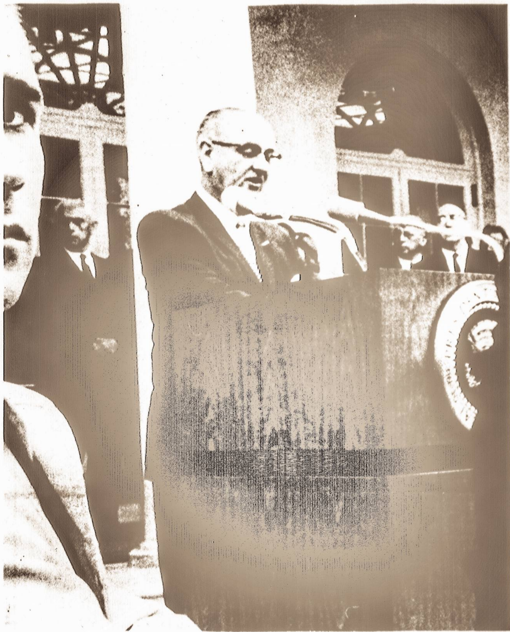
JAV Prezidentas Lyndon B. Johnson sako kalbą spaudos atstovams, atvykusiems iš Baltuosios Rūnos, Washingtone. Aiškiai jaučiama, kad JAV Prezidento saugumas sustiprintas.