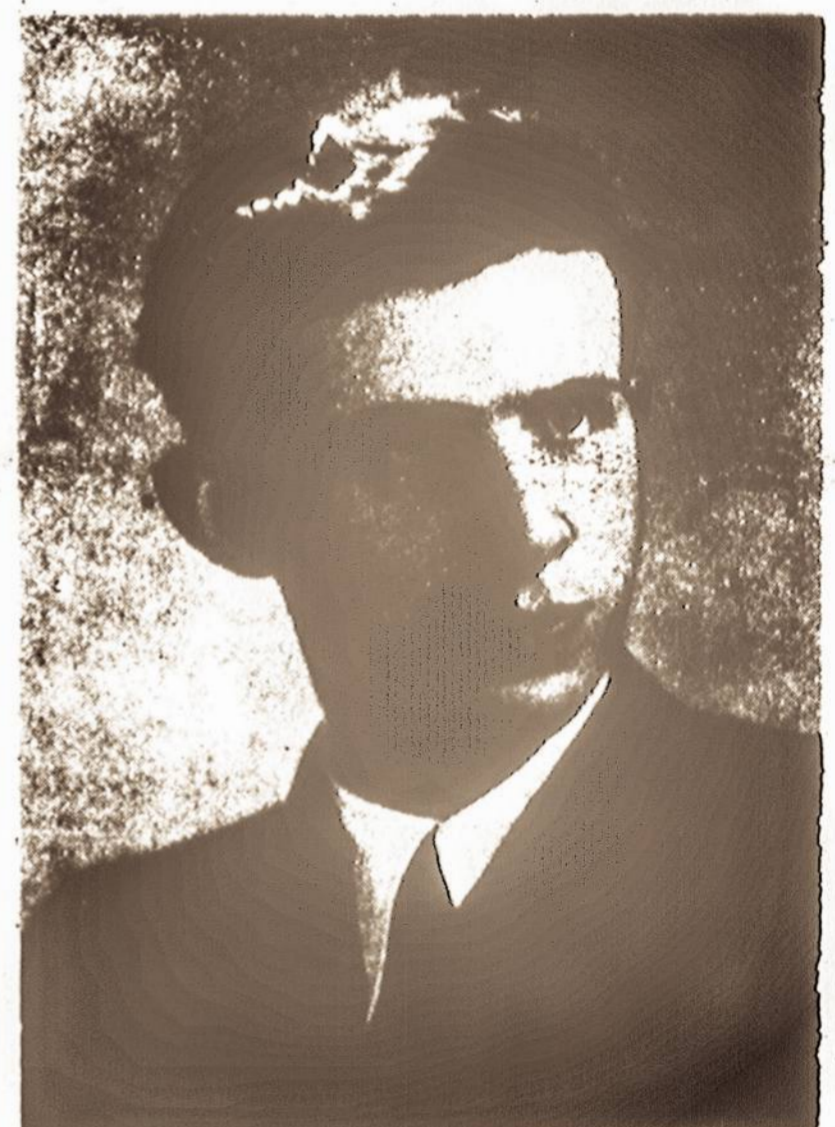
Kompozitorius Vytautas Klovas