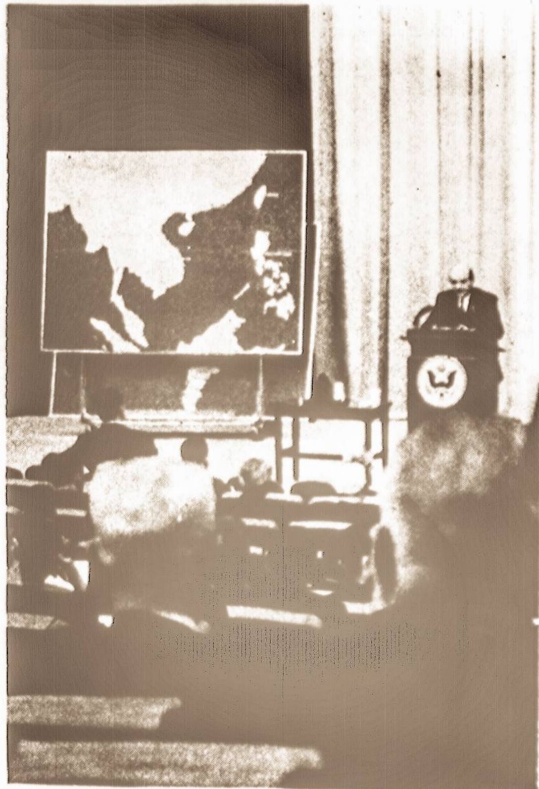
Valstybės Sekretorius Dean Rusk, ką tik grįžęs iš Vietnamo, duoda pranešimą jo sukviestoje spaudos konferencijoje Washingtono bal. 21 d.