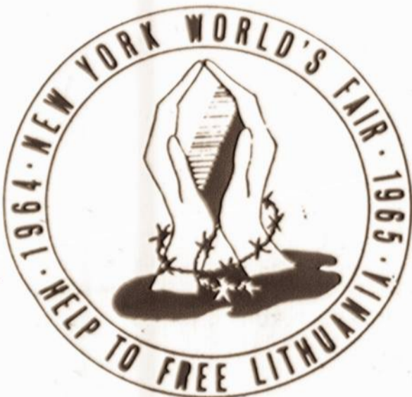
Konkursą laimėjęs Pasaulinės Parodos ženklelis.