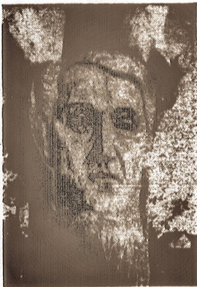
Barokinis Vinco Krėvės portretas

Vilniuje išeinantis Lit. ir Menas rašo, kad moksleiviai papuošė Vinco Krėvės tėviškę netoli Merkinės.