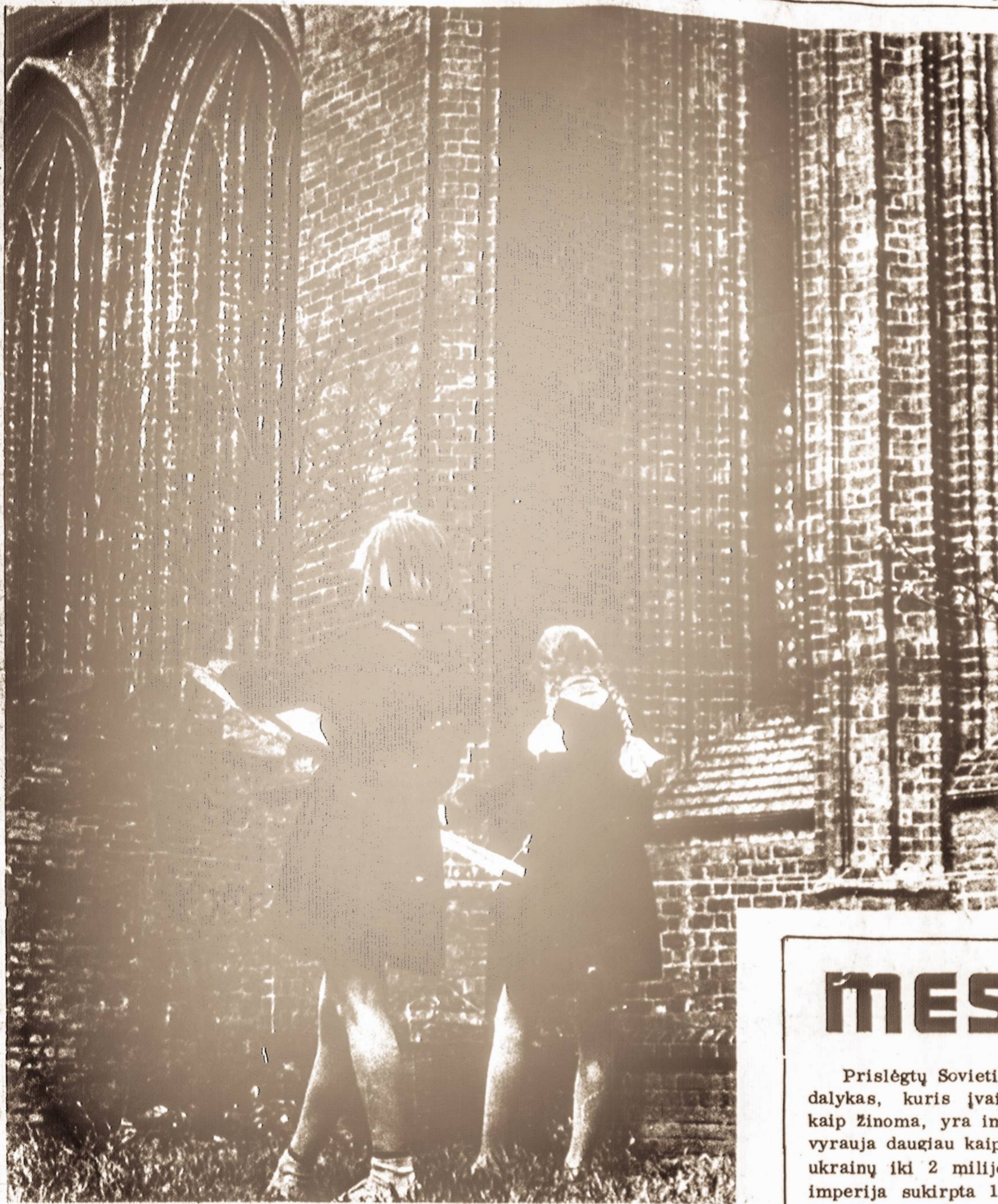
MOKSLO METAMS VILNIUJE PRASIDĖJUS... Jaunos dailininkės piešia garsiosios šv. Onos bažnyčios eskizus.