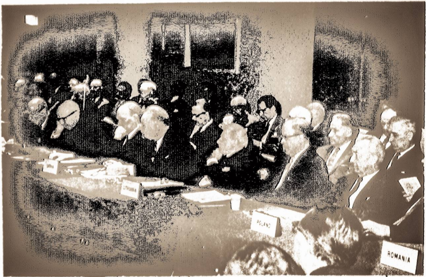
Pavergtųjų Tautų atstovai viename iš savo posėdžių.