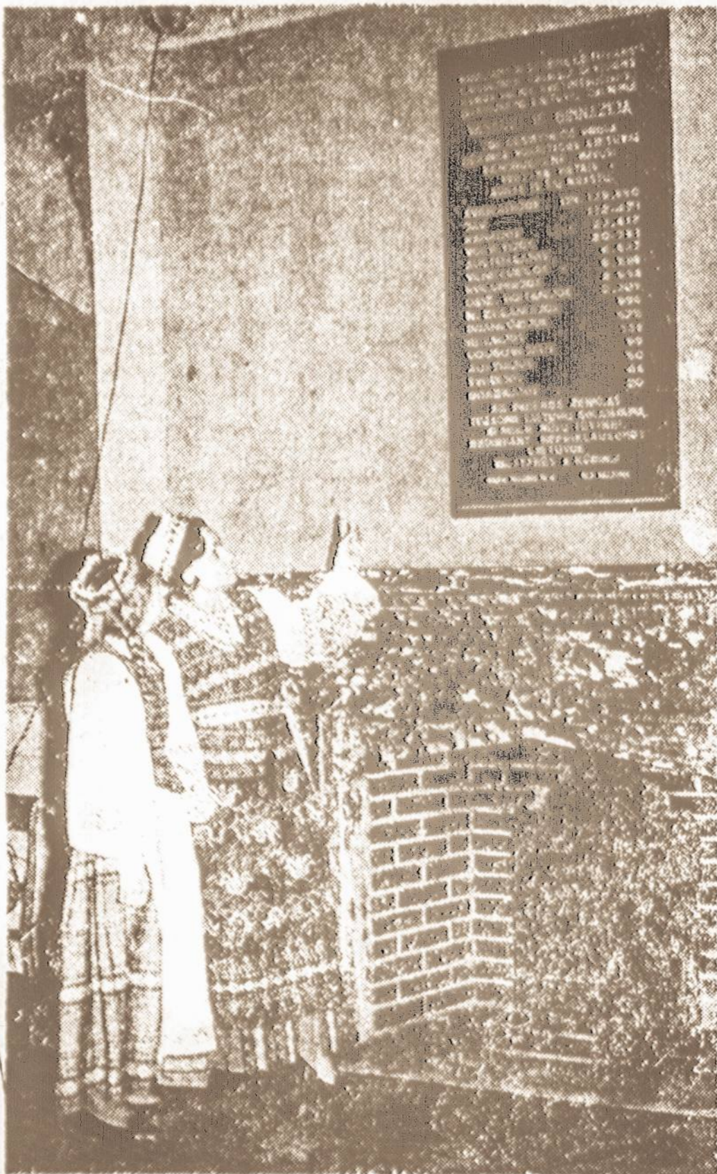
Vokiečių spaudoje tilpusi nuotrauka iš Vasario 16 Gimnazijos, vaizduoja lietuvaites prie paminklinės didžiojoje Gimnazijos salėje.

Nepamirškite atnaujinti Vienybės prenumeratą.