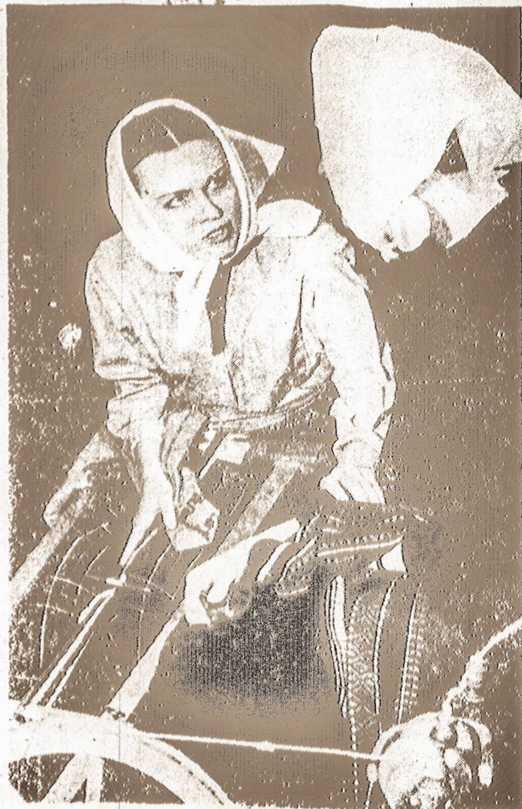
Vokiečių spauda ne tik plačiai aprašė Vasario 16 minėjimą Liet. Gimnazijoje Vokietijoje, bet išidėjo ir nuotraukų. Čia vaidas iš vaidinimo "Lietuvos kryžiaus kelias."