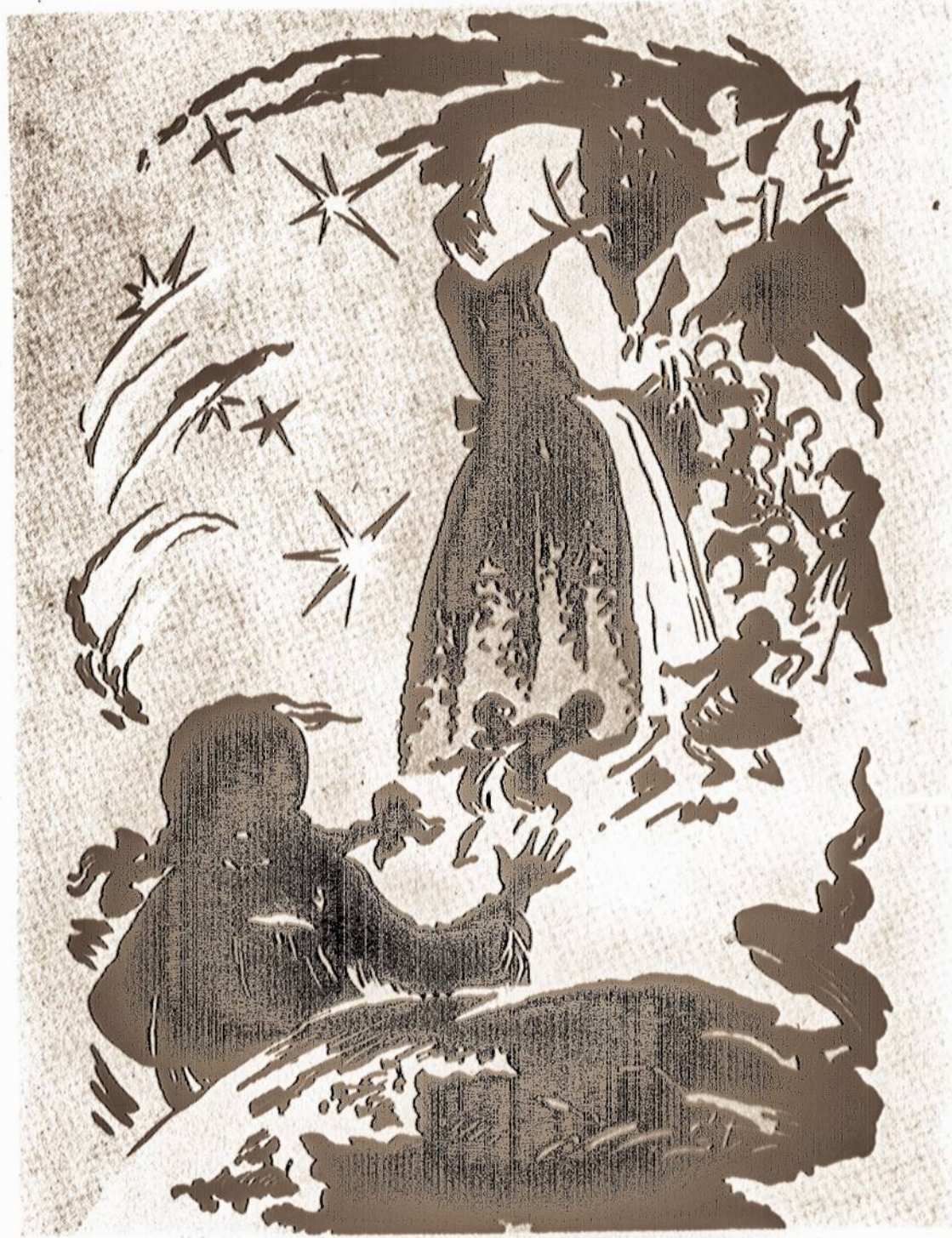
Vlados Stančikaitis iliustracija "Senolės pasakoms".