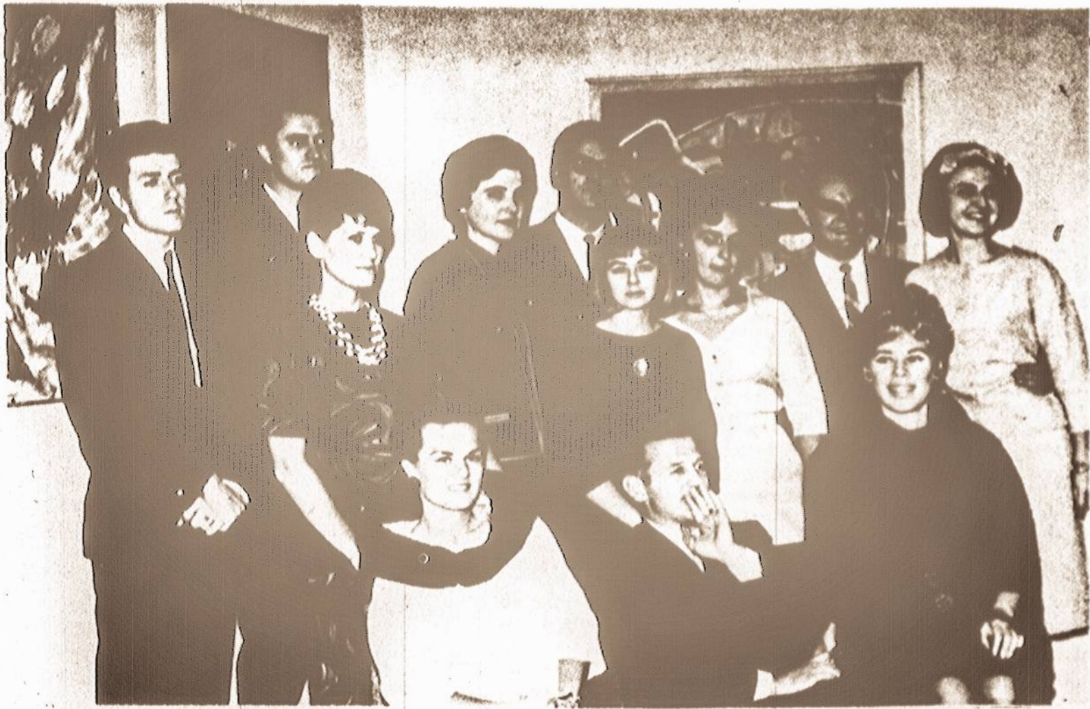
Jaunųjų dailininkų grupė per ankstesnę meno parodą Chicagėje. Šiemet jie savo parodą rengia kovo 19 - 27 dienomis Čiurlionio galerijoje.