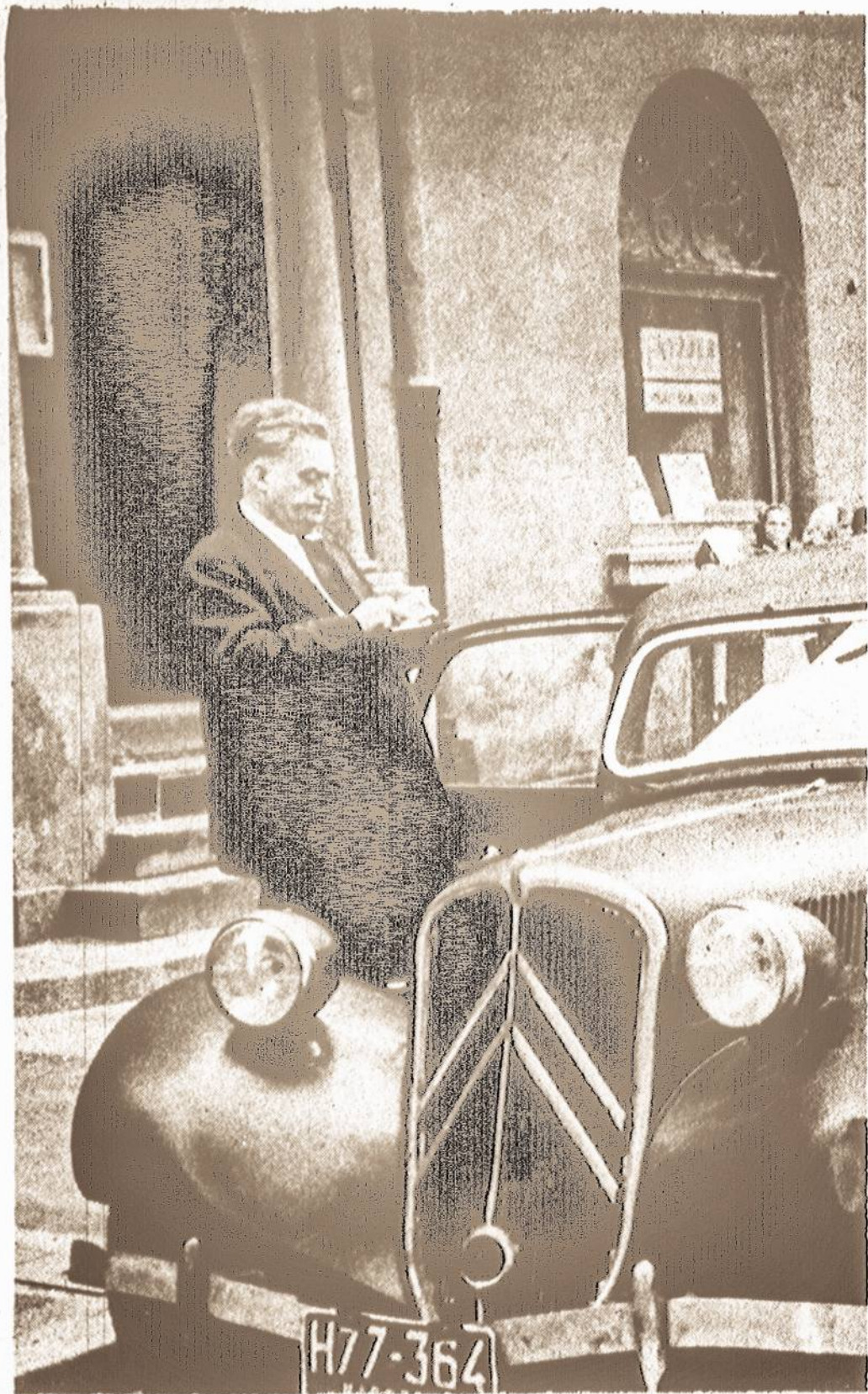
Garsusis lenkų publicistas St. Cat-Mackiewicz, šioje S. Narkėliūnaitės nuotraukoje matomas 1958 m. Varšuvoje prie savo automobilio, neseniai pasimirė Lenkijoje. Jisai buvo pabėgęs į Londoną ir tenai darbovosi lenkų egzilyje tarpe, bet vėliau sugrįžo į Lenkiją. Jisai buvo tarp intelektualų, kurie neseniai Lenkijoje pasirašė raštą, reikalaujanti iš valdžios daugiau laisvės rašytojams.

Vertas dėmesio faktas, kad iš visų 60 šalių didžiausias skirtumas tarp vyrų ir moterų vidutinės gyvenimo