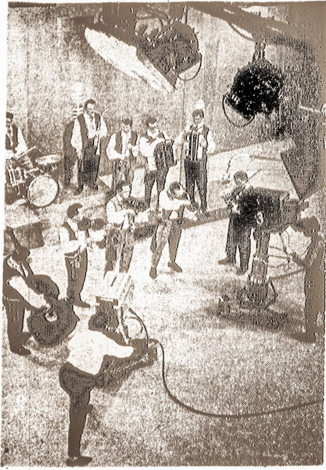
LAIDOS METU TELEVIZIJOS STUDIJOJE LIETUVOJE.

* Į Montrealą atvyko iš Lietuvos Skučų tėvelis, išbuvęs Sibire 10 metų.