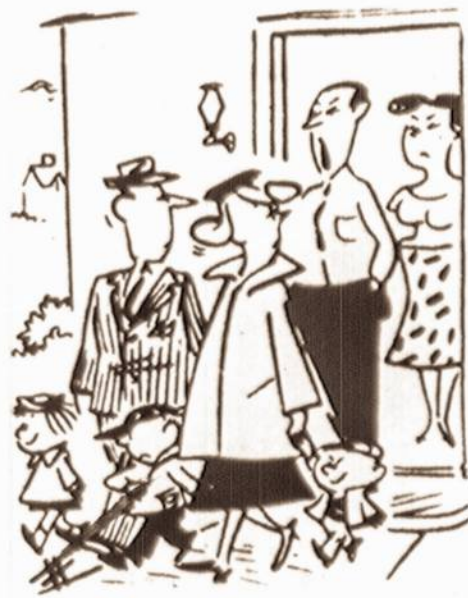
Ateikite vel, bet kai vaikai užaugs.