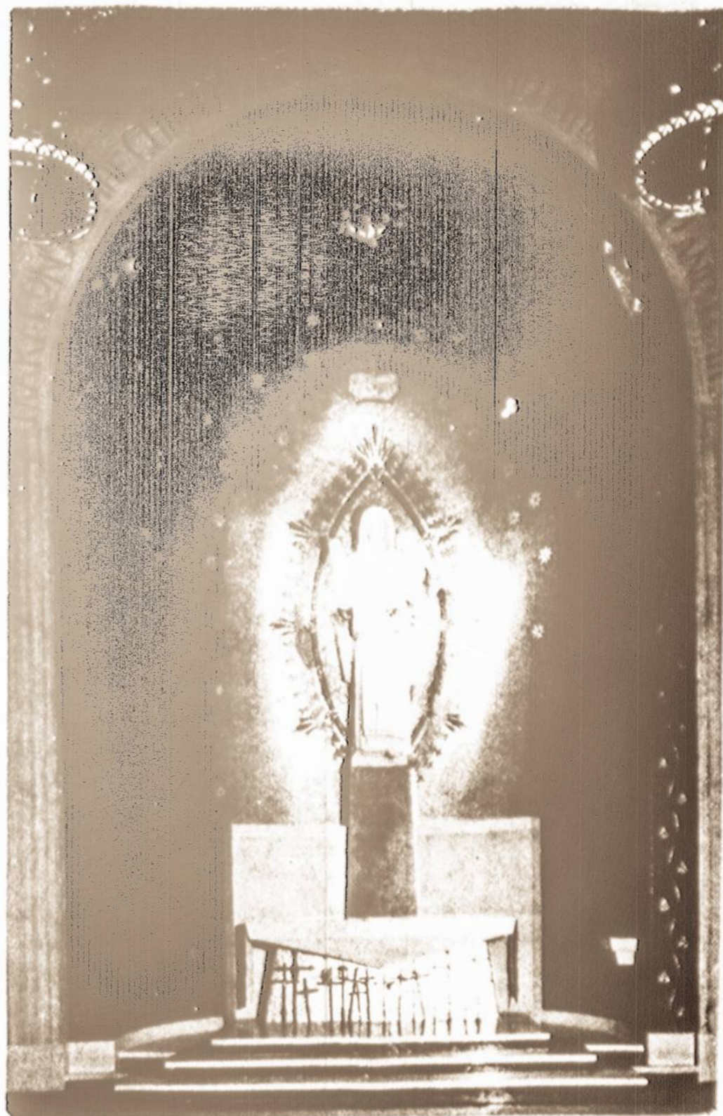
Iš lietuvių Šiluvos koplyčios Washingtono, kur rugsėjo pradžioje įvyksta koplyčios dedikacija: kairėje – Šiluvos koplyčios Madonos, dešinėje pagrindinis altorius.