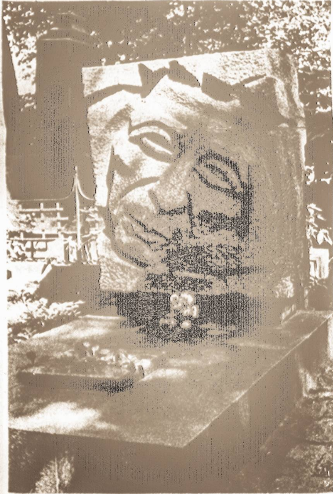
POETO PETRO VAIČIŪNO antkapis Rasų kapinėse Vilniuje.