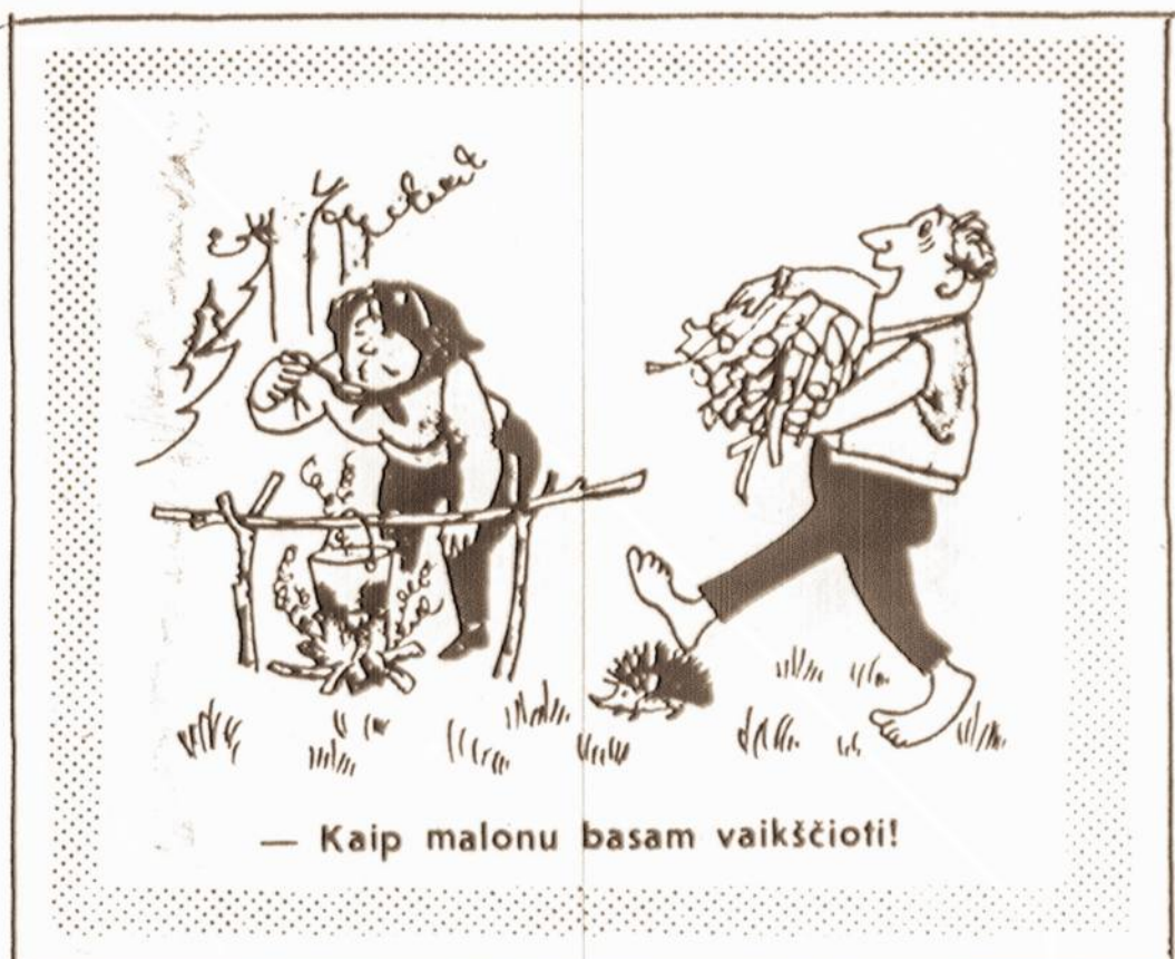
— Kaip malonu basam vaikščioti!