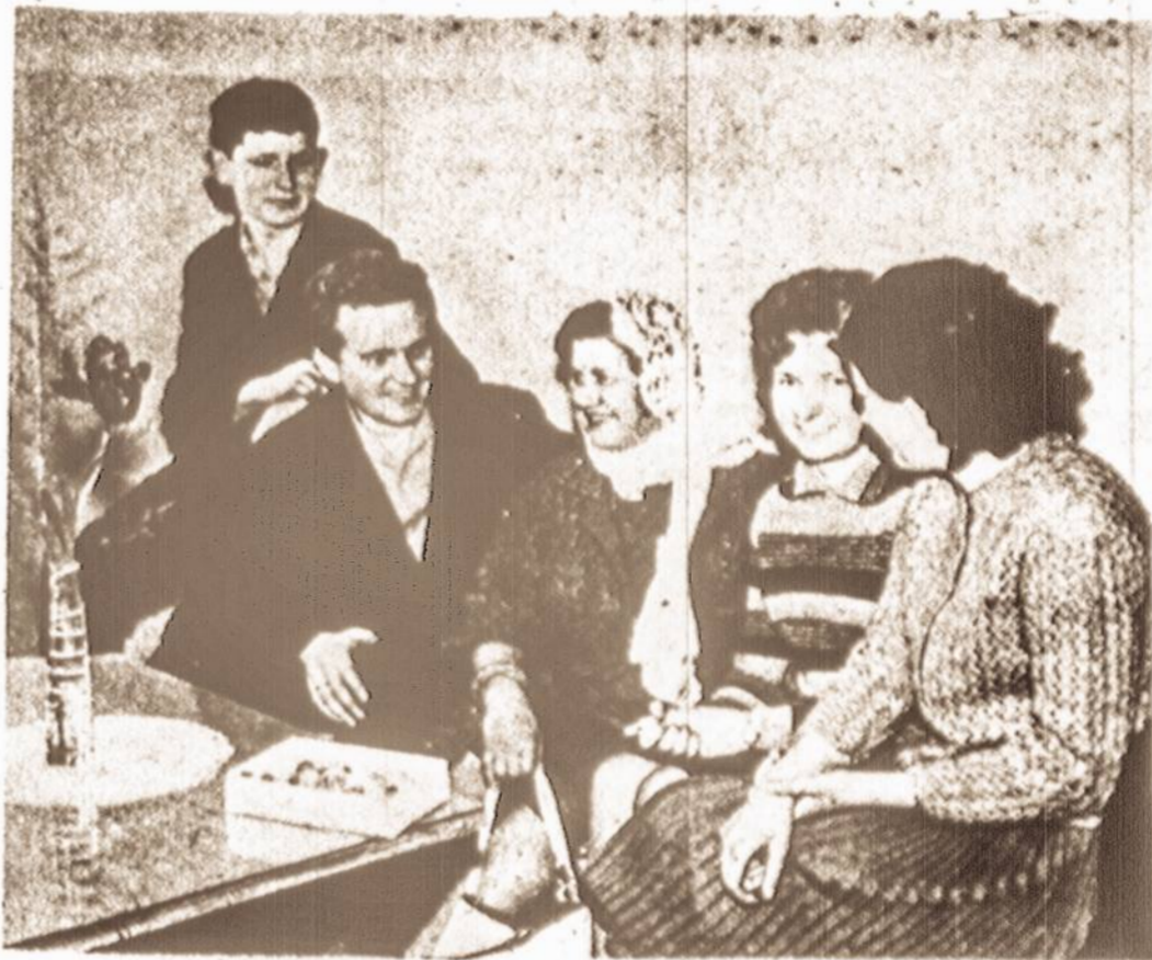
PAS SAVO VYRO VAIKAIČIUS