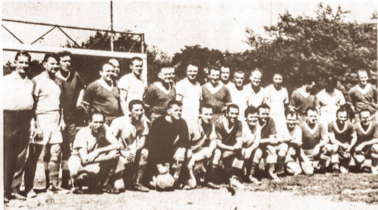
CHICAGOS LIETUVIAI futbolo veteranai kartu su savo varžovais vokiečiais rugsėjo 4. Plačiau apie jų rungtynes buvo rašyta Vienybės Nr. 25.