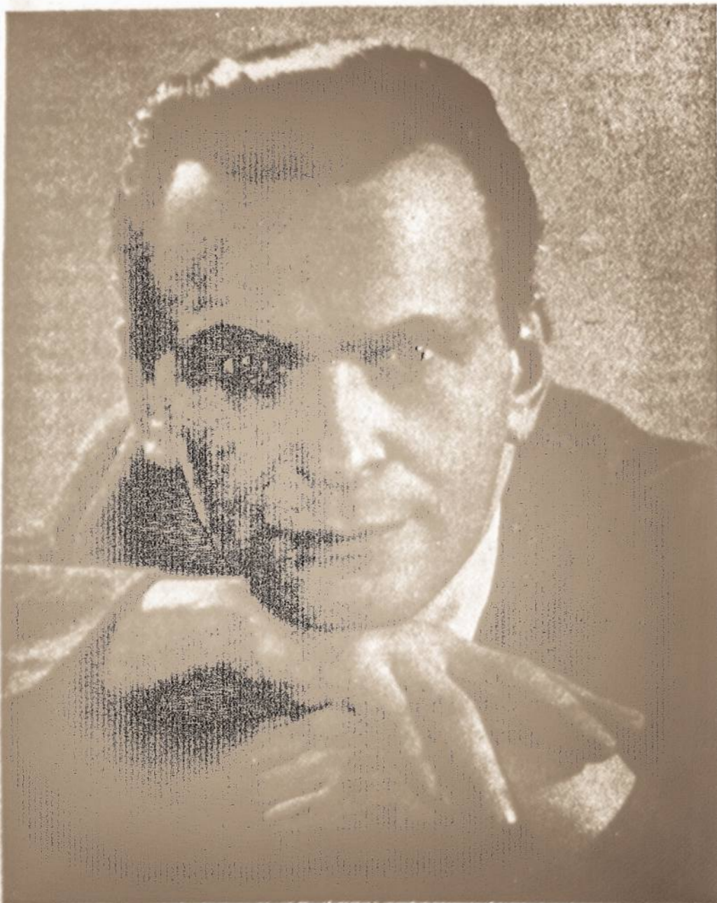
KAZYS INČIŪRA, kuriam šiemet suėjo 60 metų amžius, vienoje savo ankstyvesnių nuotraukų. Amerikoje, ypač New Yorke esantieji rašytojo bičiuliai, tos sukakties proga, tiesia jam draugišką sveikinimo ranką, linkėdami geros sveikatos ir kūrybinių metų. Sukaktuvininkas gyvena Vilniuje.

* Kretingos baldų fabrike gaminami suvenyrai, susilaukę didelio susidomėjimo Leipzigo mugėje, bus eksponuojami ir Tarptautinėje Parodoje Montrealyje 1967 m.