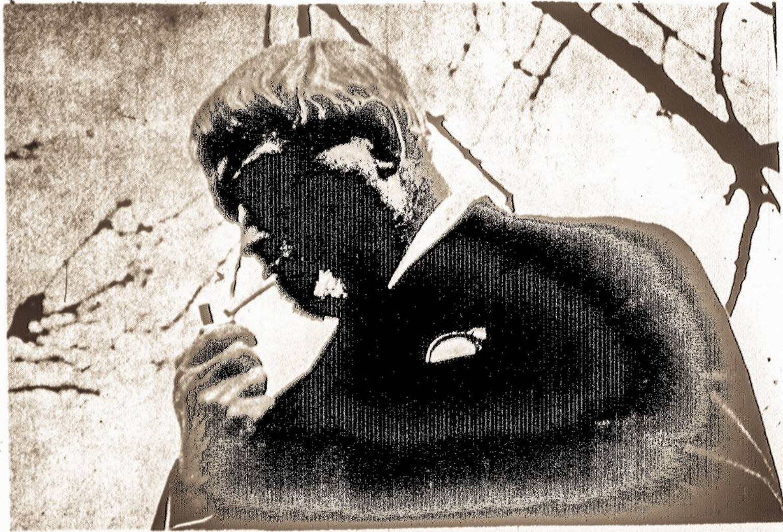
JUOZAS MILTINIS Panevežyje yra sukūręs dramos teatrą, kuris yra tikras Lietuvos pa-sididžiavimas. Jis yra vyriausiasis jo režisorius.