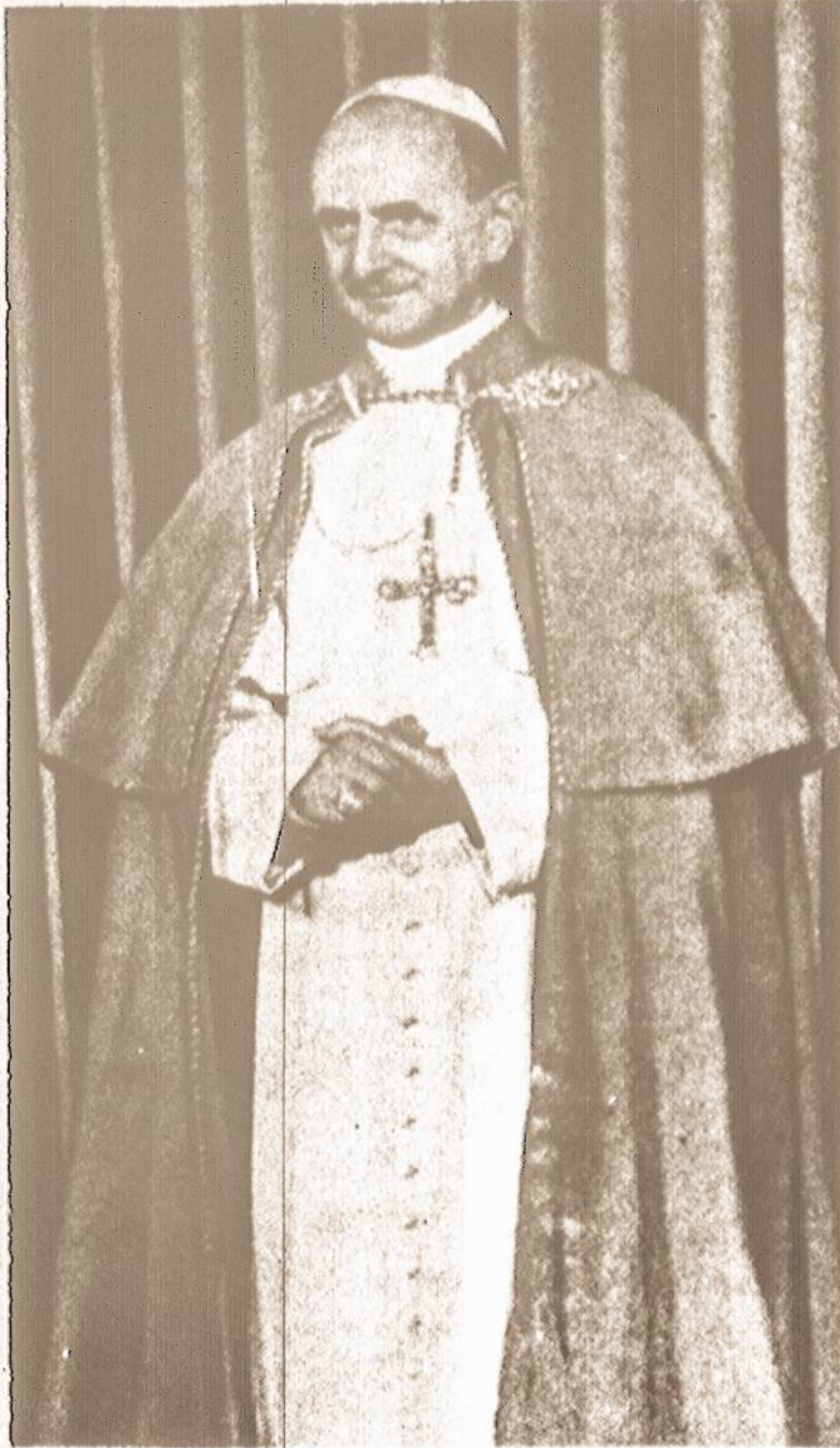
Popiežius Paulius VI

Protestai pasauliui taip pat nusibodę. Ypač jie įgrįsę ieškantiems kelio į taiką. Su savo protestais iki šiol nieko