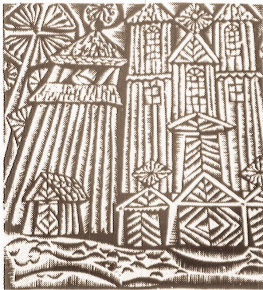
DAILĖS MUZIEJUJE - A. Skirutytės grafika - "Bučių giesmė".

Kitame numeryje pasistengsiu atsakyti į man pateiktus klausimus.