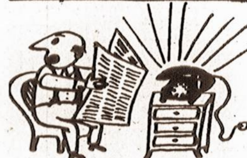
— Zosė! Tave prie telefono!

Prancūzų filosofas Montenis kartą pastebėjo: