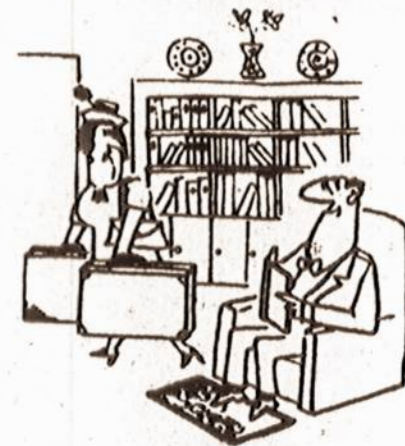
— Nesidžiauk, išnešu la-gaminus taisyti...