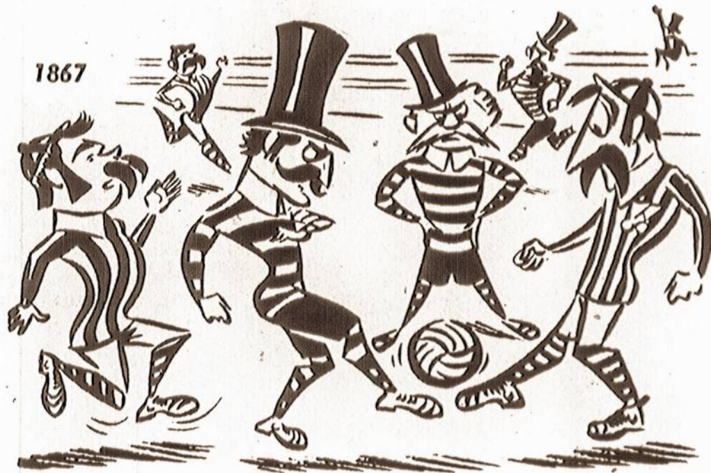
1867 Stai kaip, anot anglų dailininko, dėl pergales futbole buvo kovojama prieš šimtą metų ir kaip tai atrodo dabar