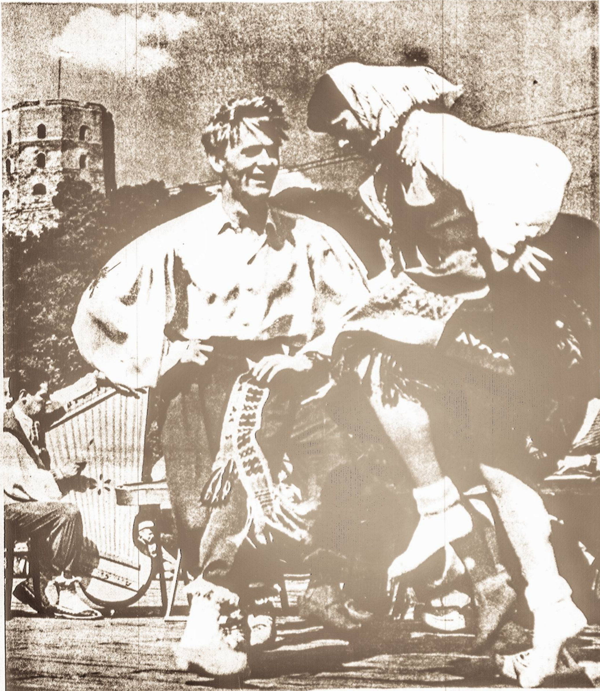
ANSAMBLIO "LIETUVA" šokėjai, kurie dalyvaus Lietuvos dienoje birželio 23, Montrealio Kanados Pasaulinėje Parodoje - EXPO '67.