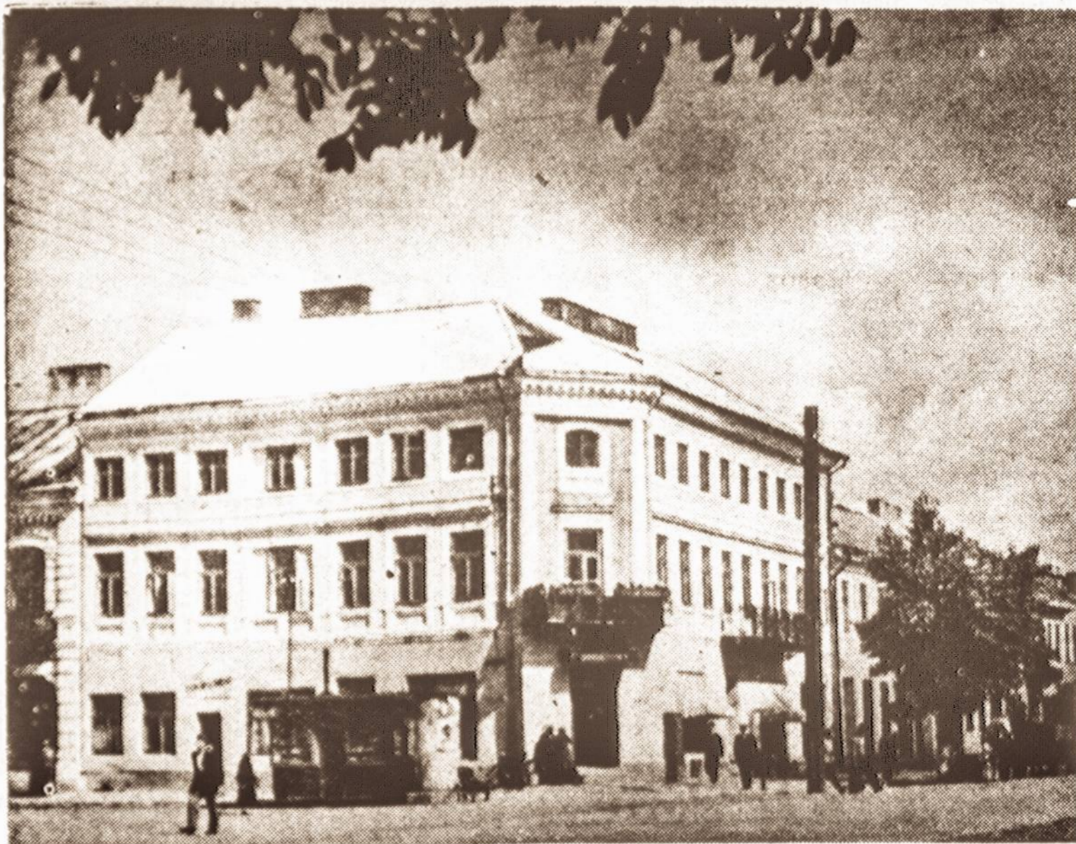
Vaizdelis iš Suvalkų.

Request Records, Inc. 66 Mechanic Street New Rochelle, N. Y. 10801