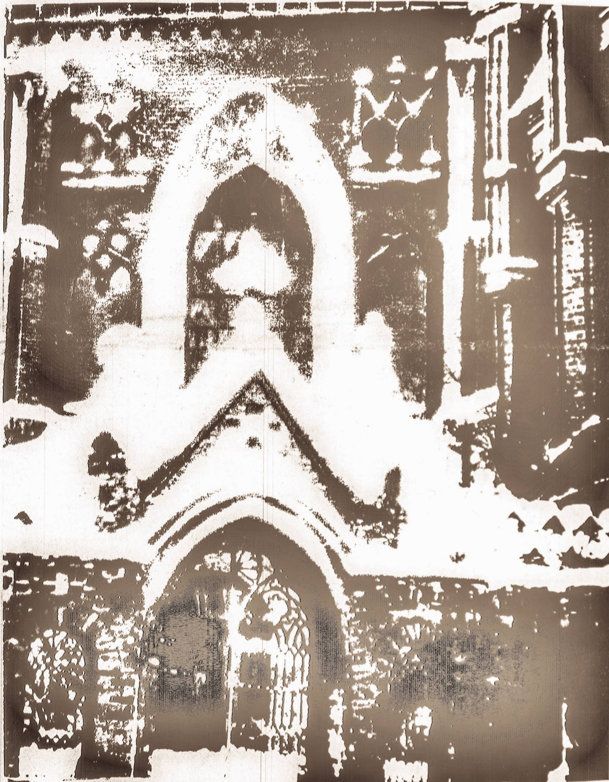
KALĖDOS VILNIUJE. BERNARDINŲ BAŽNYČIOS FASADO FRAGMENTAS.