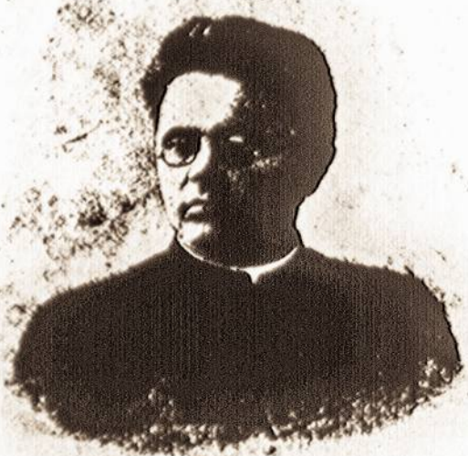
Kun. Juozas Tumas

Atsiranda drąsus žmogus, visa savo karšta širdimi numylėjęs Lietuvą, visą amžių kentęs sopulius už tėvynę... tai kun. Juozas Tumas.