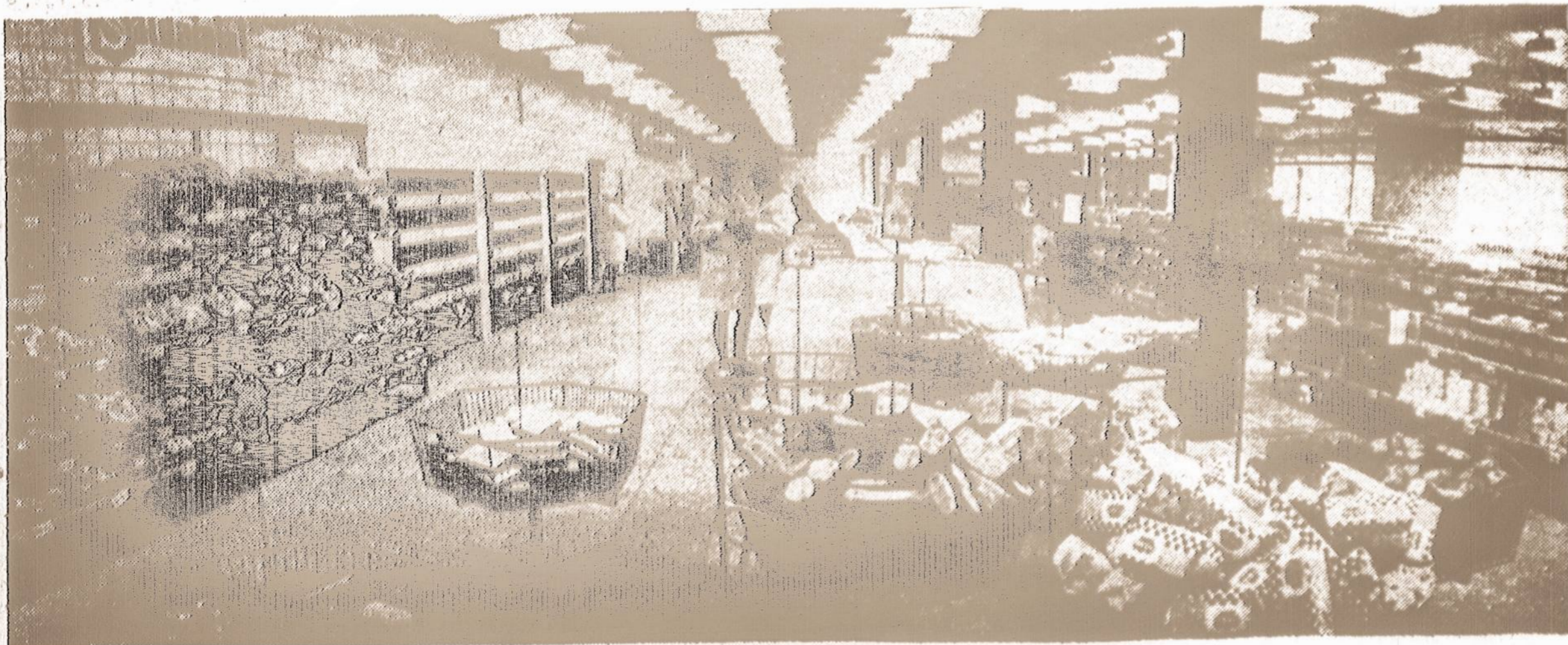
SUPERMARKETAS LIETUVOJE. - Naujame Vilniaus priemiestyje Žirmūnuose įsteigtas ir amerikoniško stiliaus supermarketas, kuris aptarnauja 5,000 pirkėjų kasdien. Parduotuvė ir Lietuvoje vadinama "supermarketas".