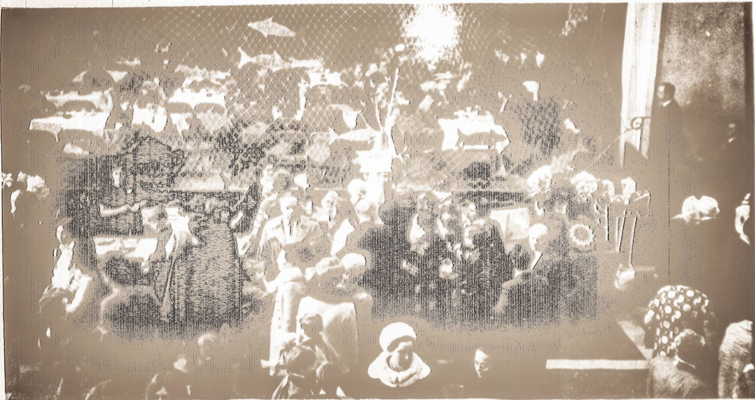
SKAUTAI PREKIAUJA. - Chicagos jūrų skautai sausio 25 Jaunimo namuose surengė Klaipėdos uosto mūgę. Matomi lankytojai ir prekyautojai. Už tinklo, scenoj "Gintaro kavinė".