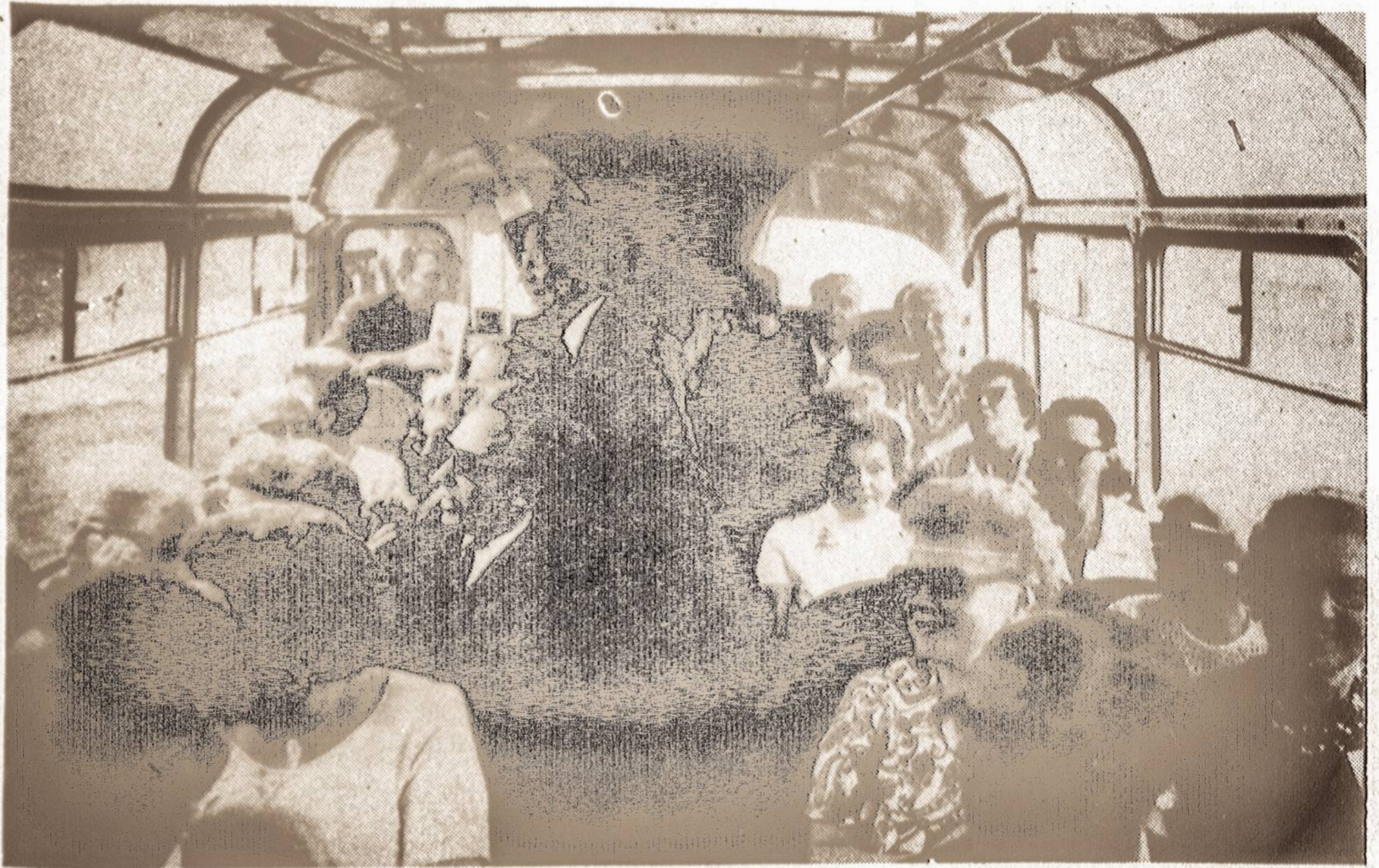
AMERIKOS LIETUVIŲ GRUPĖ AUTOBUSU KELIAUJA PO VILNIŲ IR APŽIURI ĮDOMESNIAŠIAS VIETAS

Iš tiesų, praėjusią vasarą į Lietuvą buvo ypatingai daug sugužėjusių pažangiųjų (juos daug kas pravardžiuoja komunistais ar raudonaisiais). Dabar pažangieji yra tie, kurie Amerikoje susispietę apie Vilnių ir Laisvės laikraščius, Kanadoje — apie Liaudies Balsą. Jie, kaip taisyklė, labai nekritiškai atšliepia dabartinės Lietuvos valdytojų adresu. Jie akylai seka tenykštę muziką, ir pagal jos taktą — šoka. Nežiūrint, jog kai kas drąsesnių privačiai išreiškia vienu ar kitu klausimu nepasitenkinimo, tačiau jų spauda yra šimtaprocėntiniai tarybiška. Tai, galima sakyti, yra Vil-