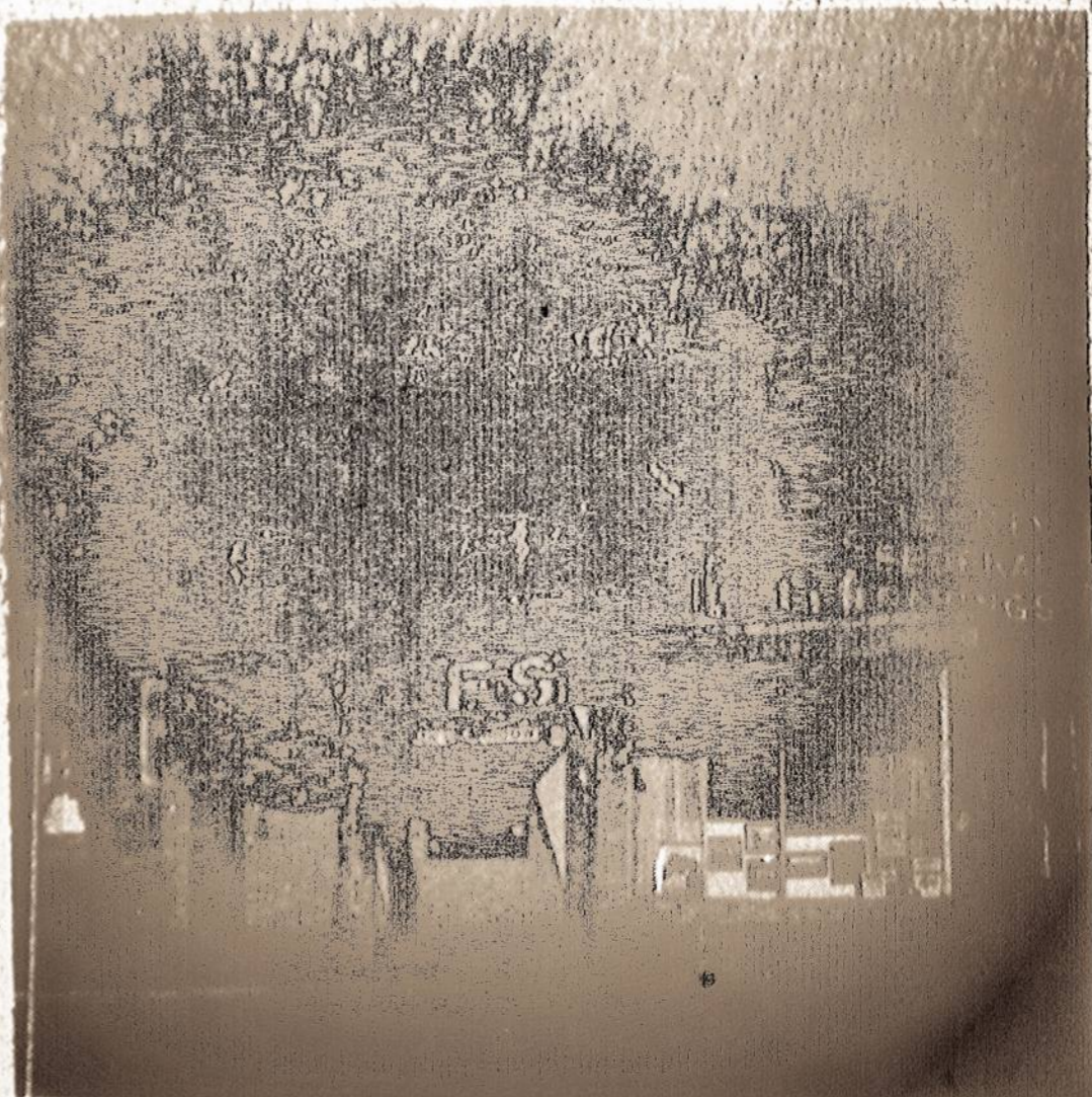
Taip atrodo pirmasis Liberty Federal banko skyrius Stenton ir Duval gatvėse, Philadelphijoje.