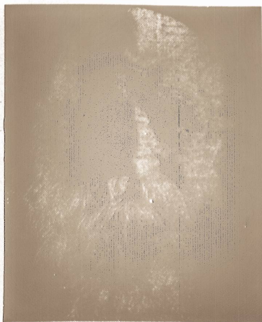
PETRAS LEPIOKINAS GIMĖS 1862 M.