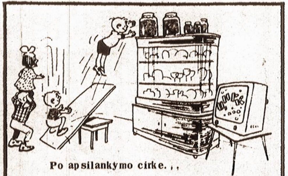
Po apsilankymo cirke...