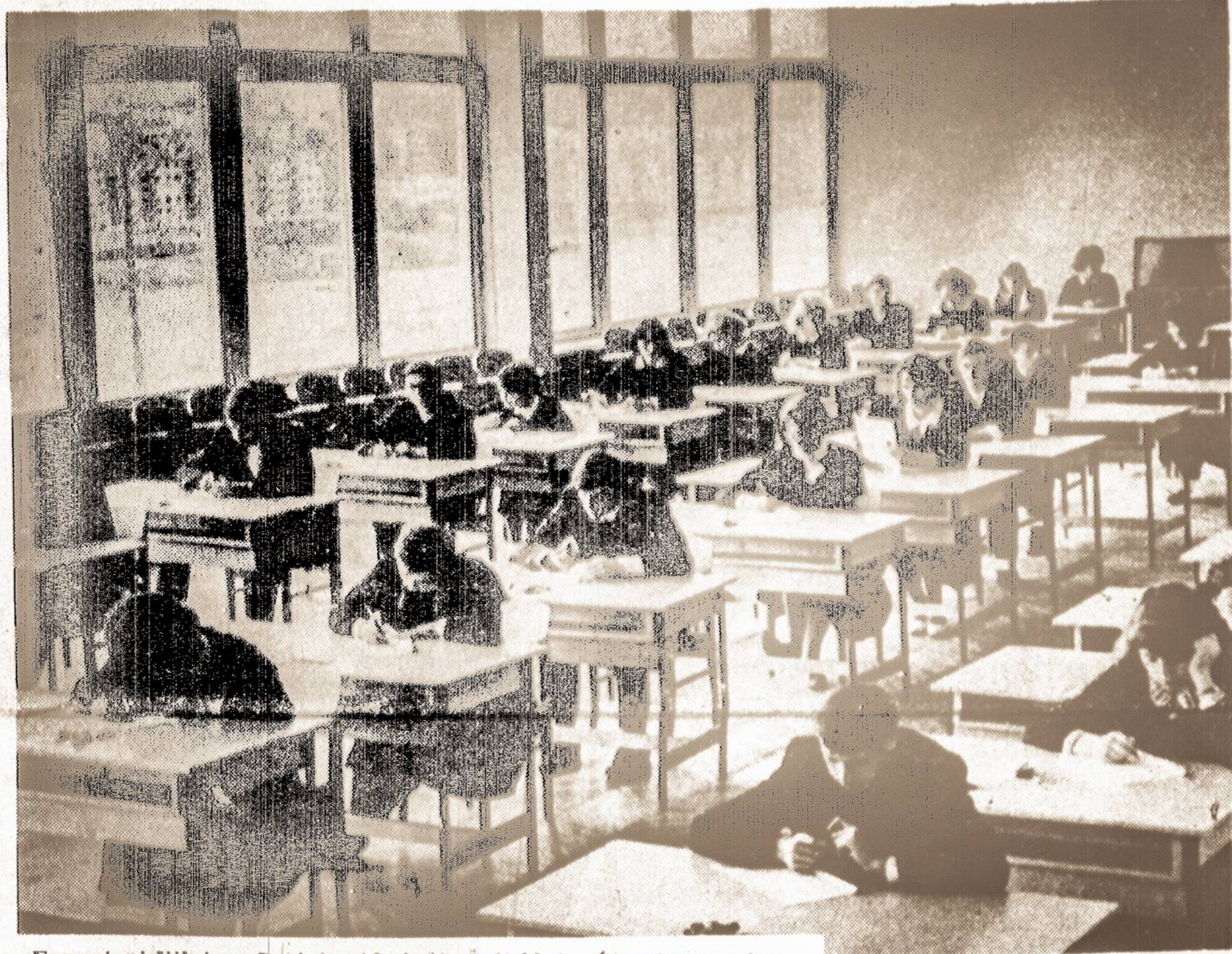
Egzaminai Vilniaus 7-ojoje vidurinėje mokykloje. Čia nėra pavojaus jaunimui ištautėti, nes viskas dėstoma lietuviškai.

Vienybės skiltys nuo 1886 m. atviros viskam kas skatina lietuvybę išeivijoje išlaikyti. Vienybės patalpose yra buvusių ir lituanistinių mokyklų, jos redaktoriai ir kiti personalo nariai per metų metus yra ir mokytojavę. Jos žmonės yra "ant rankų nešioję" kiekvieną iš Lietuvos atvykusį inteligentą, ypač mokytoją. Kita senosios kartos įsteigta, dar ir dabar tebesanti didžiausia lietuvių organizacija išeivijoje, SLA kiekviename savo Seime yra paskyrusi ir tebeskiria aukų lituanistinėms mokykloms. Senuosiuose lietuvių klubuose ir kai kuriose parapijinėse salėse, būdavo spintos su knygomis, klubai prenumeruodavo spaudą, salėse jaunimui ir suaugusiems būdavo nuolatinės lituanistikos paskaitos. Bet tai buvo daugiau kaip prieš 30 metų.