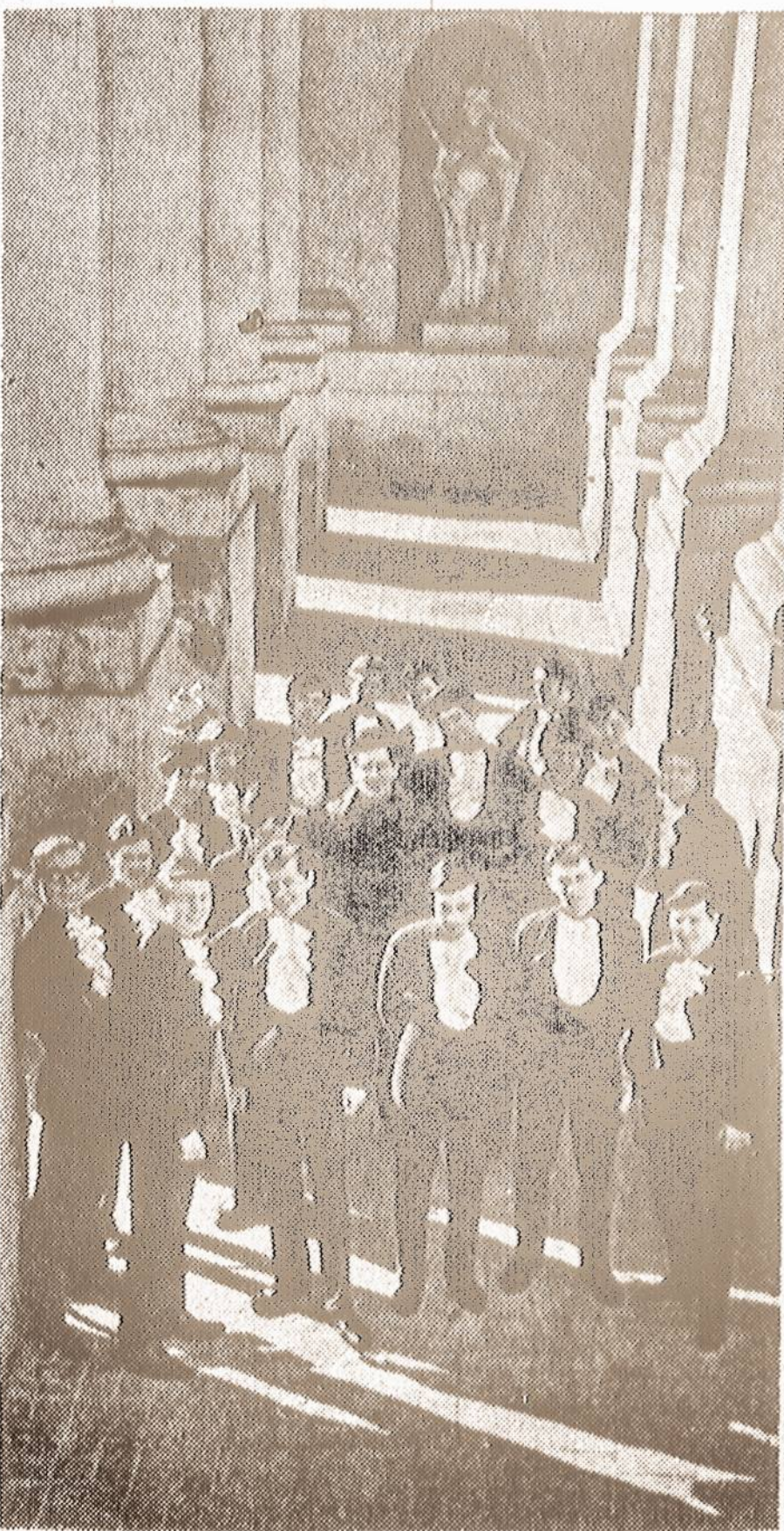
"Ažuoliukas" principal choir.