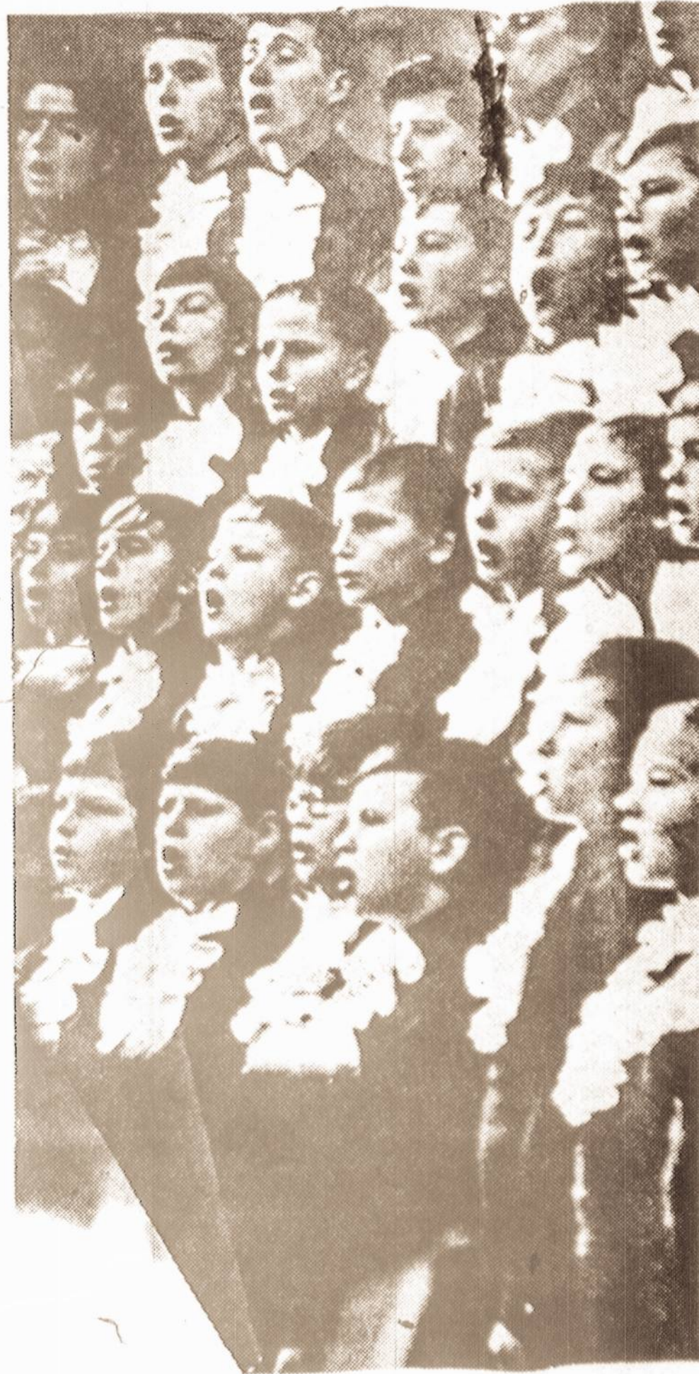
They are singing Bach.