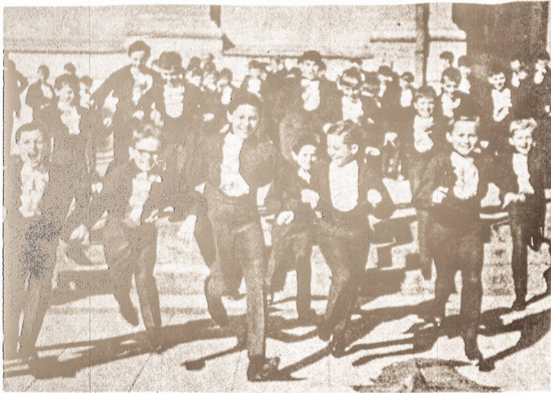
After a successful concert performance, it's time to have some outdoor fun.