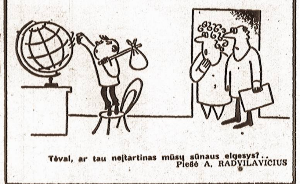
Tėvai, ar tau neįtartinas mūsų sūnaus elgesys?... Piešė A. RADVILAVIČIUS