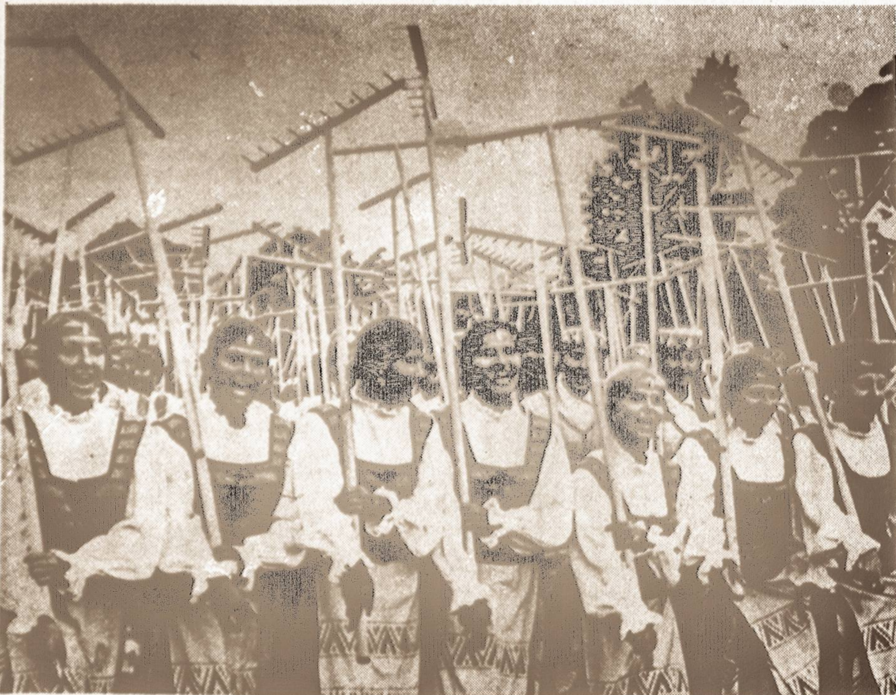
Kai aš grėbiau lankoj šiena. . . Vaizdas iš praėjusių metų šventinio parado Vilniuje.