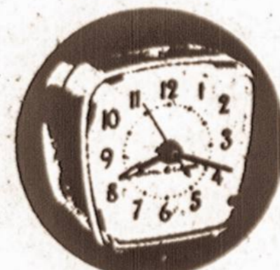
GENERAL ELECTRIC ALARM CLOCK