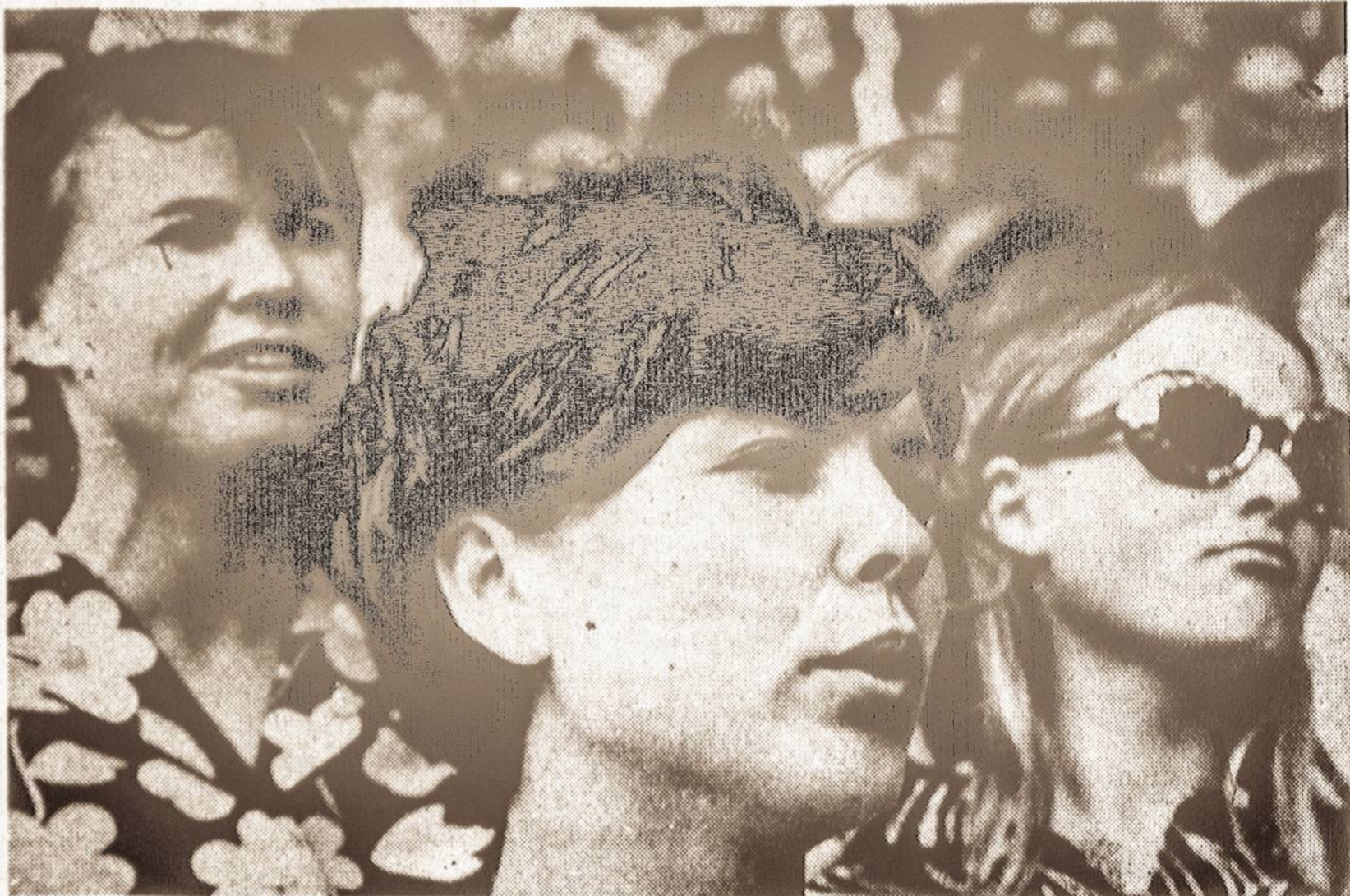
"Ir gražios tos šalies merginos. Šalis ta Lietuva vadinasi, bet aš neilgai ten buvau".

Būnant aukštai, viršuj debesų, kai, lyg šilku atauti patalai slenka po kojų, nuotaika tikrai nekasdieniška. Atitrūkus nuo tamsios žemės, - jautiesi lyg kitame pasaulyje, kur