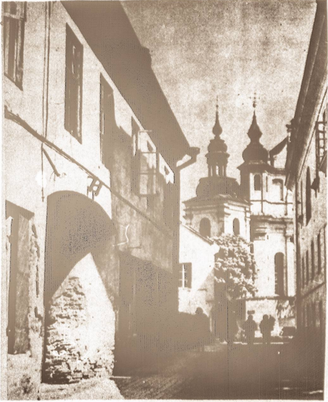
Vilniaus senamiesčio vaizdas iš Biliūno gatvės.