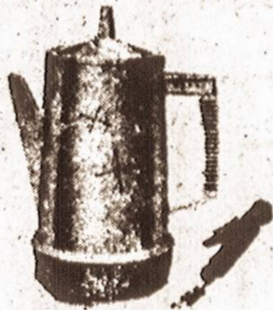
4 TO 8 CUP ELECTRIC PERCOLATOR