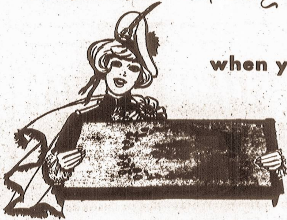
HOSTESS ELECTRIC TRAY

when you open a Savings Account for $100. or more