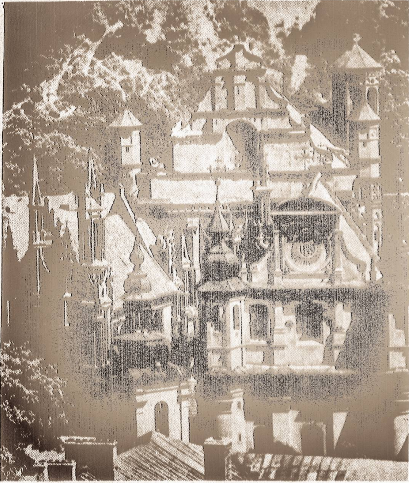
VILNIAUS SENAMIESTYJE. Šv. Mykolo bažnyčia ansamblyje.