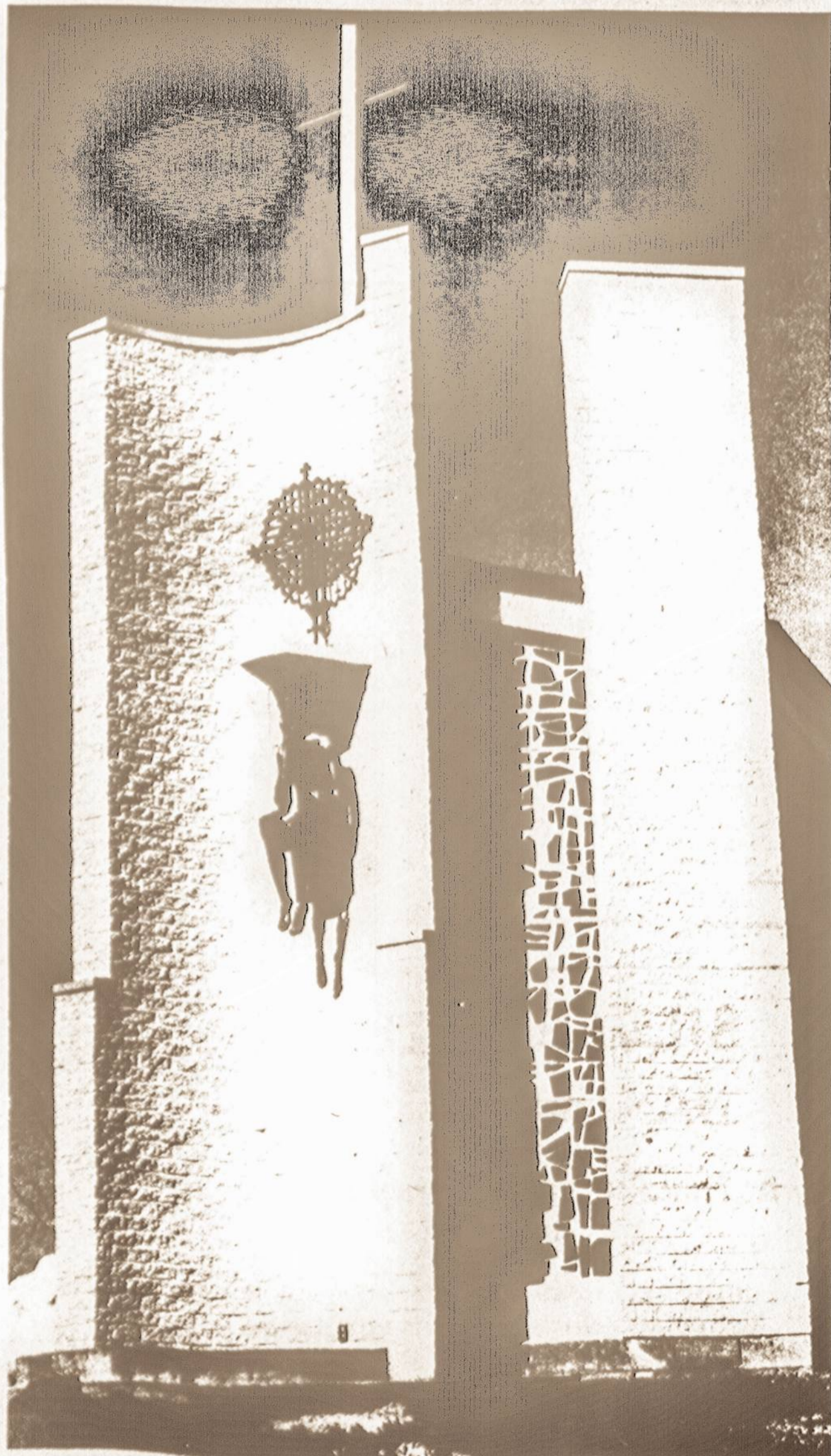
Front facade of St. Ann's Chapel in St. Casimir's Cemetery in Amsterdam, N. Y.