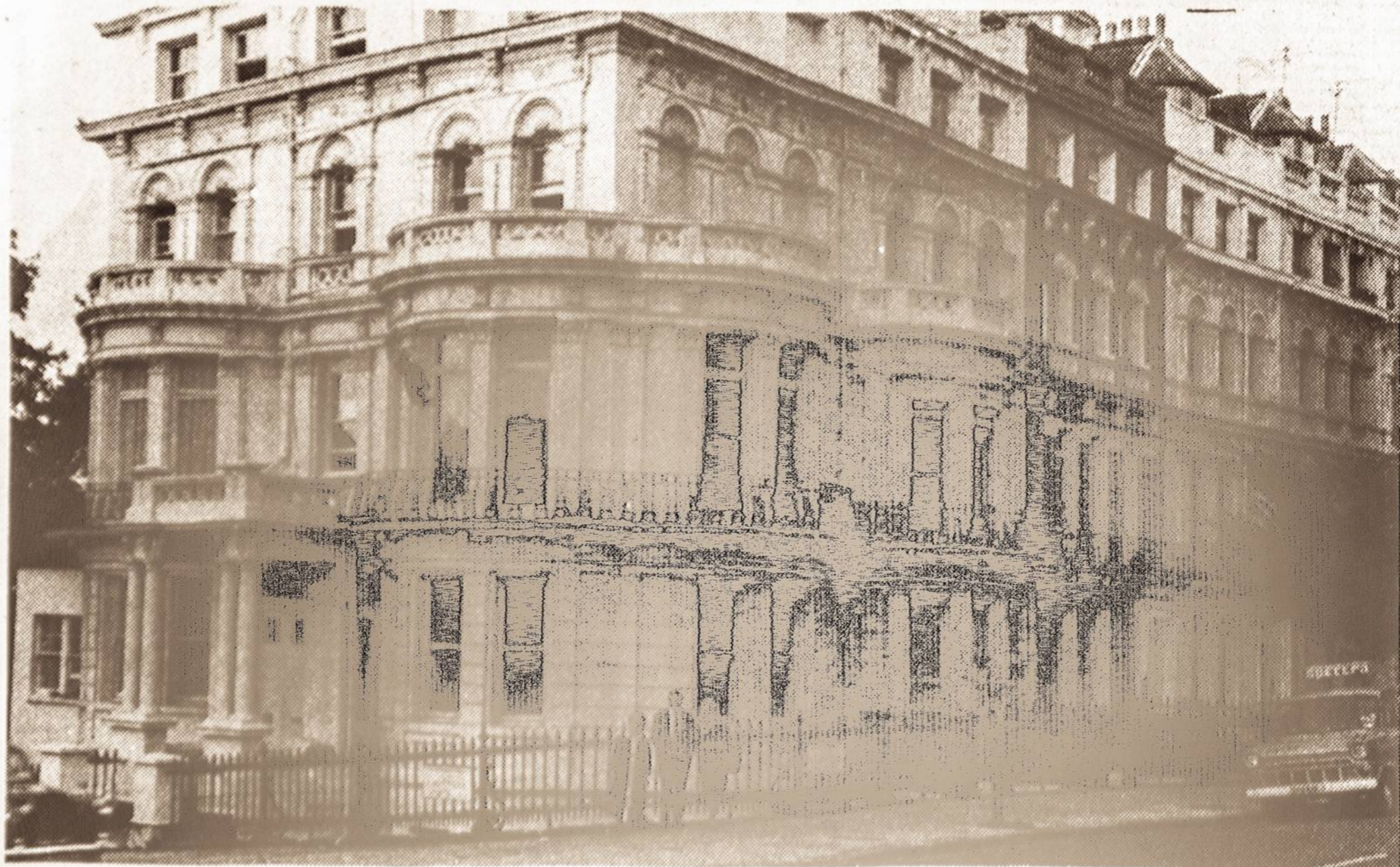
LIETUVIŲ NAMAI, 1 - 2 Ladbroke Gardens, London, W 11 2 PU. Čia yra 30 kambarių, Europos Lietuvio redakcija - administracija, knygų leidykla ir spaustuvė Nida. Nuotraukoje - M. Baronienė ir Kazlauskienė su namų b-inės sekretorium Albinu Pranckūnu.