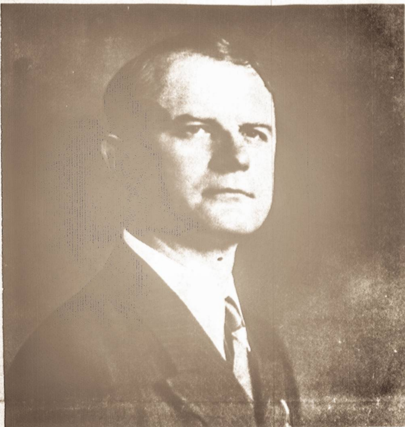
JUOZAS TYSLIAVA, buvęs Vienybės redaktorius ir leidėjas, kurio mirties dešimtmetis suejo 5 m. lapkričio 11 d. Lapkričio 1 d. jis būtų sulaukęs 69 metų amžiaus.

Daug norėjosi su poetu tą dieną pakalbėti. Nors buvo vidurvasaris, tačiau oras buvo vėsokas ir lietingas. Atrodė,