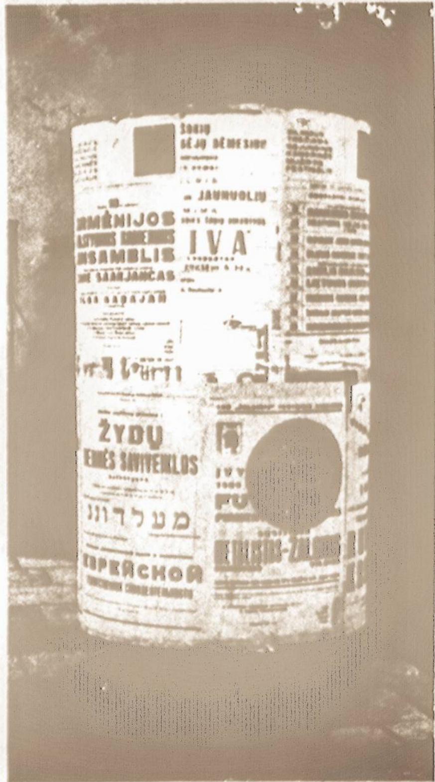
Lietuvos miestuose vieši skelbimai. Matome ir žydų veiklos reklamas.

Plačiau išsikalbėjus, susidarė išvada, kad Lietuvos žmonės labai norėjo, jog kūrybingi, patyrę specialistai lietuviai vyktų arba grįžtų į Lietuvą, jai tapus Tarybine respublika. To jie laukė iki 1963 metų, kol pradėjo išsiauklėti specialistų lavintų savose ir užsienio mokyklose, įvairiose srityse žinovų. Jie norėjo, kad lietuviai grįžtų į Lietuvą jai tapus Tarybine respublika. Iki maždaug tų metų ir dar kiek