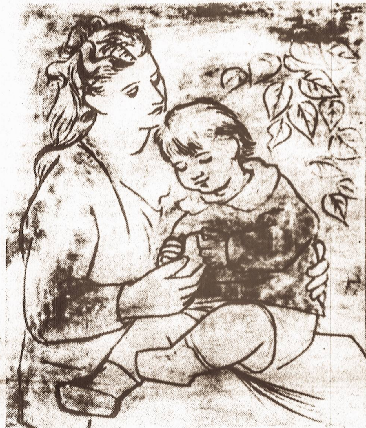
MOTINA SU KŪDIKIU. Neseniai mirusio dailininko Picasso kūrinys.