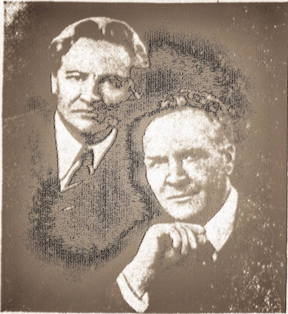
Nuotraukoje: Kipras Petrauskas ir Fiodoras Šaliapinas 1934 m. Kaune.

1934 metų pavasarį buvo reikšmingų įvykių Kauno ir Lietuvos kultūriniam gyvenime. Gegužyje afišos skelbė apie didžiojo rusų operos korifėjaus - Fiodoro Šaliapino gastrolės Kaune.