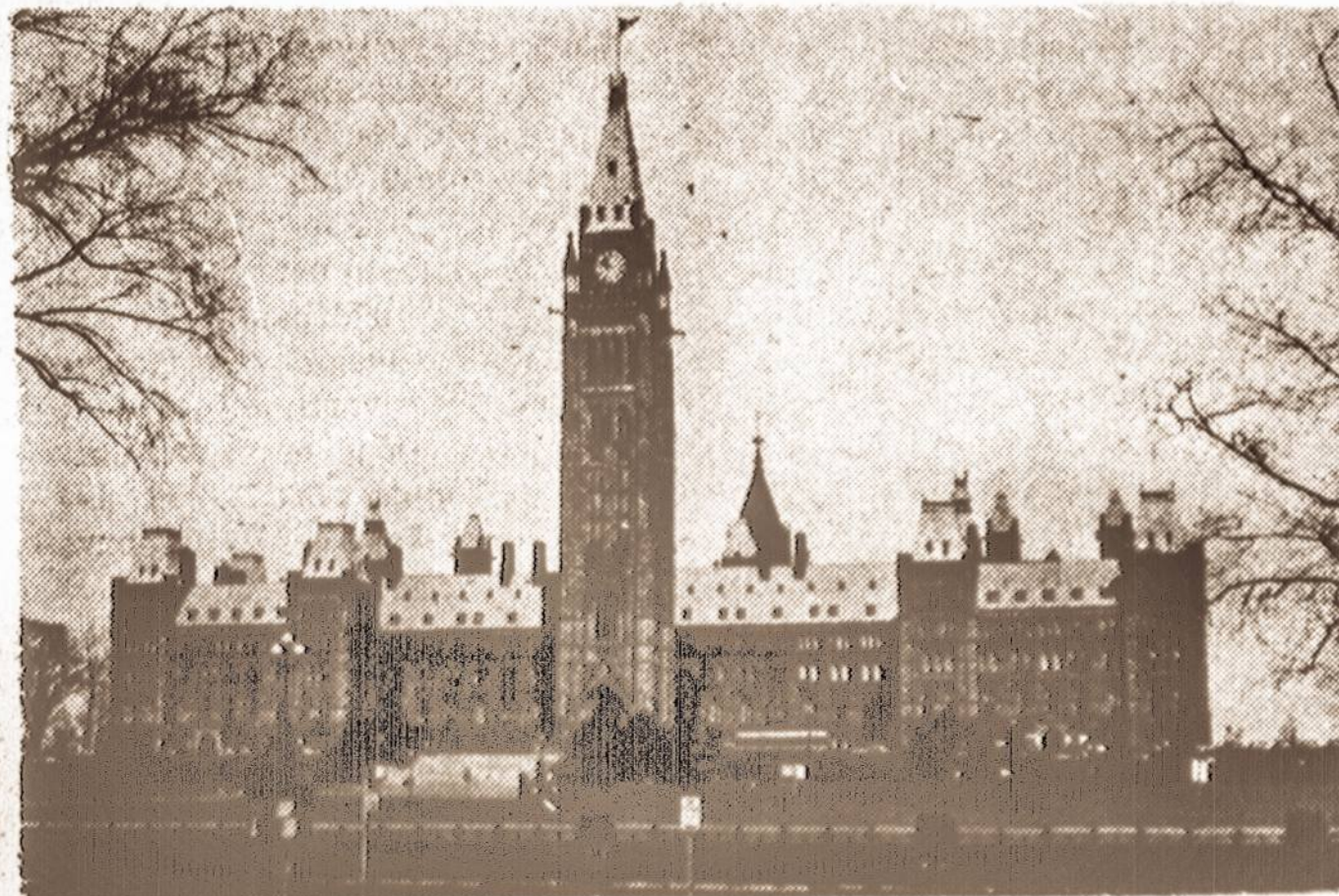
Kanados Parlamento rūmai Ottawoje.