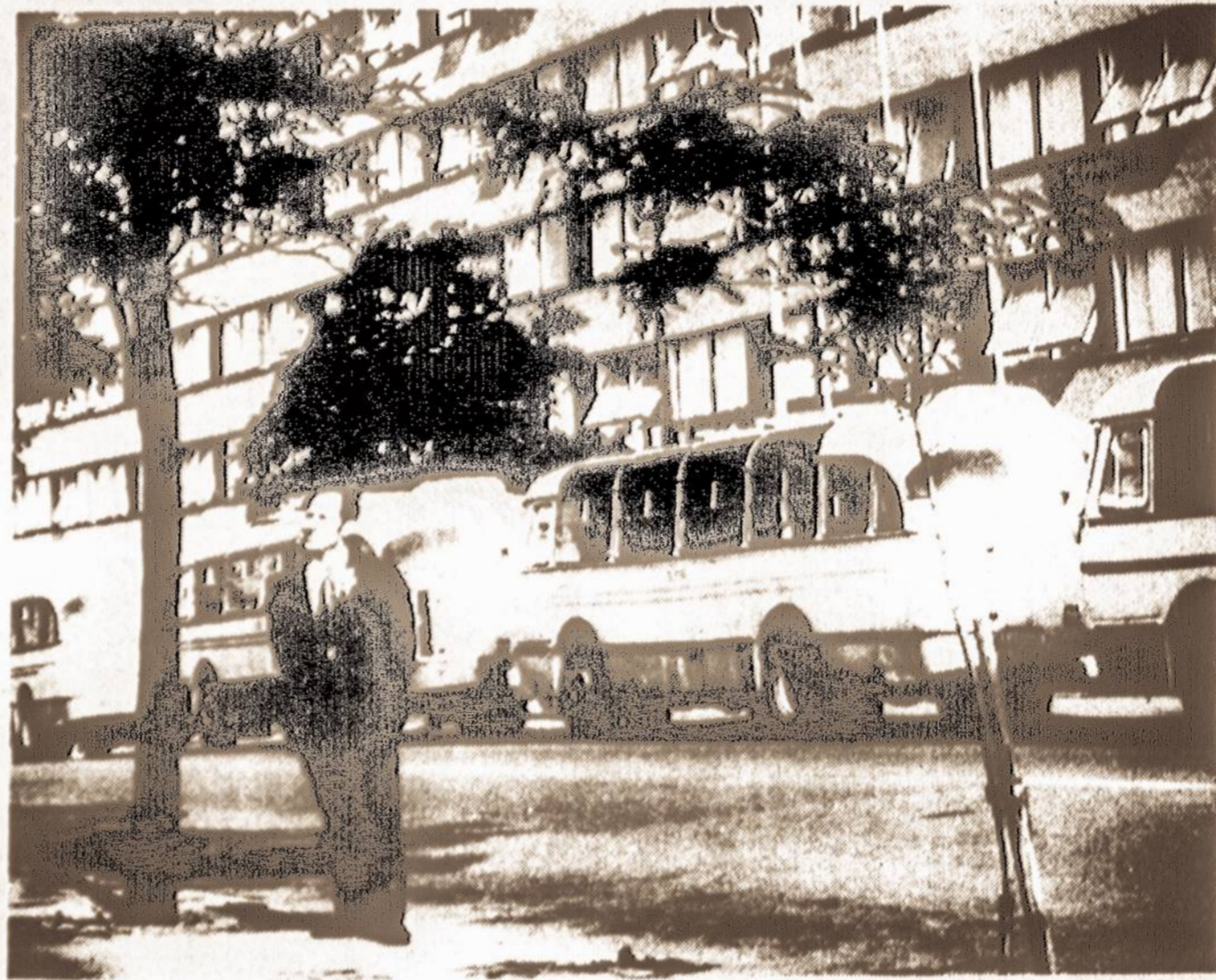
Užmiestiniuose susisiekimo autobusai prie viešbučio Kaune.

Ir Lietuvoje vis daugiau ir daugiau juntama supramoninio kaina. Viena naujai atsiradusių problemų - autotransporto reguliavimas miestuose, ypač Vilniuje. Jau dabar yra gatvių, kuriomis pravažiuoja daugiau kaip 800 automobilių per valandą į vieną pusę. Tris