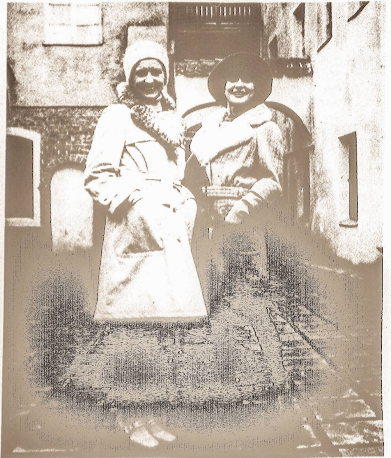
Lithuanian models demonstrate winter coats designed by the Vilnius House of Fashion.

"Five Centuries of the Statute of the Grand Duchy of Lithuania" is on exhibit, free of charge, through February 28, 1974, in The New York Public Library's Second Floor Central Corridor, Monday to Saturday, 9 A. M. to 6 P. M..