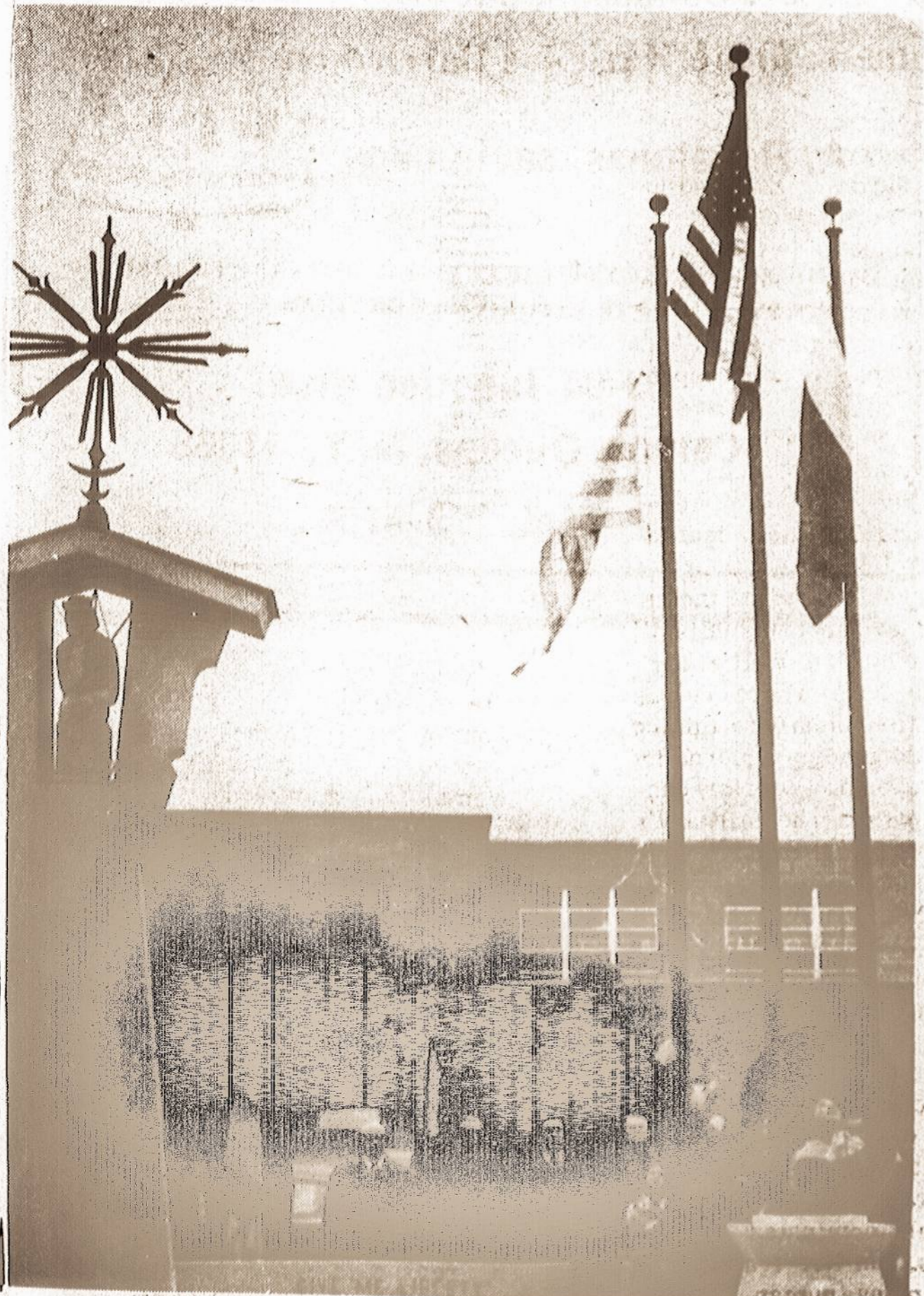
Vasario 16 proga pakeliamos veliavos prie paminklo šimtmečiui lietuviams atžymėti Clevelande, Ohio.

Koncerte svečių buvo iš Waterbury, New Haven, Manchester, Wethersfield, o iš New Britain - net keturiasdešimt dainos mėgėjų. JONAS BERNOTAS