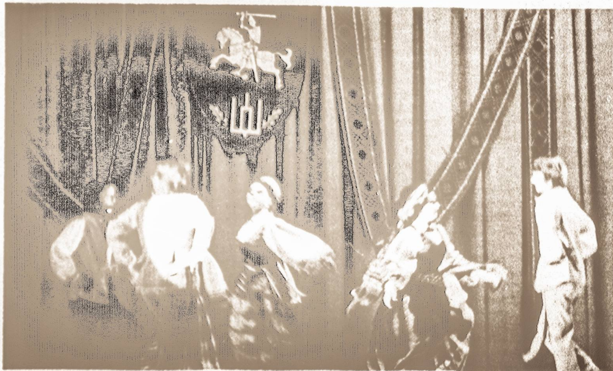
New Yorko taut. šokių grupė Vasario 16 minėjime Brooklyno Kult. Židinyje.