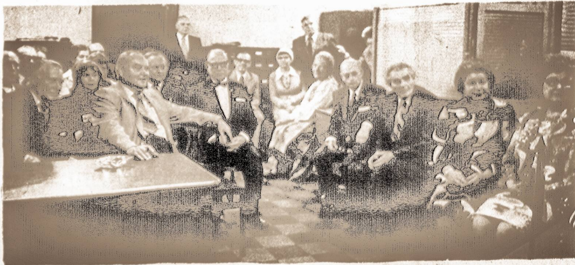
Dalis publikos SLA centre įvykusiame Vasario 16 minėjime š. m. kovo 2 d.